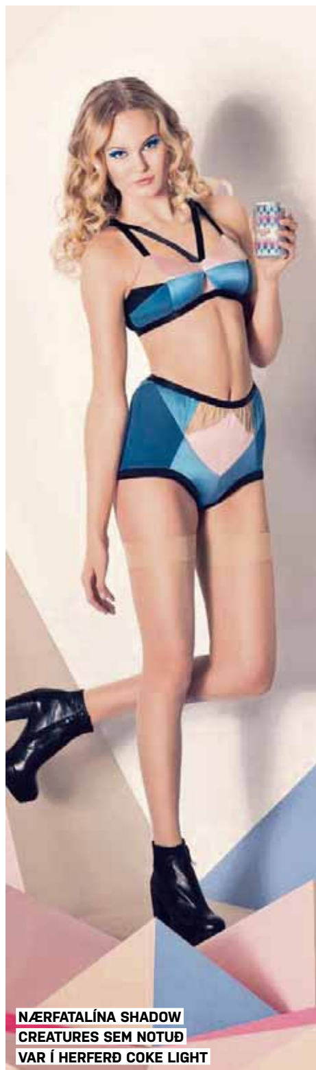
NÆRFATALÍNA SHADOW CREATURES SEM NOTUÐ VAR Í HERFERÐ COKE LIGHT