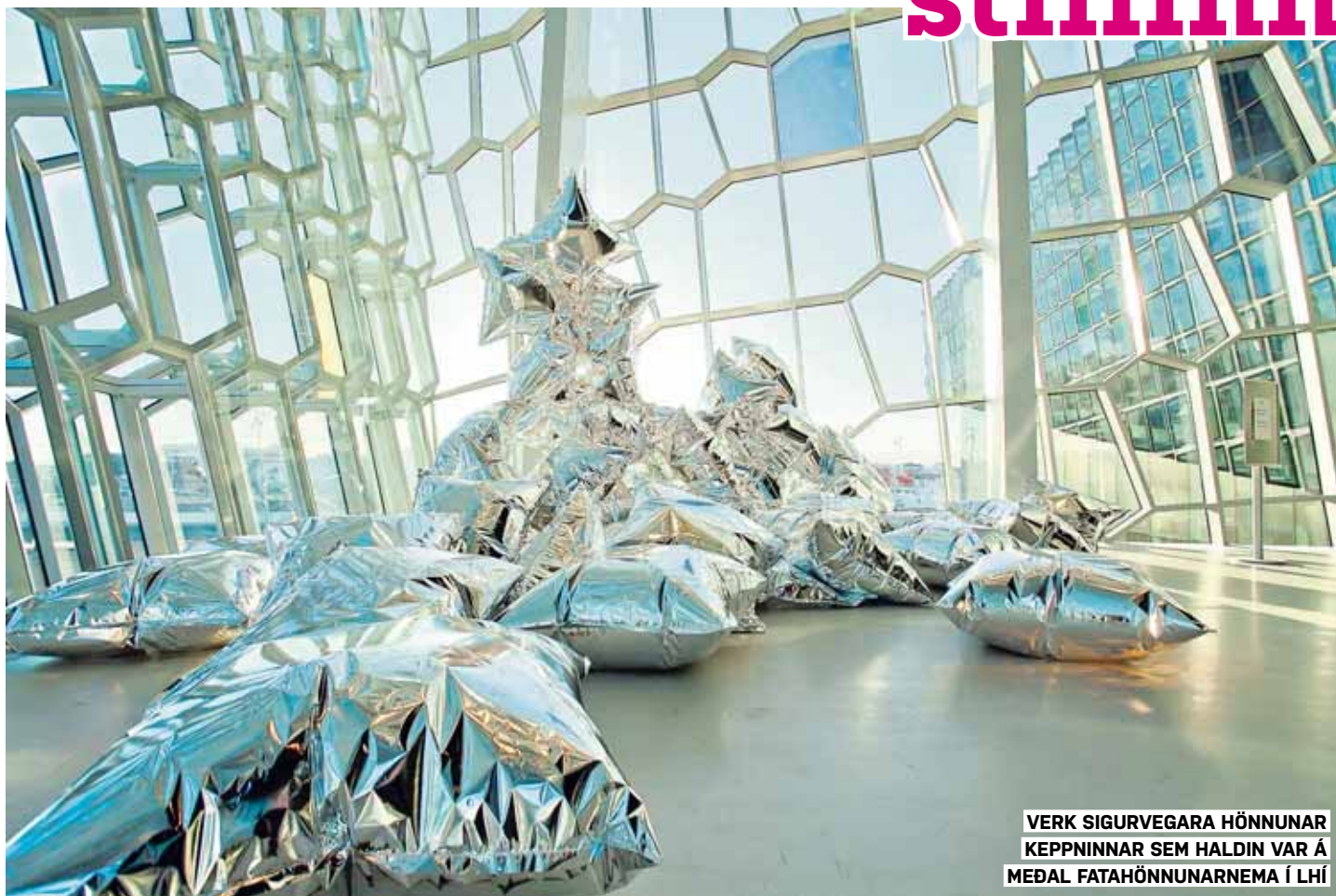
VERK SIGURVEGARA HÖNNUNAR KEPPINNAR SEM HALDIN VAR Á MEDAL FATAHÖNNUNARNEMA Í LHÍ