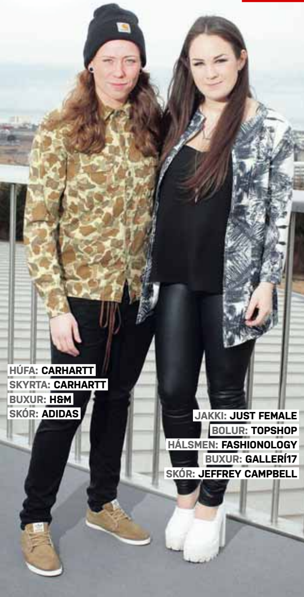
HÚFA: CARHARTT SKYRТА: CARHARTT BUXUR: H&M SKÓR: ADIDAS