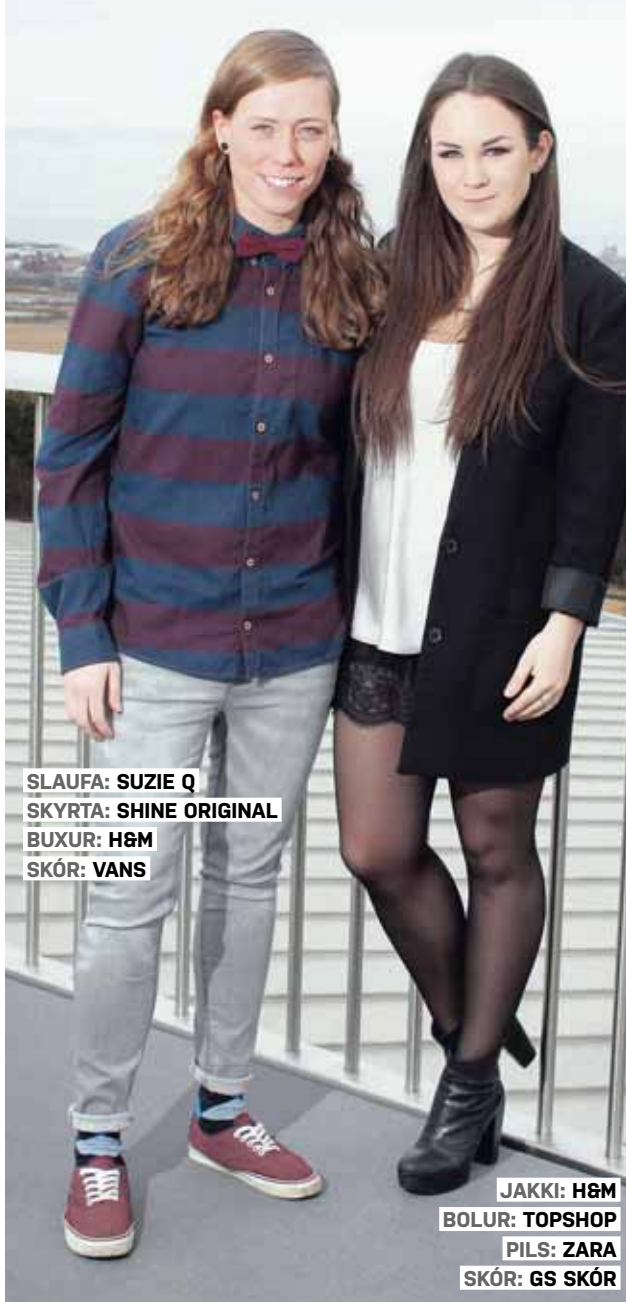
SLAUFA: SUZIE Q SKYRТА: SHINE ORIGINAL BUXUR: H&M SKÓR: VANS