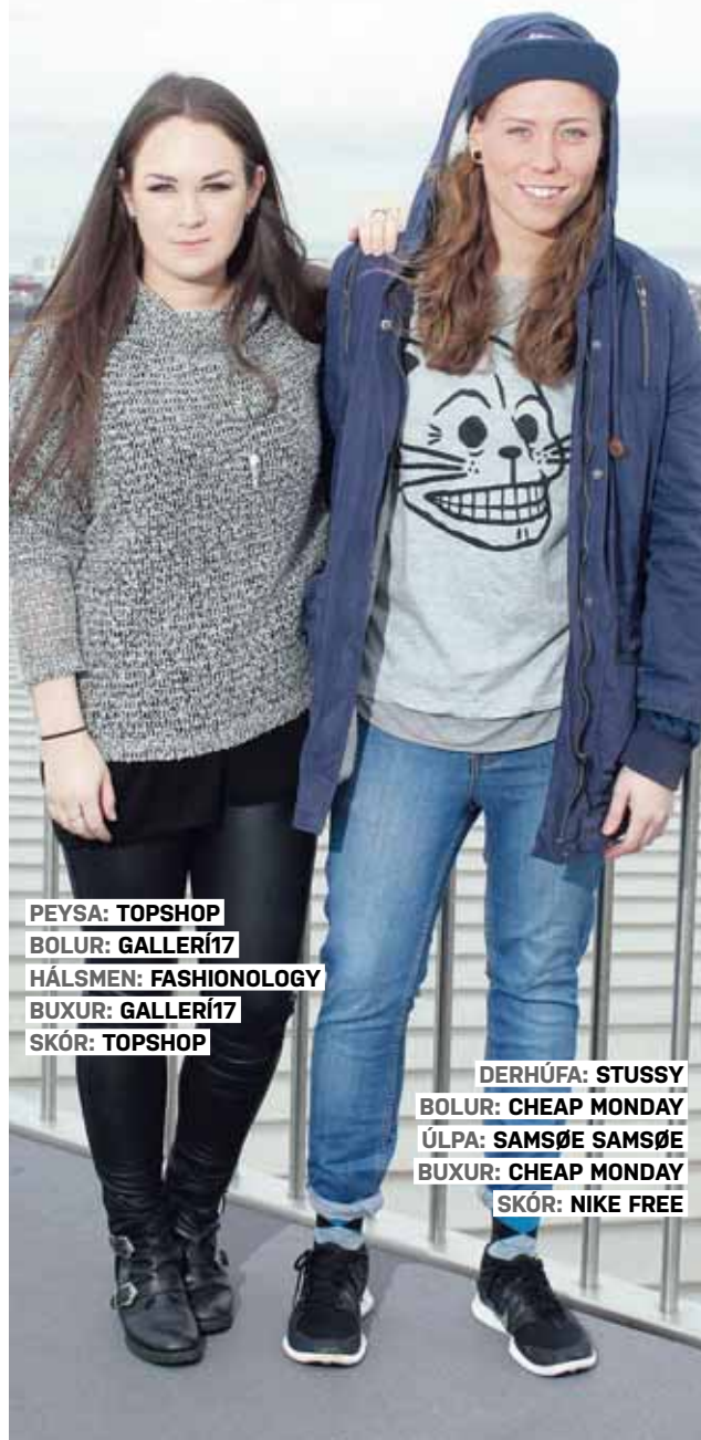
PEYSA: TOPSHOP BOLUR: GALLERÍ17 HÁLSMEN: FASHIOLOGY BUXUR: GALLERÍ17 SKÓR: TOPSHOP