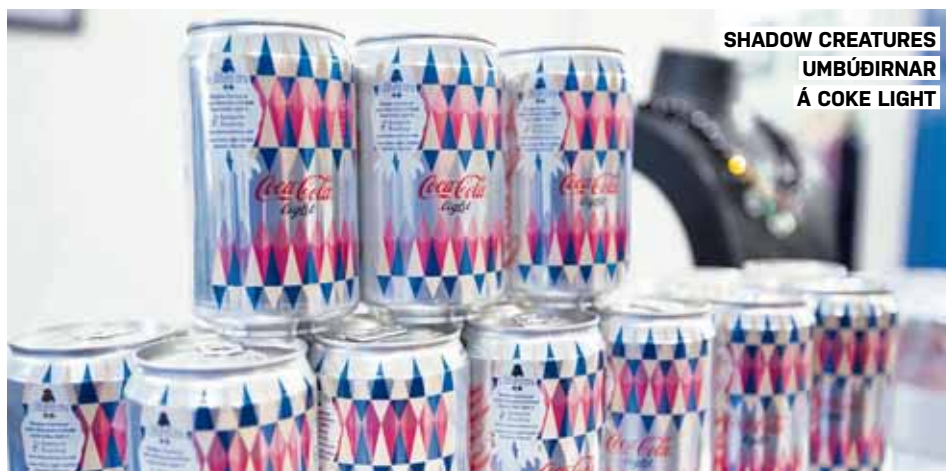
SHADOW CREATURES UMBÚÐIRNAR Á COKE LIGHT

nýtt að gera sem getur stutt og eftir þennan bransa og í ár ákváðum við að hafa þetta opið fyrir alla svo ef þú lumar á hæfileikum þá er um að gera að senda inn þitt framlag.“