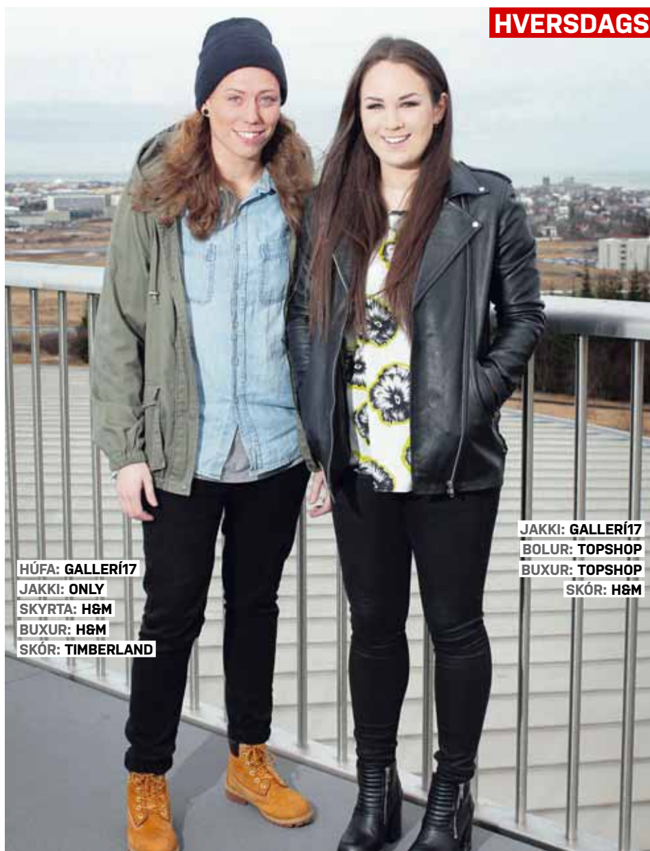
HÚFA: GALLERÍ17 JAKKI: ONLY SKYRТА: H&M BUXUR: H&M SKÓR: TIMBERLAND

Ragga: Vá ég hef reyndar aldrei farið í sérstakan verslunarleiðangur, en mollin í Tyrklandi eru mjög flott, ég hef verið mikið þar og verslað mikið þar. En ég er alltaf á leiðinni til Bandaríkjanna í verslunarferð, hef heyrt að það sé voðalegt sport.