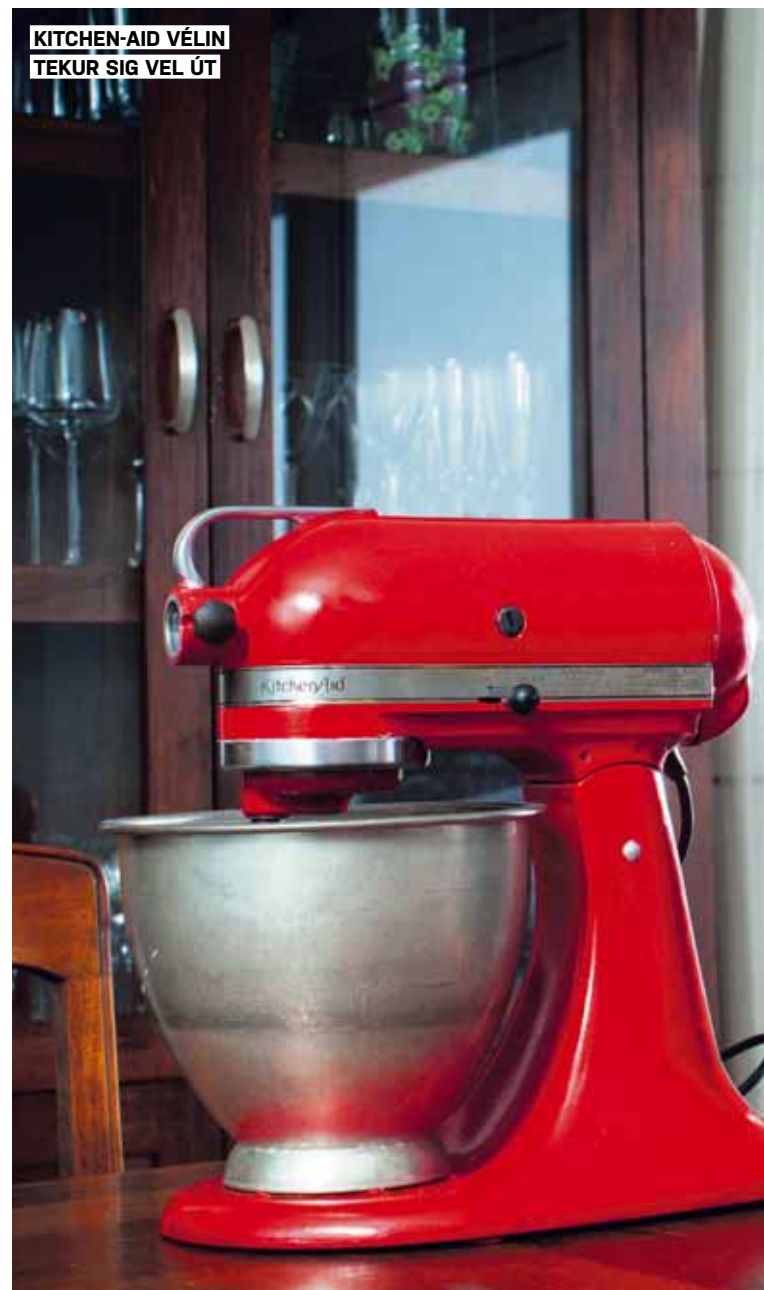
KITCHEN-AID VÉLIN TEKUR SIG VEL ÚT

Huldu Hvönn er margt til lista lagt en á þessum síðum kennir hún lesendum að gera gamla hrærivél glansandi fína.