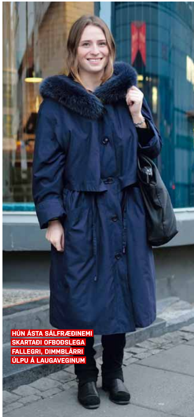
HÚN ÁSTA SÁLFRÆÐINEMI SKARTADI OFBÓÐSLEGA FALLEGRI, DIMMBLÁRRI ÚLPU Á LAUGAVEGINUM