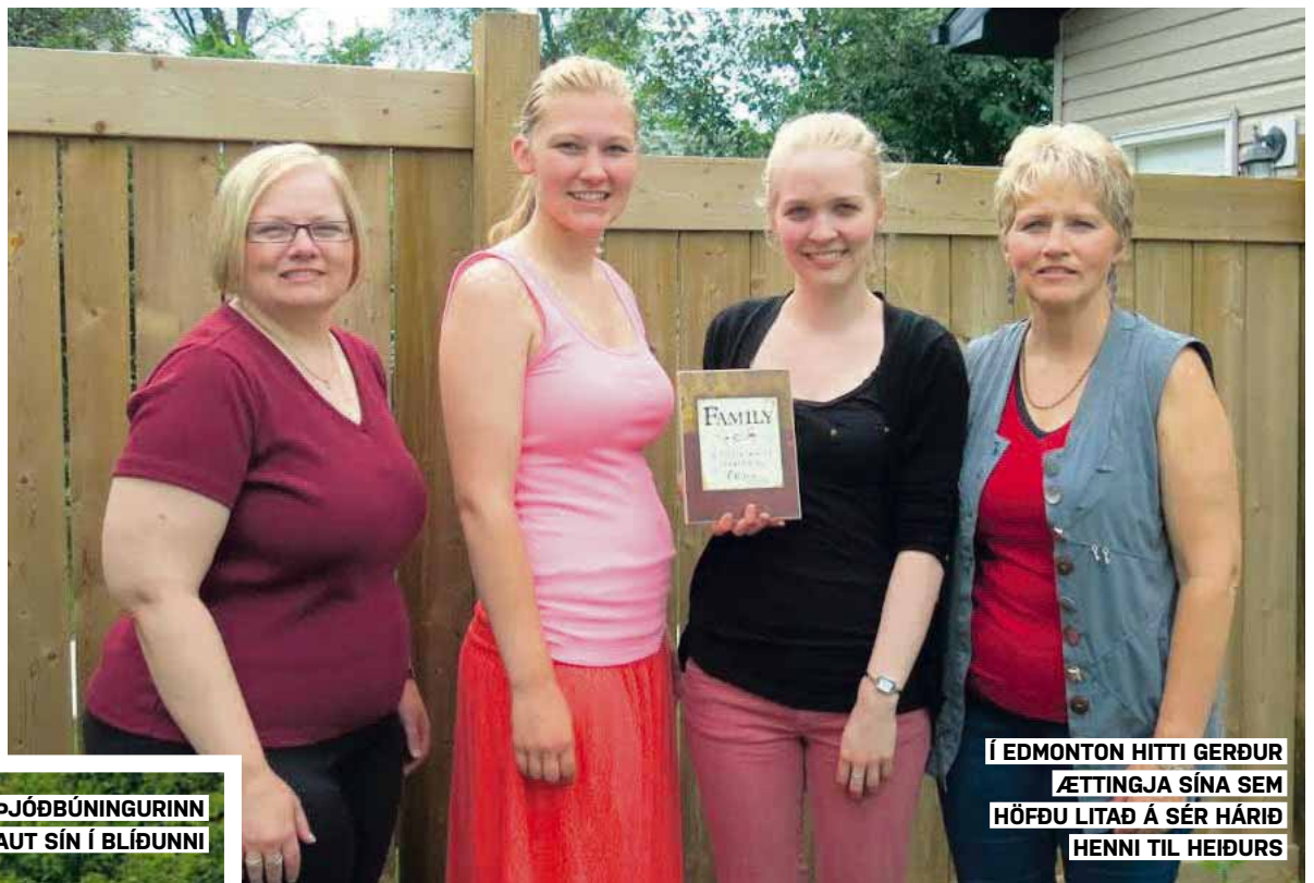
Í EDMONTON HITTI GERÐUR ÆTTINGJA SÍNA SEM HÖFÐU LITÁ Á SÉR HÁRIÐ HENNI TIL HEIÐURS