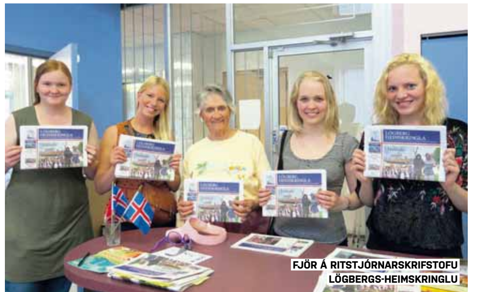
FJÖR Á RITSTJÓRNARSKRIFSTOFU LÖGBERGS-HEIMSKRINGLU

Dagskráin var í raun mjög þétt sem er þannig séð alveg skiljanlegt því það var auðvitað margt að sjá á stuttum tíma. Við flökkuðum líka svo mikið og að sjálfsögðu vildu heimamenn sýna okkur sem mest. Við fengum þó tvo heila frídaga og svo hluta af nokkrum öðrum dögum. Eftir á að hyggja er ég ánægð með hvernig þetta var, því auðvitað sá ég meira fyrir vikið, en meðan á ferðinni stóð hefði ég viljað aðeins meiri frítíma. Eftir suma dagana vorum við uppgufnar en það gerði ekkert til því það var alltaf svo gaman hjá okkur. Við höfðum kannski viljað fá aðeins meiri tíma til að versla en það bjargaðist alveg fyrir horn eftir að West Edmonton Mall var troðið inn í dagskrána.