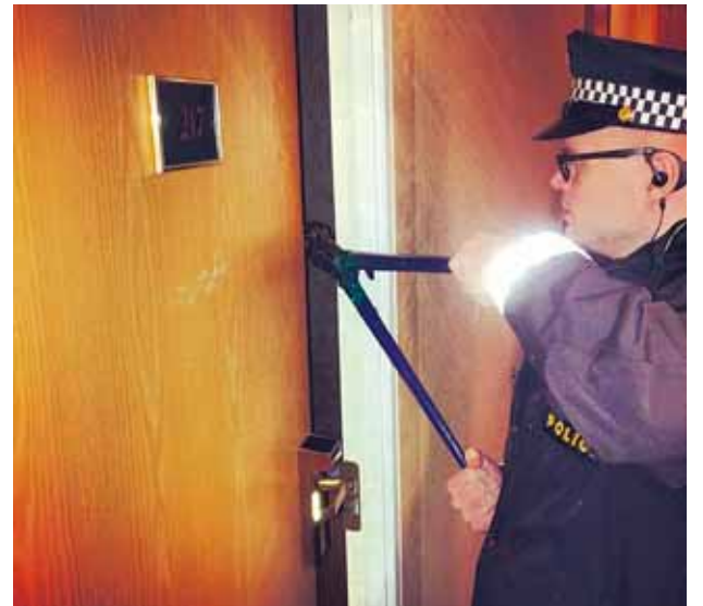
@logreglan Minnum fólk á að það þarf að bóka og borga fyrir hótélherbergi "We remind our readers of the need to book and pay for a hotel room" #hótelverkefni