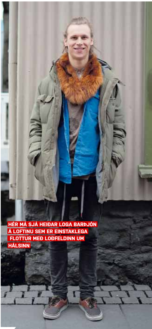
HÉR MÁ SJÁ HEIDAR LOGA BARÞJÓN Á LOFTINU SEM ER EINSTAKLEGA FLOTTUR MEÐ LOÐFELDINN UM HÁLSINN