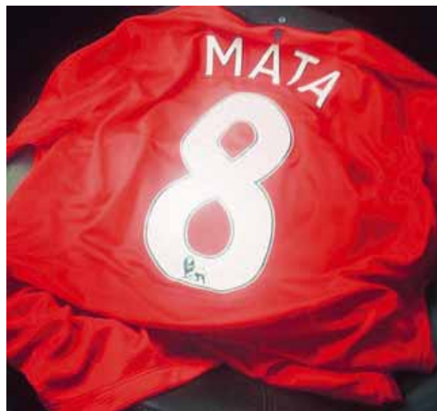
@audunblondal Áttaði mig þegar að ég stóð í Jóa útherja ásamt 6 öðrum unglingum sem urðu að merkja treyjuna sína að maður er hálf tæpur! Ert 33 ára, Auðunn...