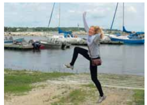
MYNDARLEGRI VÍKINGUR HEFUR SJALDAN SÉST

GERÐUR Fyrstu sex: 200789 Lag á heilanum: So Good to Me - Chris Malinchak Í bragðarefnið fæ ég mér: Þrist, jarðarber og banana Uppáhalds app: Gmail og Facebook