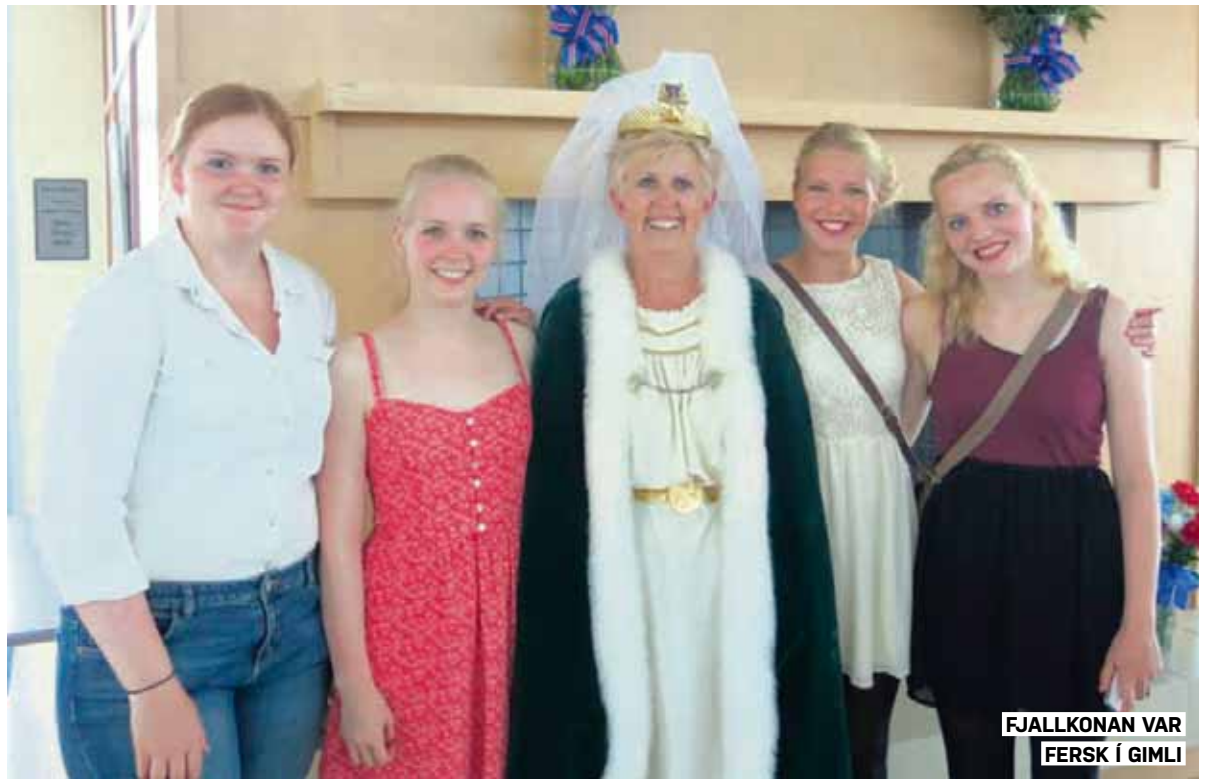
FJALLKONAN VAR FERSK Í GIMLI