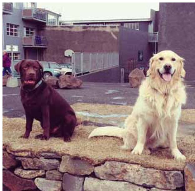
@gislimarteinn Tveir lauffléttir á Kexinu.