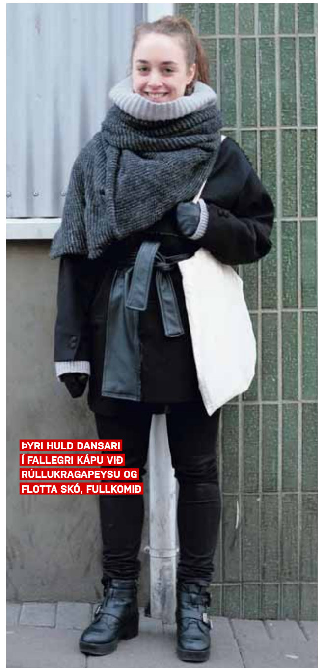
ÞYRI HULD DANSARI Í FALLEGRI KÁPU VIÐ RÚLLUKRAGAPEYSU OG FLOTTA SKÓ, FULLKOMIÐ