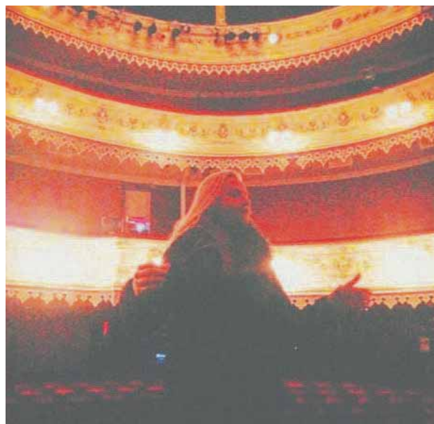
@hogniegilsson The Gothenberg Film Festival, Days of Grey International Premiere.

Merktu þína mynd með #monitormynd og vertu með í gleðinni. Myndirnar birtast sjálfkrafa á monitor.is auk þess sem sniðugir Instagrammarar geta nælt sér í glaðning því í hverri viku útnefnum við Monitormynd vikunnar .