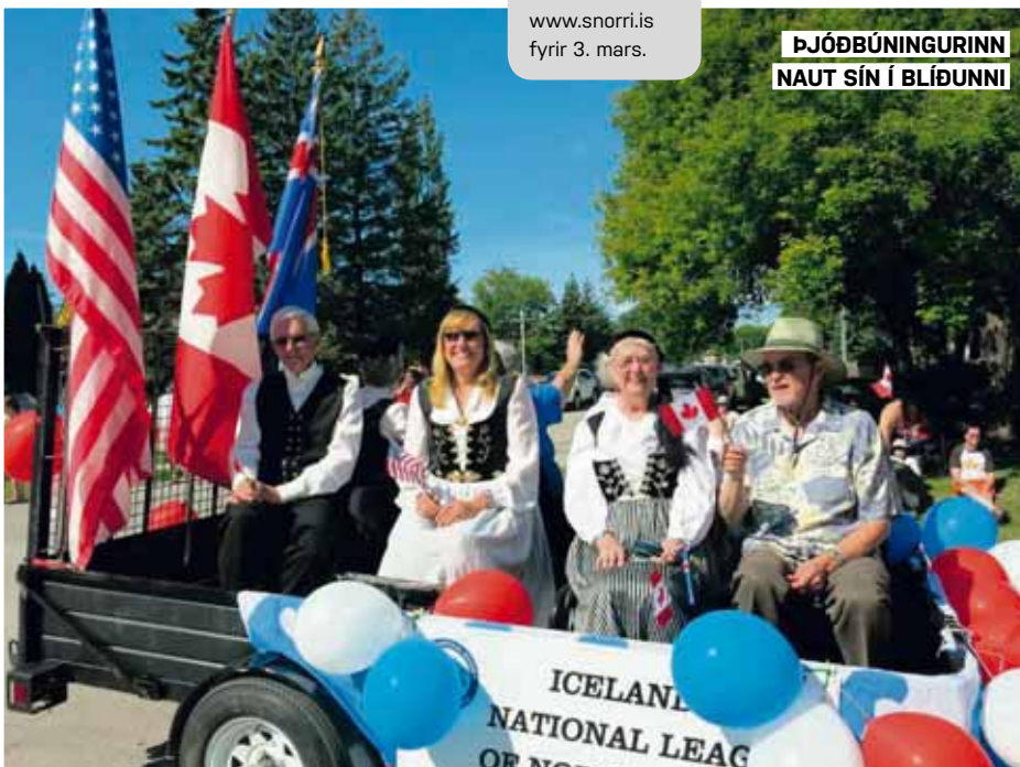
ÞJÓÐBÚNINGURINN NAUT SÍN Í BLÍÐUNNI

PSSST... Vilt þú ferðast á Íslendingaslóðir? Sæktu um á www.snorri.is fyrir 3. mars.