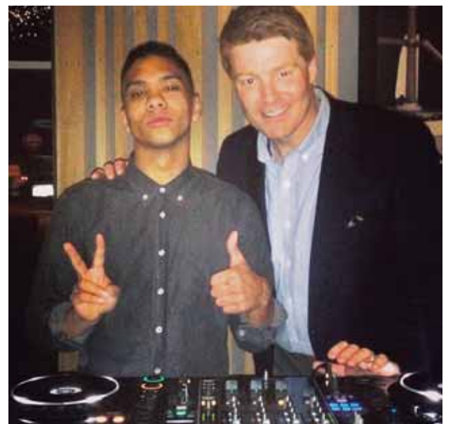
@simmivill Logi Pedro er með allt á hreinu! #fabrikkann14 #fabrikkannarshatid