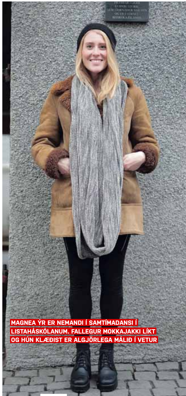
MAGNEA YR ER NEMANDI Í SAMTÍMADANSI Í LISTAHÁSKÓLANUM. FALLEGUR MOKKAJAKKI LÍKT OG HÚN KLÆÐIST ER ALGJÖRLEGA MÁLIÐ Í VETUR