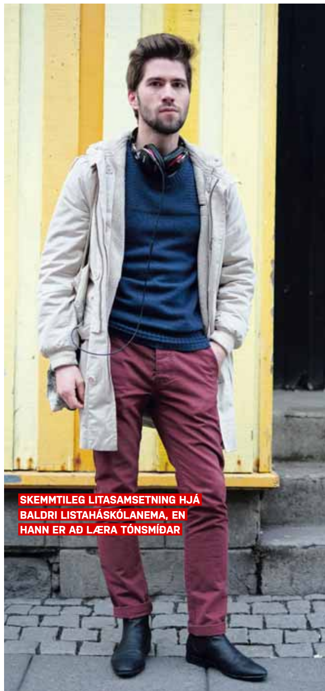
SKEMMTILEG LITASAMSETNING HJÁ BALDRI LISTAHÁSKÓLANEMA, EN HANN ER AÐ LÆRA TÓNSMÍÐAR