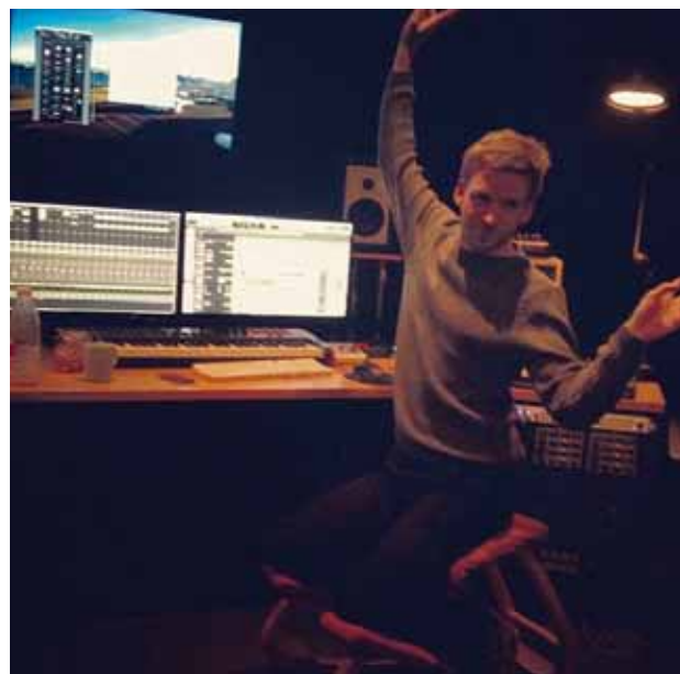
@unnureggerts Studio session með þessum @olafurarnalds