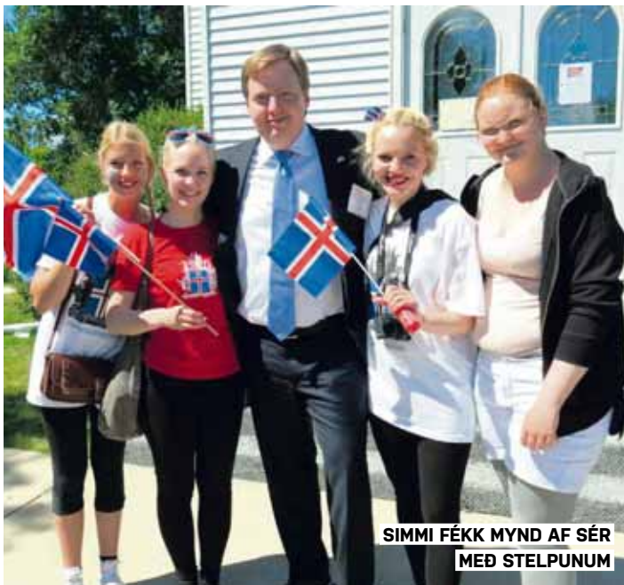
SIMMI FÉKK MYND AF SÉR MEÐ STELPUNUM