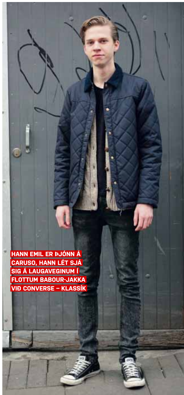
HANN EMIL ER ÞJÓNNA Á CARUSO, HANN LÉT SJÁ SIG Á LAUGAVEGINUM Í FLOTTUM BABOUR-JAKKA VIÐ CONVERSE – KLASSÍK