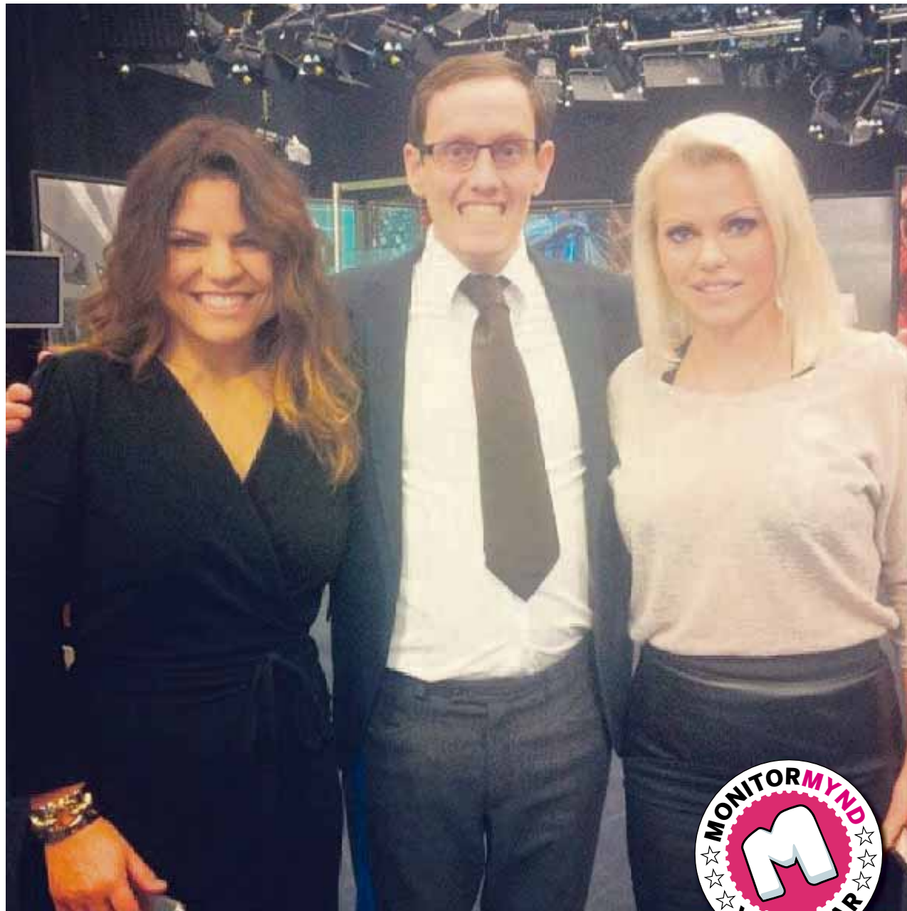
@gunnarsigur Viðtalsdrottningar #IceQueen #sMartaMaría