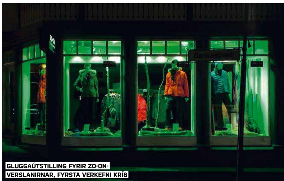
GLUGGAÚTSTILLING FYRIR ZO-ON-VERSLANIRNAR, FYRSTA VERKEFNI KRÍ8

Okkar fyrsta verkefni var gluggaústilling fyrir ZO-ON-verslanirnar. Konseptið var norðurljósaþema í skógi og við lékum okkur við það að höggva tré og gramsa eftir efnivið í Sorpu. Höfðum gaman af þessu.