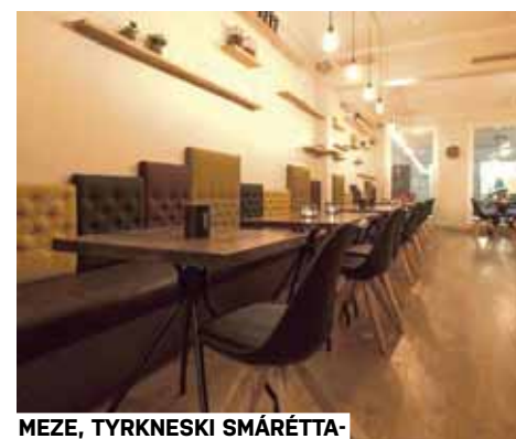
MEZE, TYRKNESKI SMÁRÉTTA-STAÐURINN SEM KRÍ8 HANNAÐI Í SAMSTARFI VIÐ EIGENDUR

Í síðustu viku vorum við að skila af okkur tillögum varðandi breytingar innanhúss fyrir Skautahöllina í Laugardal og við vonumst til að sjá þær verða að veruleika. Þau verkefni sem eru framundan eru af mismunandi toga og á teikniborðinu eru einnig nokkrar vörur sem okkur langar til að vinna meira með og setja í framleiðslu. Við viljum hafa nóg að gera