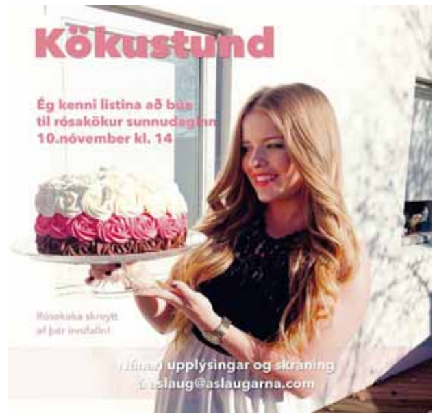
@aslaugarna Já ég sló til! Þá er spurning hvort þið séuð til?