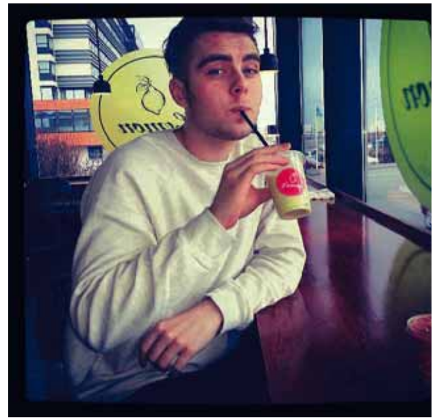
@jggeirdal Poppstjörnur elska Lemon #steinar #imgoingUP