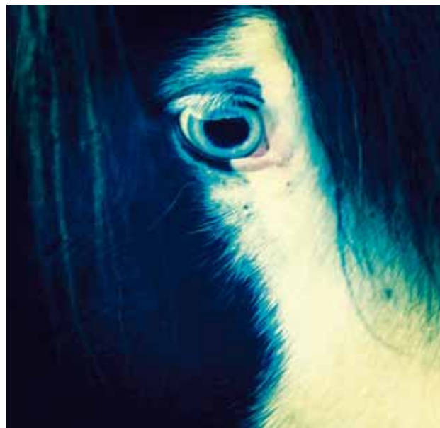
@nadiasif00 #vikurfrettir #monitormynd