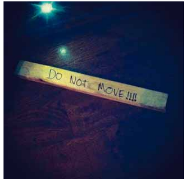
@berglindfestival Ég hrinti þessari spýtu óvart. Nú þori ég ekki að hreyfa mig