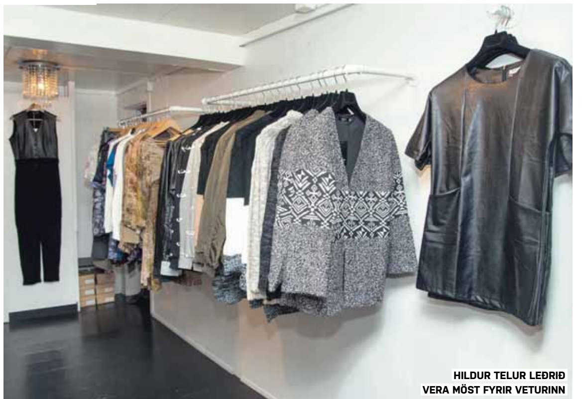
HILDUR TELUR LEÐRIÐ VERA MÓST FYRIR VETURINN

Eitthvað úr leðri, hvort sem það er kjóll, jakki, buxur eða pils. Falleg og kósi peysa og góð vetrarboots.