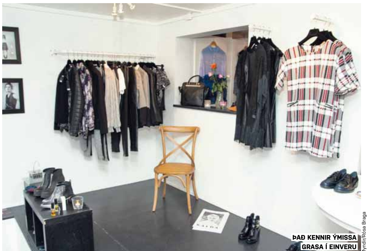
ÞAÐ KENNIR ÝMISSA GRASA Í EINVERU