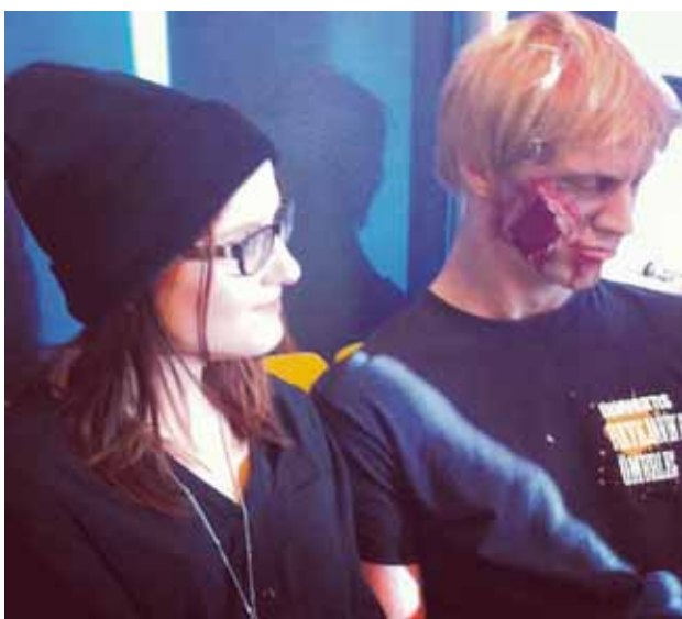
@monitormynd Þessi tvö eru voða skotin hvort í öðru þrátt fyrir að hún rífi reglulega í andlitid á honum #monitormynd #zombie