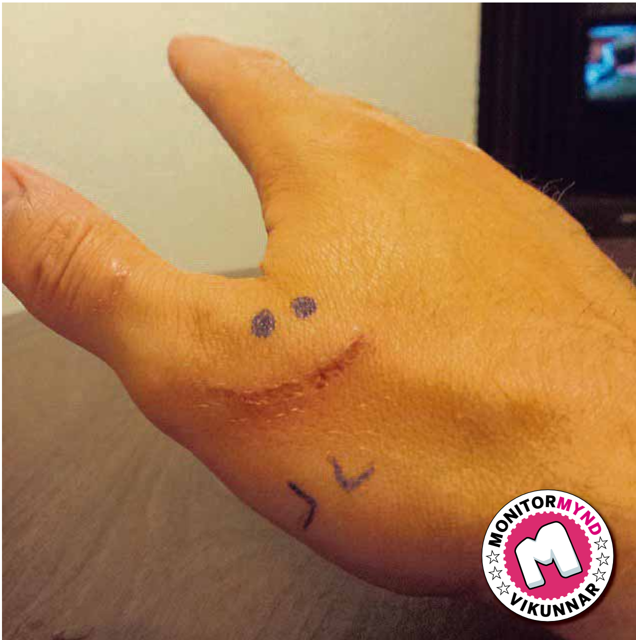
@stebbiolfus Brosi í gegnum sárin #ofharðurfyrirhanska #sárbrósogtakaskór #monitormynd