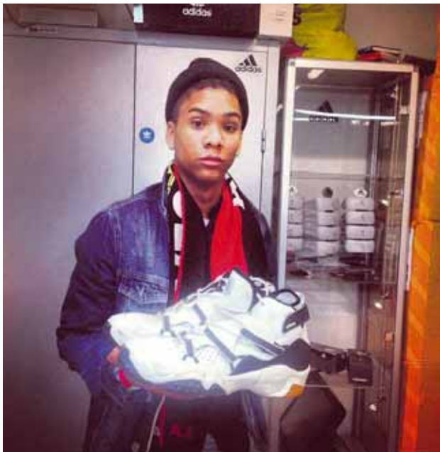
@unistefson Fundum skóna hans Duranona! #hissa #adidas #handball #duranona

Ert þú í Instahring Monitor? Merktu þína mynd með #monitormynd og vertu með í gleðinni. Myndirnar birtast sjálfkrafa á monitor.is auk þess sem sniðugir Instagrammarar geta nælt sér í glaðning því í hverri viku útnefnum við Monitormynd vikunnar .