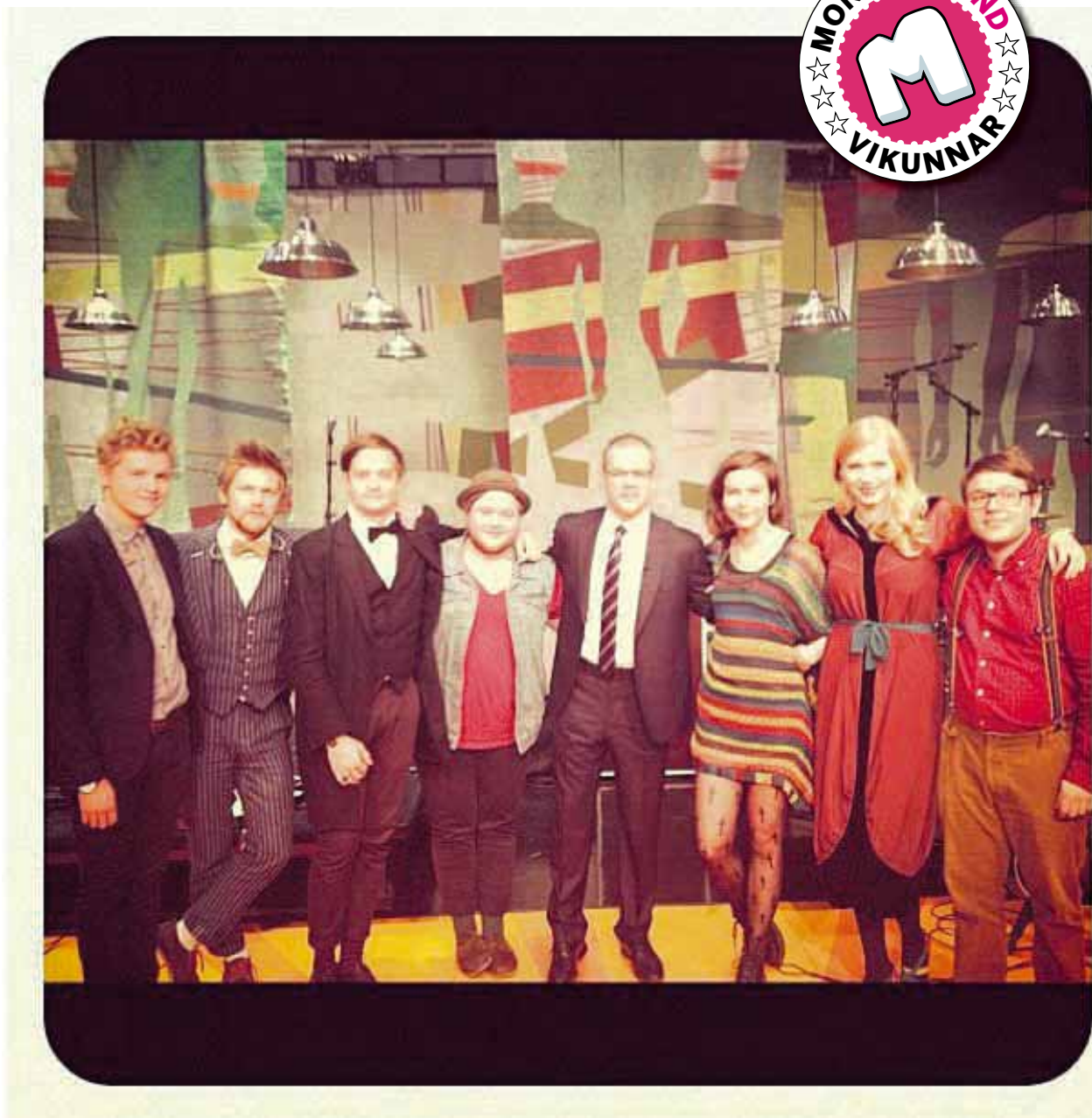
@ofmonstersandmen and Matt Damon