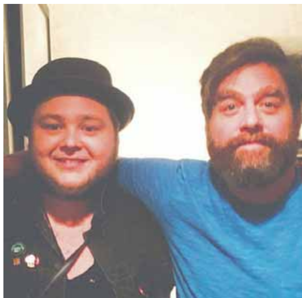
@ofmonstersandmen Long lost brothers