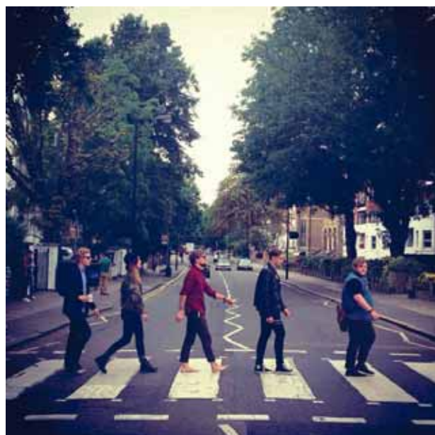
@ofmonstersandmen All you need is gloves