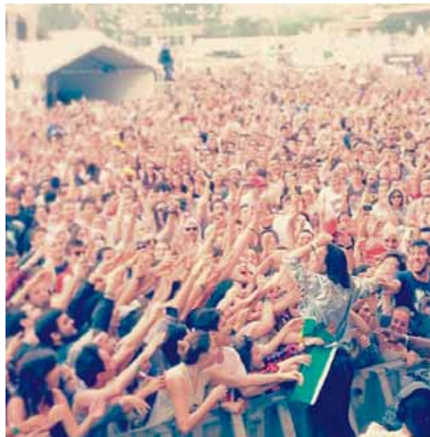
@ofmonstersandmen BRASILÍA <3

Ert þú í Instahring Monitor? Merktu þína mynd með #monitormynd og vertu með í gleðinni. Myndirnar birtast sjálfkrafa á monitor.is auk þess sem sniðugir Instagrammarar geta nælt sér í glaðning því í hverri viku útnefnum við Monitormynd vikunnar .