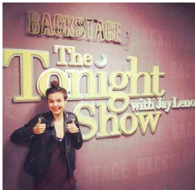
@ofmonstersandmen JAY LENO!!!!