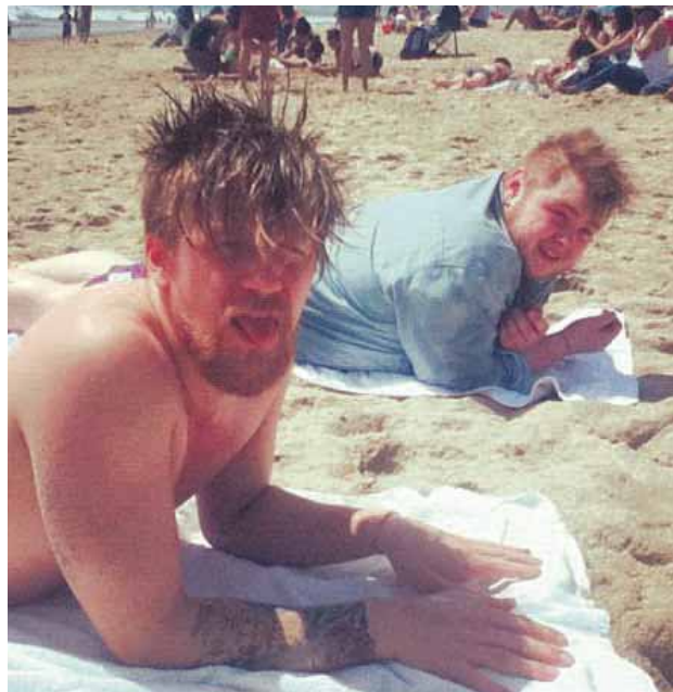
@ofmonstersandmen Days off feel sooooo good