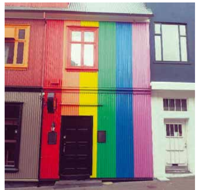
iheartreykjavik Kiki #reykjavik #iceland #reykjavikpride