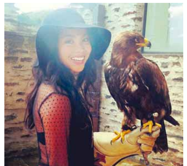
trendpattra Moment of the day #önugur #eagle #trendnet #monitormynd