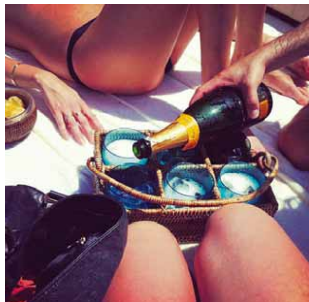
thorunnantonia Champagne o'clock #imonaboat

Ert þú í Instahring Monitor? Merktu þína mynd með #monitormynd og vertu með í gleðinni. Myndirnar birtast sjálfkrafa monitor.is auk þess sem sniðugir Instagrammarar geta nælt sér í glaðning því í hverri viku útnefnum við Monitormynd vikunnar .