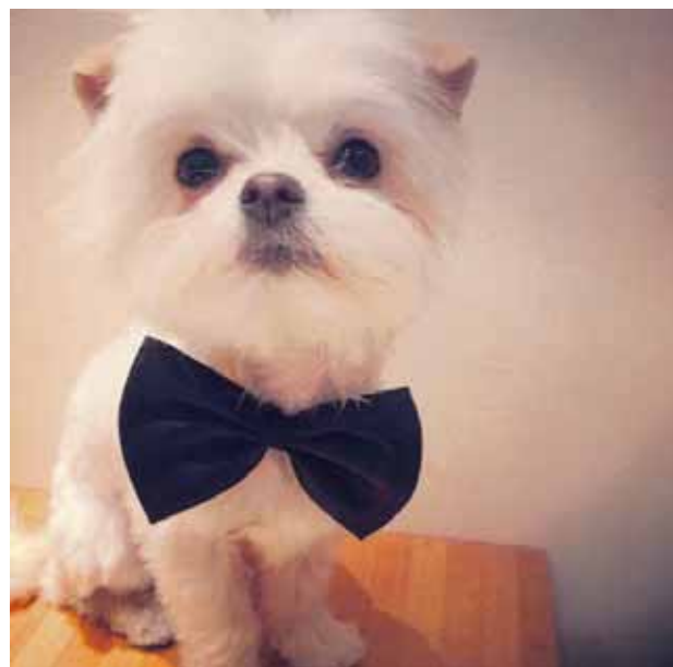
tommithedog Working my new haircut #stylish #short #fresh #theladiesloveme #workingit #lovinglife #monitormynd #ellenshow #puppy #dog #tommithedog