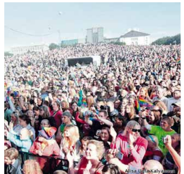
reykjavikpride The crowd at Reykjavik Pride 2011, up to 100 thousand people. #reykjavikpride