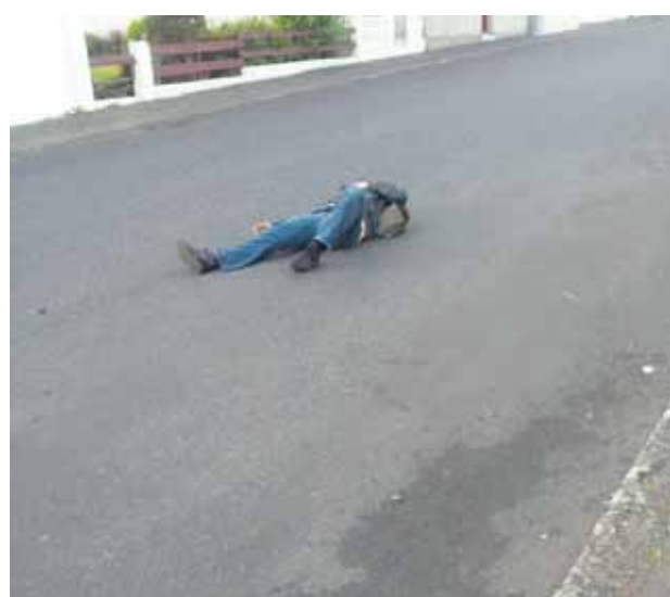
valarunv Menn búnir því á Þjóðhátíð #dalurinn #allin #monitormynd @saedisdrofn