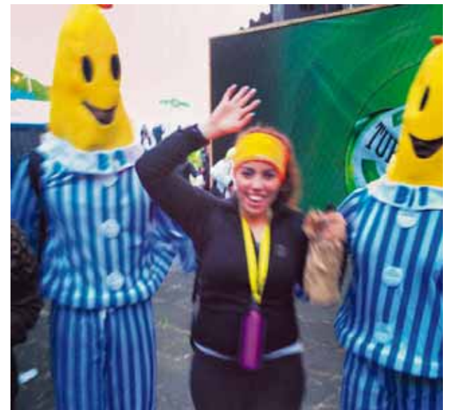
ingibjorgjenny Ég, bananarnir og hvítvínsflaskan á Þjóðhátíð! #dalurinn #þjóðhátíð2013