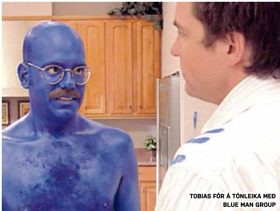
TOBIAS FÓR Á TÓNLEIKA MEÐ BLUE MAN GROUP

er hann orðinn einhver brjóstumkennanleg David Brent/ Michael Scott-týpa og ég er ekki hrifinn af því. Þar sem ég var ekkert í mínum hæstu gleðihæðum við áhorf á fyrstu þættina ákvað ég að prófa að horfa á einn þátt í annað skipti. Þá fékk ég fnykinn af þessari gömlu góðu Arrested -snilldartilfinningu og sá mjög góða brandara sem ég þældi ekki í við fyrsta áhorf (A NU START). Það er samt smá-galli að þurfa að horfa á þátt tvisvar sinnum til að vera sáttur en þar sem ég held mikið með þáttunum þá ég ætla ég að skrifa vonbrigði fyrsta áhorfs á yfirdrífna væntingar af minni hálfu. Ég hef samt aðeins verið að hlera móttökurnar í kringum mig og þær gætu verið betri. Sama hvernig fer þá er ég samt mjög ánægður með að það sé kominn ný þáttaröð af A.D. Fari þó svo að nýja þáttaröðin verði ekki á pari við fyrri þáttaröðir þá er ég búinn að sjá nóg til að dæma um að þetta er alls ekkert Prison Break-framhald sem muni eyðileggja arfleifð þáttanna. Núna bið ég spennur eftir lausum tíma í dagskránni hjá mér til að klára nýju þáttaröðina og svo horfa á hana aftur... og aftur og uppgötva nýja og falda brandara.