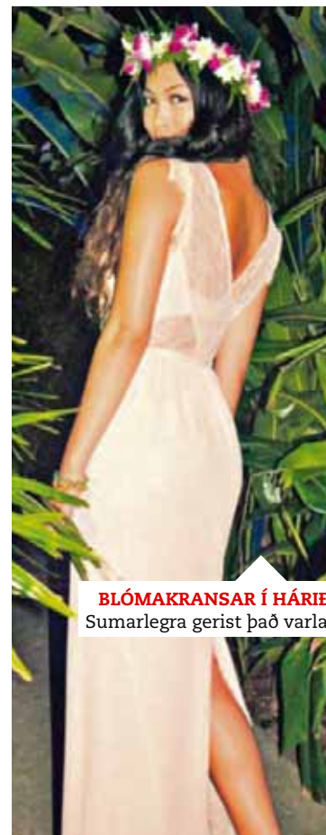
BLÓMAKRANSAR Í HÁRIÐ Sumarlegra gerist það varla.