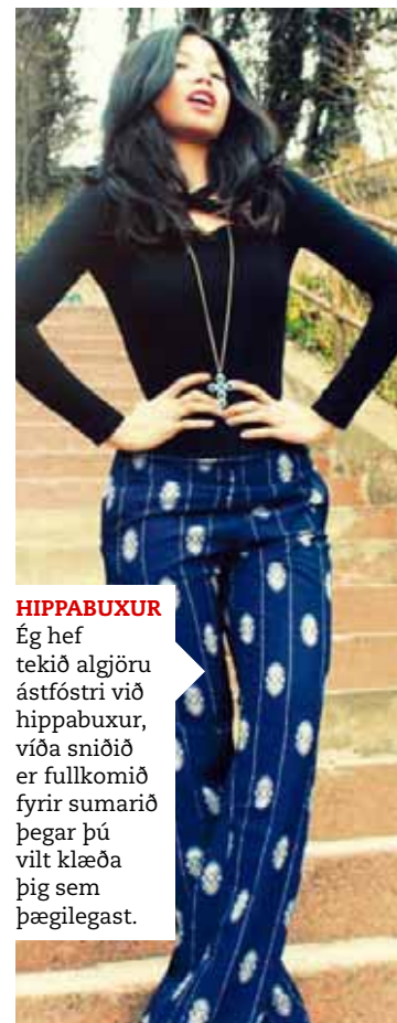
HIPPABUXUR Ég hef tekið algjöru ástföstri við hippabuxur, víða sniðið er fullkomið fyrir sumarið þegar þú vilt klæða þig sem þægilegast.

DERHÚFUR Snilldin ein á slæmum hárdegi ásamt því að vernda hausinn á heitum degi. Ég dýrka derhúfurnar frá danska Wood Wood.