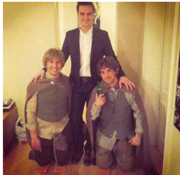
@bjornbragi Hobbitarnir @audunnblondal og @sverrirbergmann.