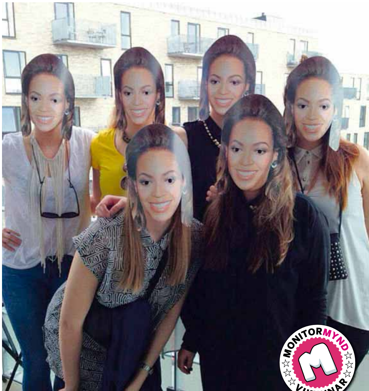
@bjorkb Hey...its your girl, B !! @beyoncey #beyonce