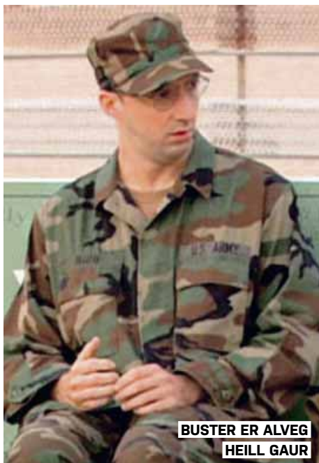
BUSTER ER ALVEG HEILL GAUR

er hann orðinn einhver brjóstumkennanleg David Brent/ Michael Scott-týpa og ég er ekki hrifinn af því. Þar sem ég var ekkert í mínum hæstu gleðihæðum við áhorf á fyrstu þættina ákvað ég að prófa að horfa á einn þátt í annað skipti. Þá fékk ég fnykinn af þessari gömlu góðu Arrested -snilldartilfinningu og sá mjög góða brandara sem ég þældi ekki í við fyrsta áhorf (A NU START). Það er samt smá-galli að þurfa að horfa á þátt tvisvar sinnum til að vera sáttur en þar sem ég held mikið með þáttunum þá ég ætla ég að skrifa vonbrigði fyrsta áhorfs á yfirdrífna væntingar af minni hálfu. Ég hef samt aðeins verið að hlera móttökurnar í kringum mig og þær gætu verið betri. Sama hvernig fer þá er ég samt mjög ánægður með að það sé kominn ný þáttaröð af A.D. Fari þó svo að nýja þáttaröðin verði ekki á pari við fyrri þáttaröðir þá er ég búinn að sjá nóg til að dæma um að þetta er alls ekkert Prison Break-framhald sem muni eyðileggja arfleifð þáttanna. Núna bið ég spennur eftir lausum tíma í dagskránni hjá mér til að klára nýju þáttaröðina og svo horfa á hana aftur... og aftur og uppgötva nýja og falda brandara.