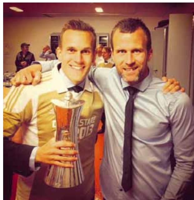
@logivalg champione! #cupfinal2013