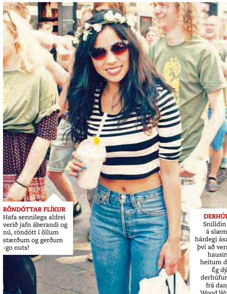
RÖNDÓTTAR FLÍKUR Hafa sennilega aldrei verið jafn áberandi og nú, röndótt í öllum stærðum og gerðum -go nuts!

byrjar á Bostonferð í heimsókn til góðra vina, síðan verður haldið til yndis Íslands sem við hjúin ætlum að njóta með okkar bestustu. Skemmtilegt að segja frá því að þetta sumar verður brúðkaups-sumarið mikla þar sem ég er á leiðinni í hvorki meira né minna en 4 brúðkaup. Það er greinilegt að maður er að eldast!