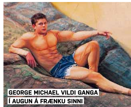
GEORGE MICHAEL VILDI GANGA Í AUGUN Á FRÆNKU SINNI

Varðandi nýju þættina: Þegar þetta er skrifað er ég búinn að sjá fyrstu sjö þættina. Þeir eru byggðir upp öðruvísi en áður þar sem saga eins karthers er sögð í hverjum þætti. Það er margt jákvætt í gangi en einnig neikvætt. Það sem stuðar mig helst er hvernig Michael Bluth er skrifaður. Ef þið hugsið um Jim Halpert í The Office: Hann er umkringdur steiktu liði og horfir svona til manns í myndavélina og segir með augnaráðinu: „Hvar er ég eiginlega og í hverju er ég lentur?“ Maður tengir við hann og kemur reiðu á þennan óraunhæfa og ruglaða heim. Þannig hefur Michael Bluth alltaf verið í A.D. en núna