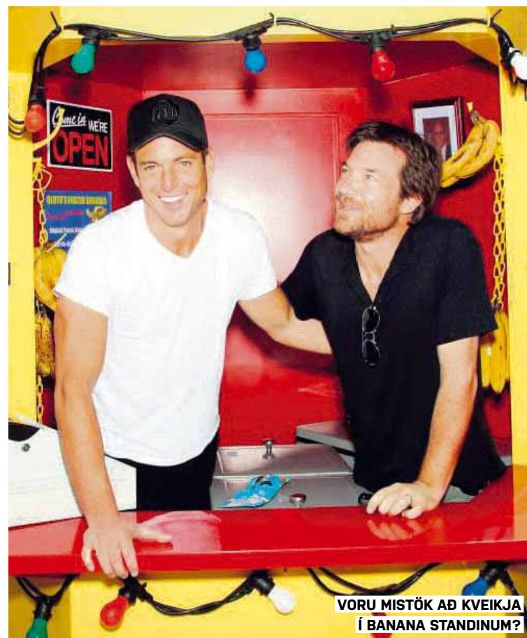
VORU MISTÖK AÐ KVEIKJA Í BANANA STANDINUM?

www.murameistarar.is – murmeist@centrum.is