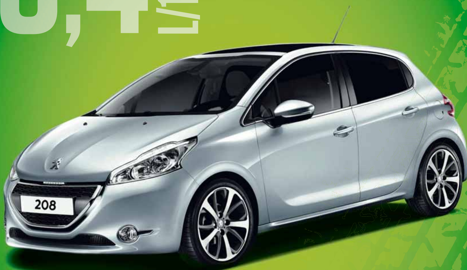
Myndin sýnir Peugeot 208 í Allure útfærslu.