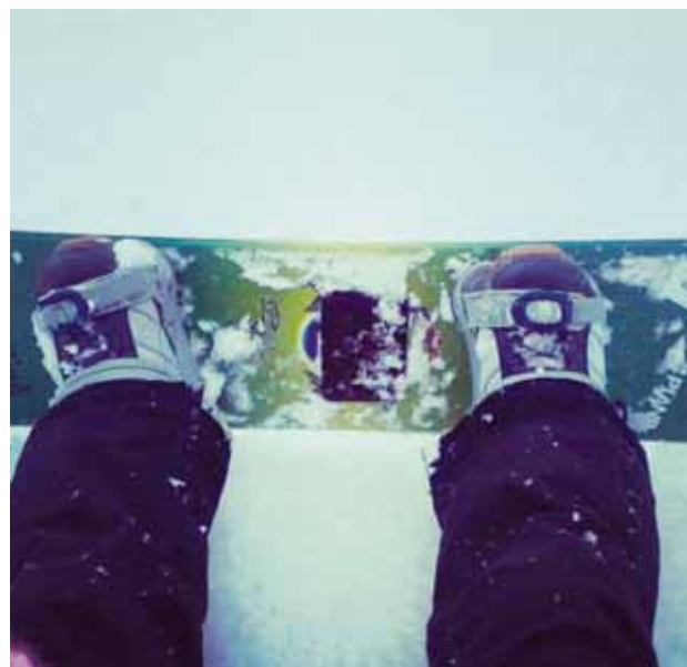
@saralind1998 Bláfjöll í dag :) #páskar #monitormynd Það er fátt eins páskalegt og að smella sér á skíði eða bretti.