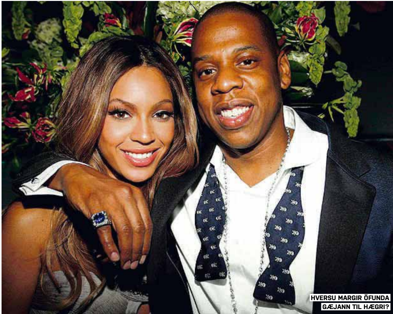
HVERSU MARGIR ÖFUNDA GÆJANN TIL HÆGRI?

CODEINE OLAJUWON @JODDYHIGHROLLER SCIENTISTS AGREE THAT WHEN GIRLS WEAR THE NEON ICON SHIRTS THAT THEY BECOME ALLERGIC TO PANTS: