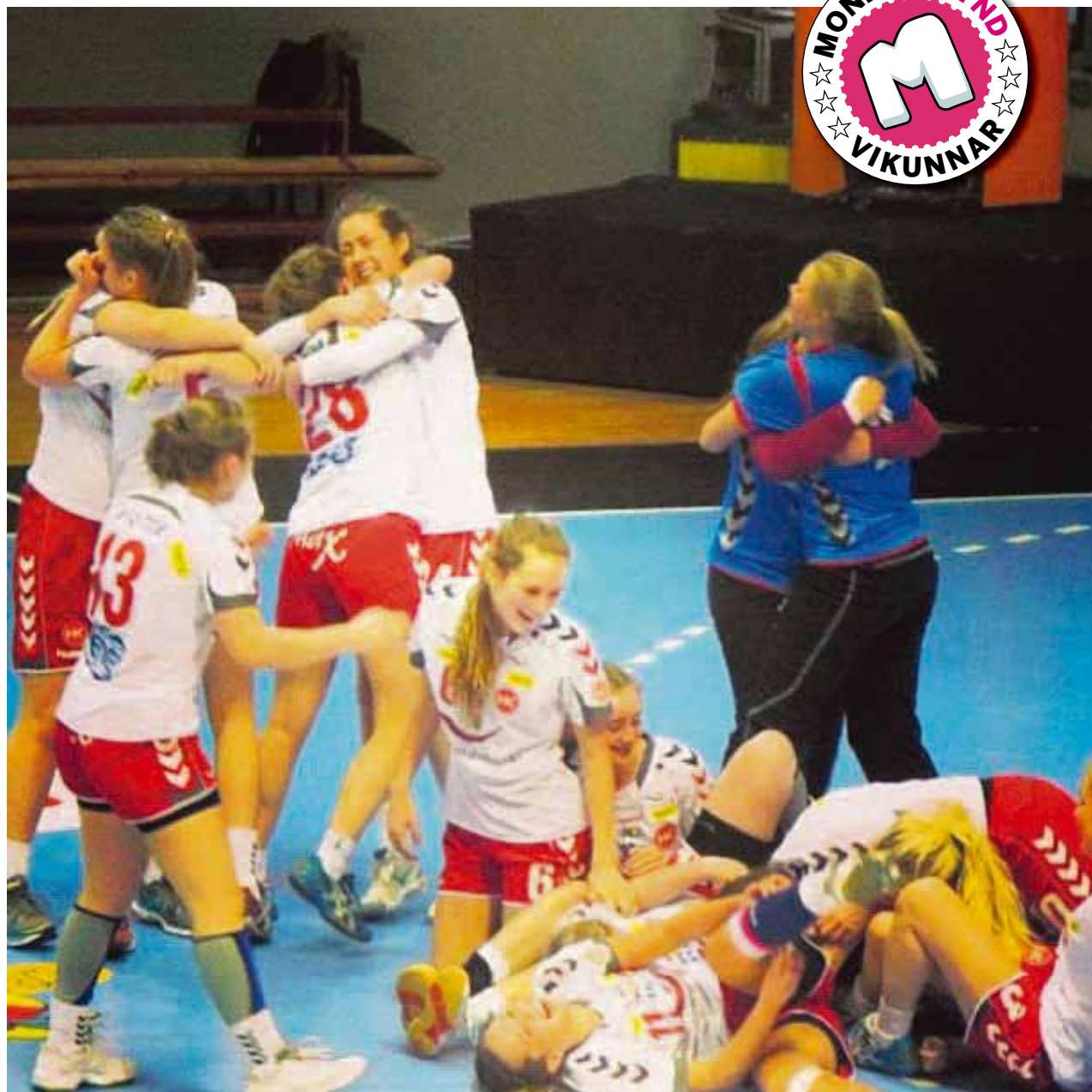
@thorhildurb97 Aðeins of mikil gleði á einni mynd, bikarmeistarar 2013 #simabikarinn #bikarmeistarar2013 #monitormynd #páskar