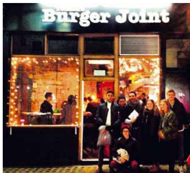
@unistefson iiiiiiiiiiiiaaaadðð! @burgerjointuk Krakkarnir í Retro Stefson fylltust líka þjóðarstolti fyrir utan Hamborgarabúlluna hans Tomma í London.