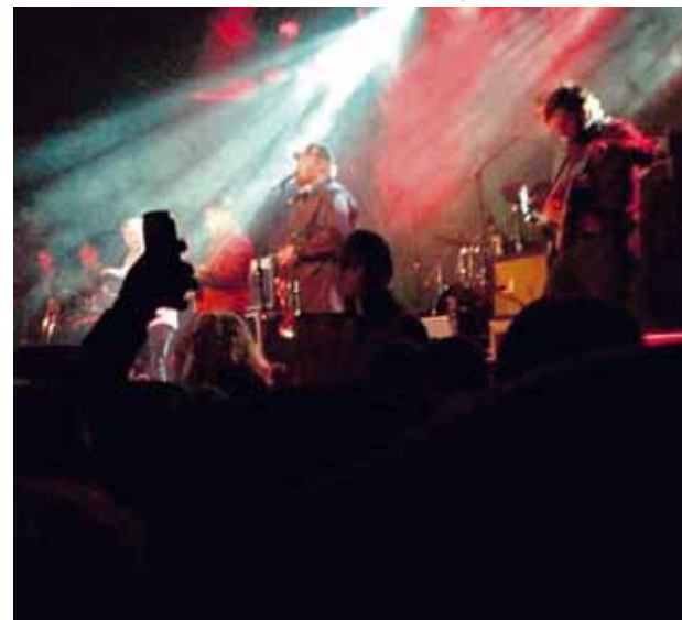
@kolbrunnars Valdimar my love #aldrei2013 #afés #páskar #monitormynd Tvöfalt hashtag hjá Kolbrúnu, #monitormynd og #páskar. Vel gert!