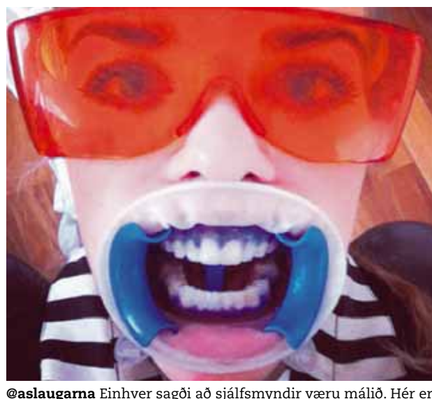
@aslaugarna Einhver sagði að sjálfsmýndir væru málið. Hér er ein í stund milli stríða, gera kjaftinn alveg kláran og bláan fyrir síðasta sprett baráttunnar #djók #töffarihjátanssa Það borgar sig að hafa tennurnar í lagi í kosningabaráttunni.