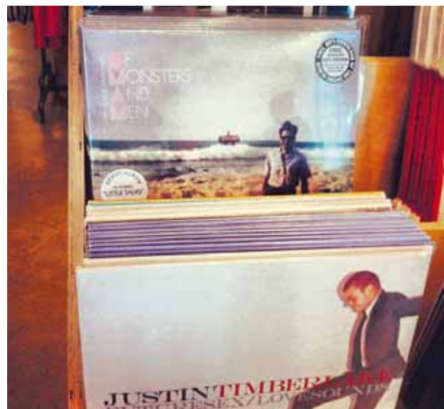
@monitormynd Of Monsters and Men í vinyllöturrekkanum í Urban Outfitters. Áfram Ísland! #monitormynd #omam blaðamaður Monitor fylltist íslensku þjóðarstolti í henni Ameríku.

Ert þú í Instahring Monitor? Bondaðu við okkur með hashtagginu #monitormynd. Vikulega getur þú svo nælt þér í vinninga með því að notast einnig við hashtag vikunnar. Hashtag vikunnar 11. apríl - 18. apríl er #vorlofti en hæfleikararíkir Instagrammar gætu nælt sér í gjafabréf á hina einu sönnu Hamborgarafabrikku.