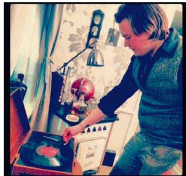
@evabjork7 Í góðu party með stórkostlegum plötuspilara og awesome Rafha-eldavé! #monitormynd Eva fær hrós fyrir að deila með okkur góðu teiti. Ef þú ert á leið í húllumhæ þá kannski splæsir þú í #monitormynd