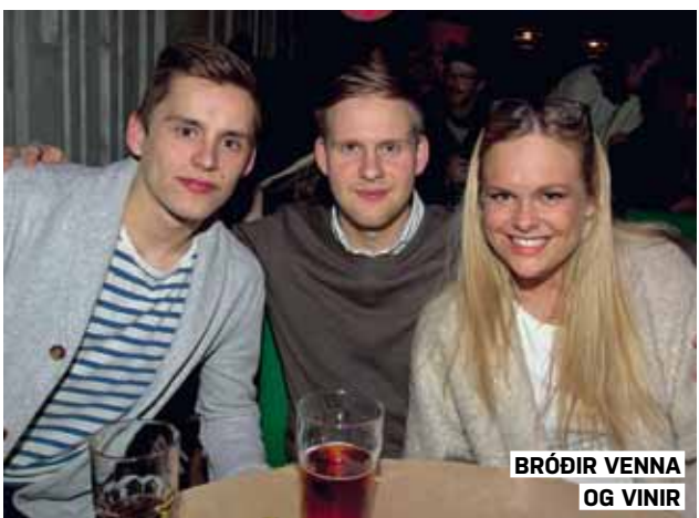
BRÓÐIR VENNA OG VINIR