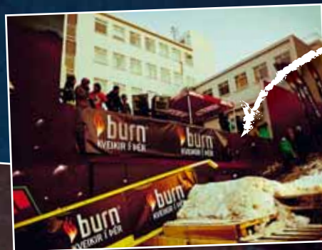
Hjð sívinsæla BURN Jib mót á föstudagskvöldinu í göngugötunni á Akureyri kl. 21.00