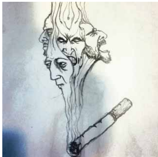
@sverrirbergmann Bullið sem vellur úr höndunum á manni