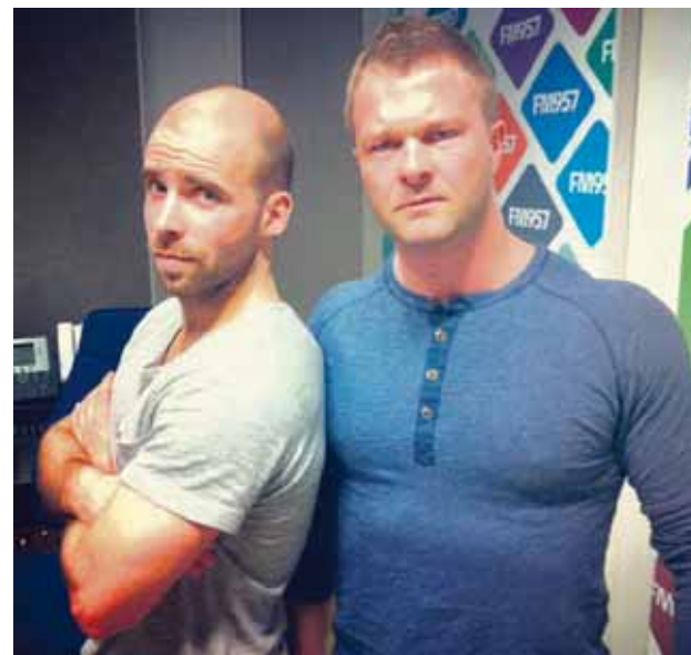
@egillgillz ZweiHard mættir í studiofm957 reiðir og sexy að keyra ykkur inn í páskana!

Ert þú í Instahring Monitor? Bondaðu við okkur með hashtagginu #monitormynd.