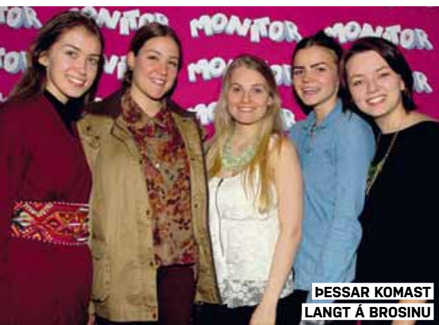
ÞESSAR KOMAST LANGT Á BROSINU