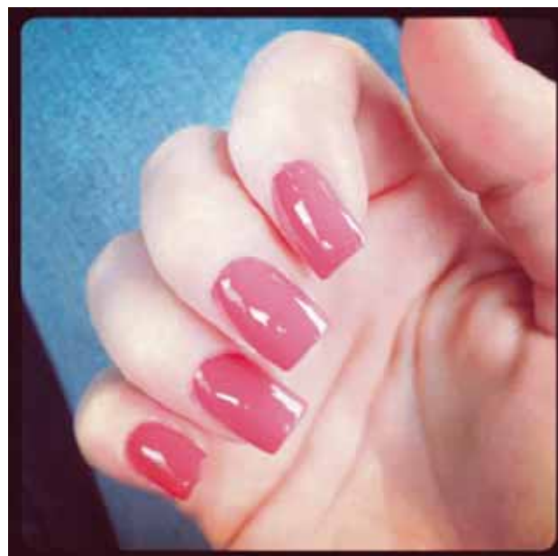
@asdisran New bullet proof spring nailpolish! Can't fail ;)