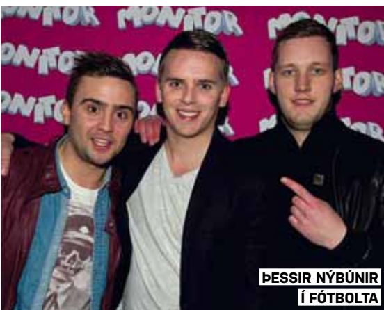
ÞESSIR NÝBÚNIR Í FÓTBOLTA