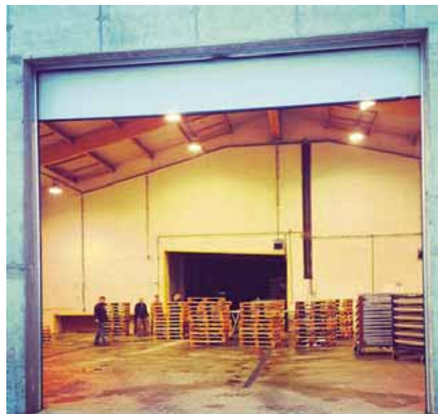
@smalinn Byrjað að setja upp sviðið fyrir Aldrei fór ég suður #aldrei2013 #vestfróir