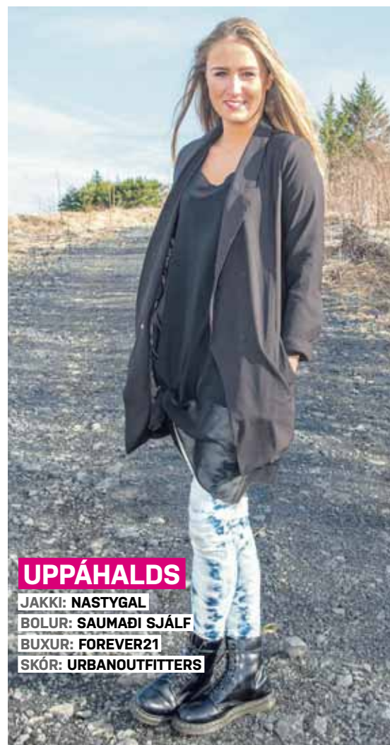
UPPÁHALDS JAKKI: NASTYGAL BOLUR: SAUMAÐI SJÁLF BUXUR: FOREVER21 SKÓR: URBANOUTFITTERS