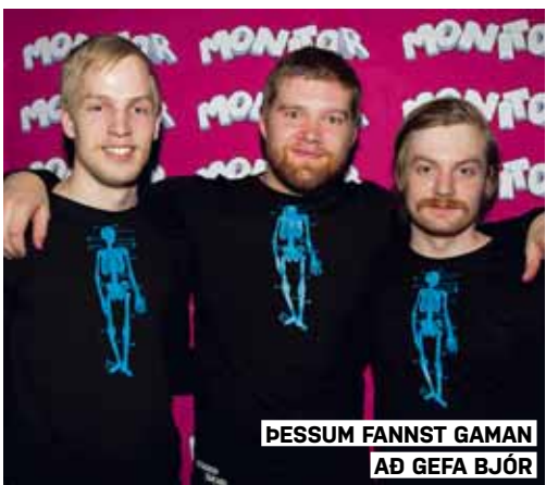
ÞESSUM FANST GAMAN AÐ GEFA BJÓR