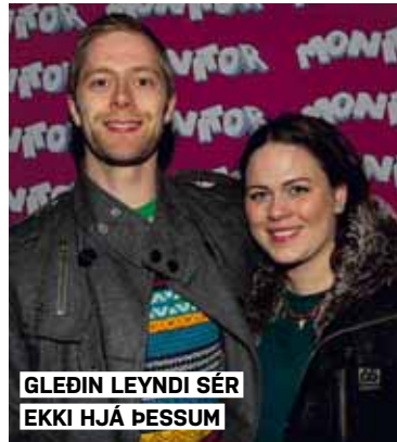
GLEÐIN LEYNDI SÉR EKKI HJÁ ÞESSUM