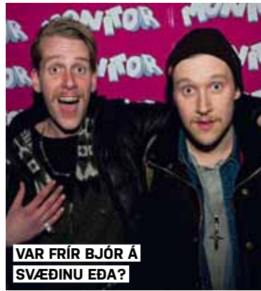
VAR FRÍR BJÓR Á SVÆÐINU EÐA?