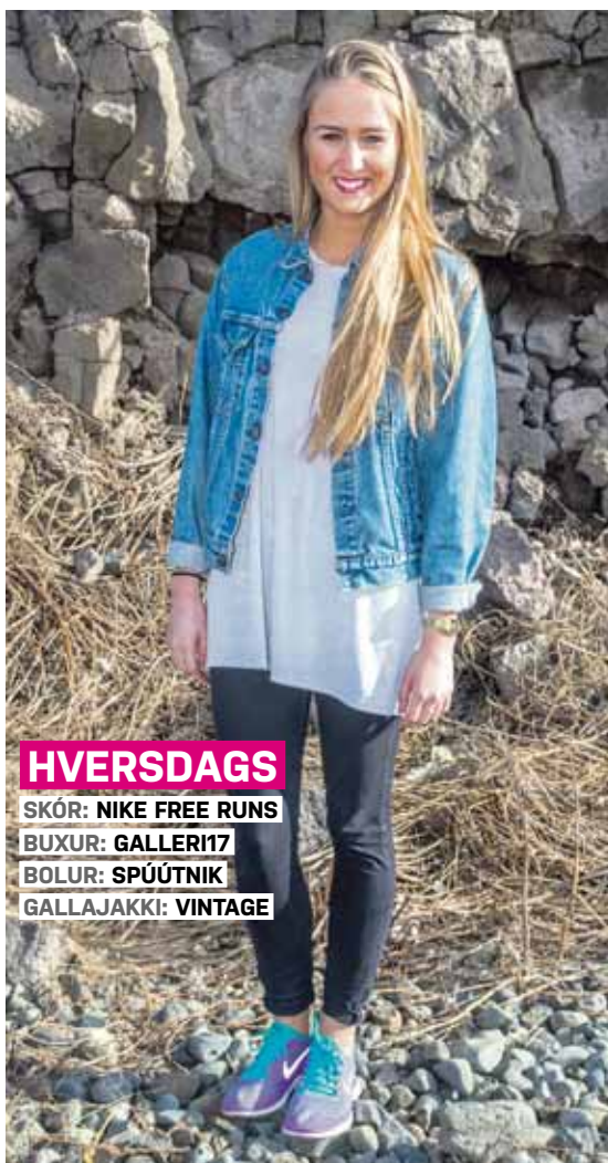
HVERSDAGS SKÓR: NIKE FREE RUNS BUXUR: GALLER17 BOLUR: SPÚÚTNIK GALLAJAKKI: VINTAGE