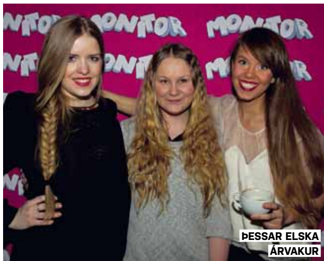
ÞESSAR ELSKA ÁRVAKUR