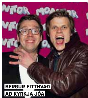
BERGUR EITTHVÄÐ AÐ KYRKJA JÓA