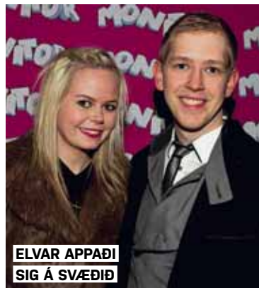
ELVAR APPAÐI SIG Á SVÆÐIÐ