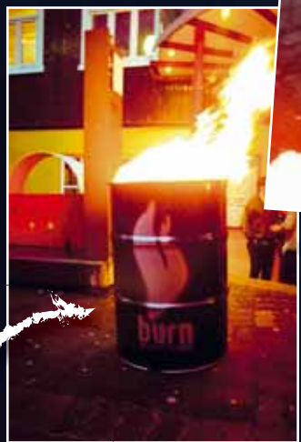
Þar sem tunnurnar eru þar er sko BURN Teiti!