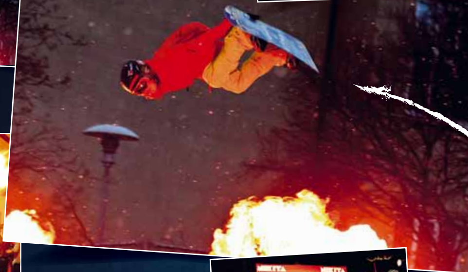
Slakað á i gilinu yfir ljúfum tönum.