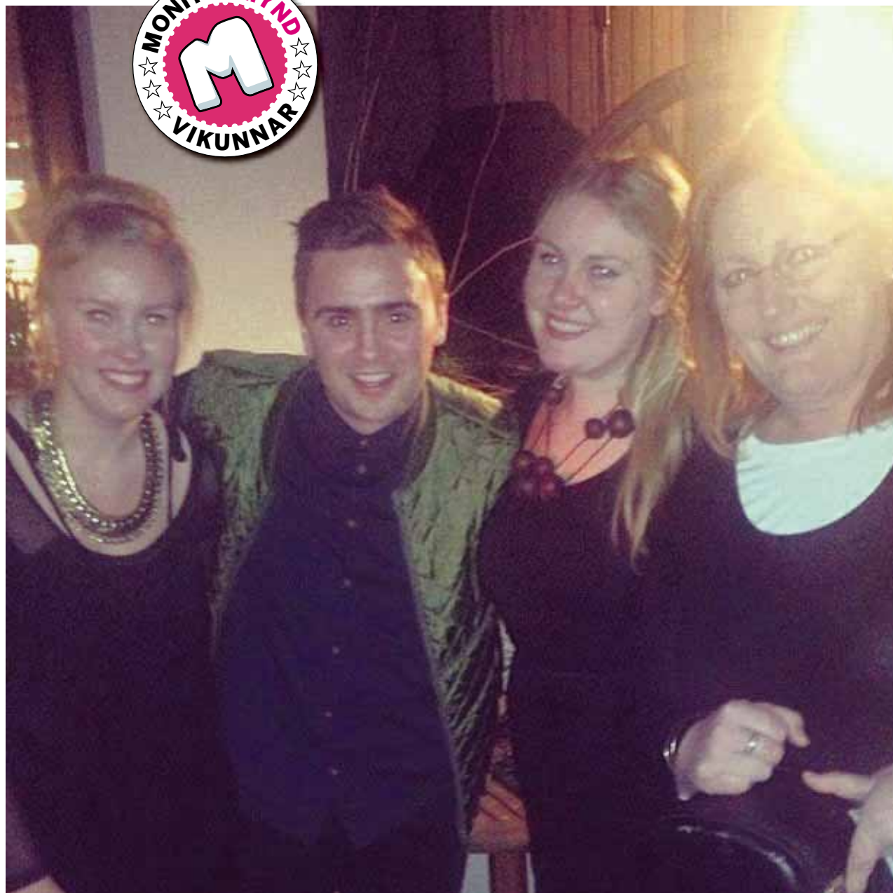
@mokkiliti Skiptum út pabba fyrir Frikka Dór!!! @frillson #ellllskahann #vpm20ára #monitormynd #afmæli