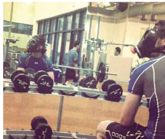
@asgeirorri Heyrðu hér er bara maður með gasgrímu að lyfta við hliðina á mér eins og ekkert sé eðlilegra? #hvaðioskopunum #pinuhræddurialvörunni #slipknötiræktinni