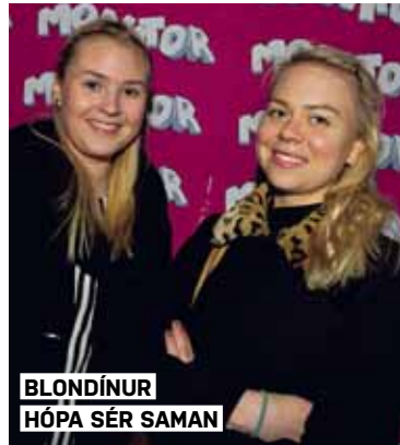
BLÓNDÍNUR HÓPA SÉR SAMAN