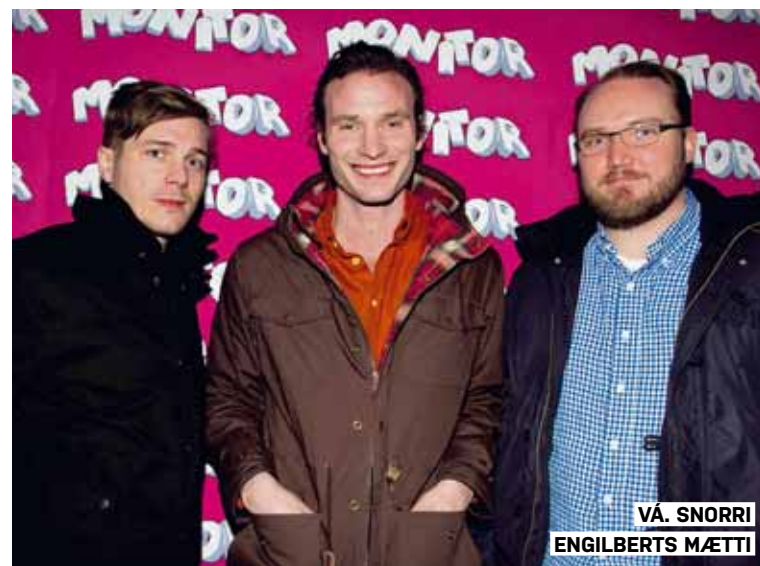
VÁ. SNORRI ENGI LEBERTS MÆTTI