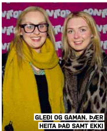
GLEÐI OG GAMAN. ÞÆR HEITA ÞAÐ SAMT EKKI