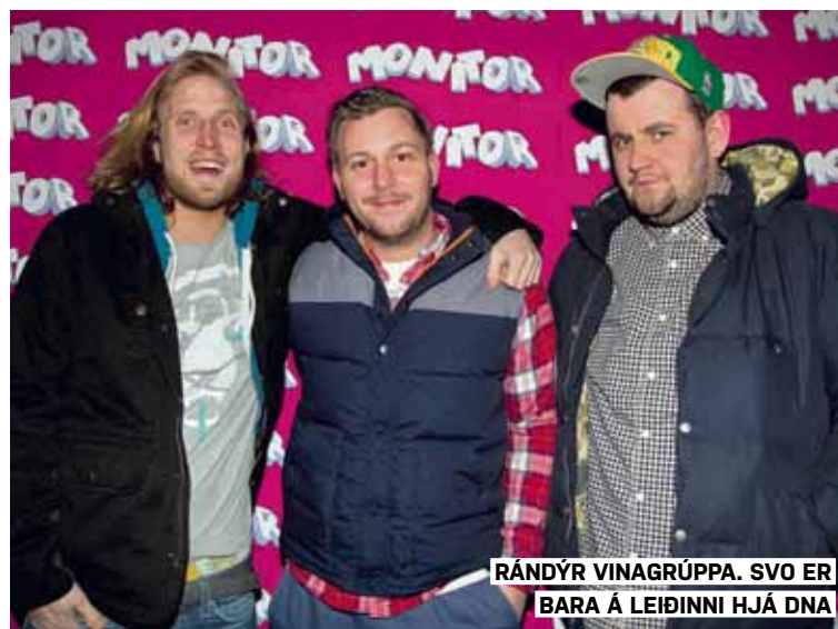
RÁNDÝR VINAGRÚPPA. SVO ER BARA Á LEIÐINI HJÁ DNA