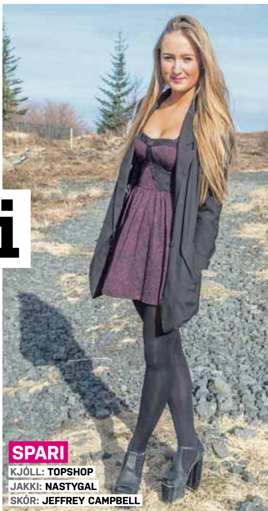
SPARI KJÓLL: TOPSHOP JAKKI: NASTYGAL SKÓR: JEFFREY CAMPBELL

Ef þú yrðir að fá þér húðflúr, hvernig húðflúr myndir þú fá þér og hvar? Úff, ég held að ég myndi setja það á ekki mikið áberandi stað og hafa það eitthvað sem hefur mikla þýðingu fyrir mig.