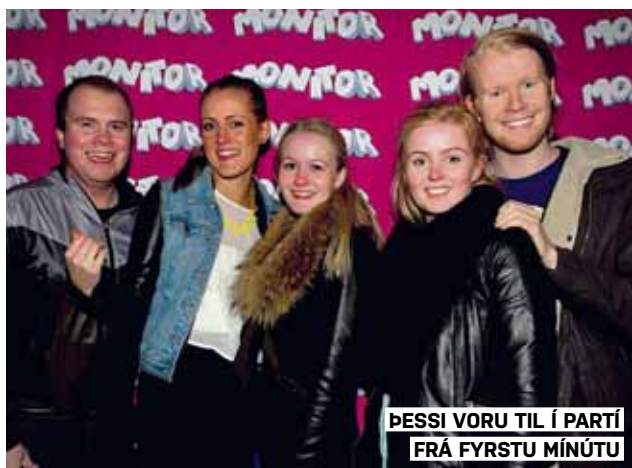
ÞESSI VORU TIL Í PARTÍ FRÁ FYRSTU MÍNÚTU