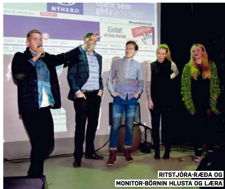
RITSTJÓRA-RÆÐA OG MONITOR-BÖRNIN HLUSTA OG LÆRA