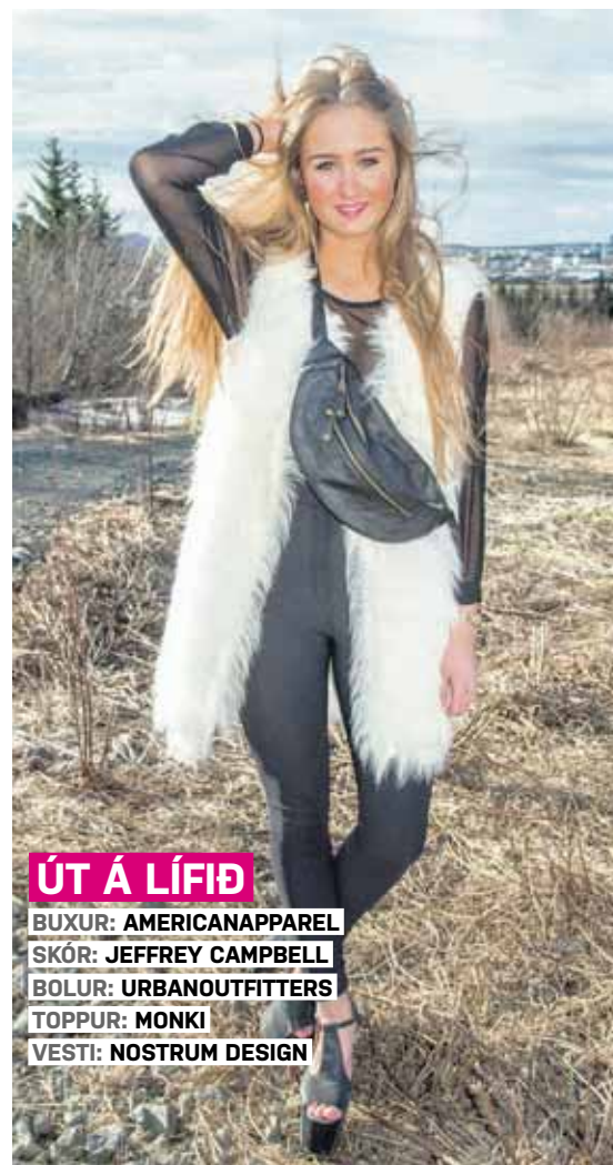
ÚT Á LÍFIÐ BUXUR: AMERICANAPPAREL SKÓR: JEFFREY CAMPBELL BOLUR: URBANOUTFITTERS TOPPUR: MONKI VESTI: NOSTRUM DESIGN