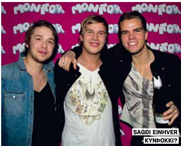
SAGDI EINHVER KYNDOKKI?