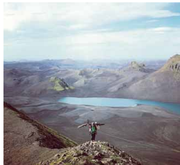
@valahaldorsdottir Dear #Iceland I heard on the Icelandic news that you're preparing for volcanic eruption in Mount #Hekla Can you please delay it until I'm back home in Iceland for easter, thanks. #latergram