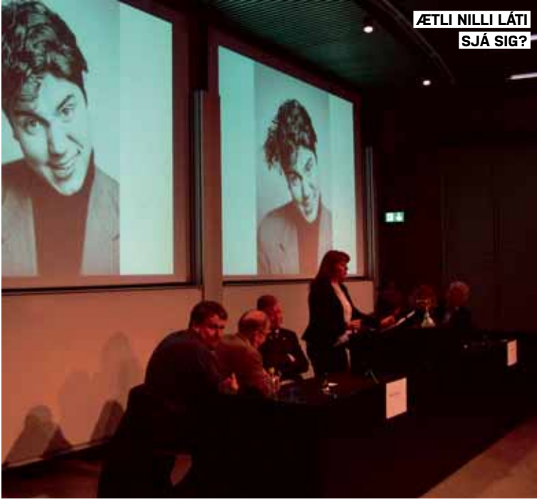
ÆTLI NILLI LÁTI SJÁ SIG?