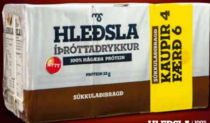
HLEÐSLA 100% HÁGÆÐA PRÓTEIN