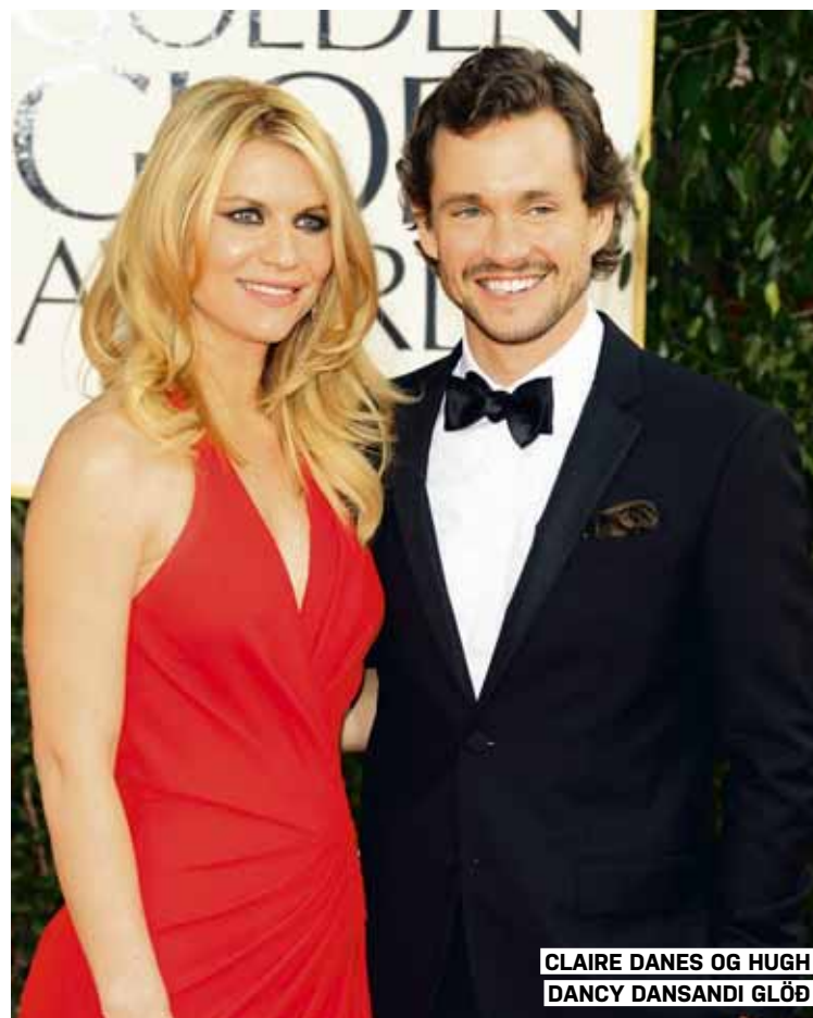
CLAIRE DANES OG HUGH JACKMAN ERU MEÐ DANCY DANSANDI GLÖÐ

Voru þær duglegar að skjóta léttum skotum á fólkið í salnum og sögðu meðal annars að Anne Hathaway hafi verið einmana og yfirgefin í myndinni Les Misérables og að þær hefðu ekki séð annað eins síðan Hathaway deildi sviðinu með James Franco á Óskarsverðlaunahátíðinni 2011. Eins héldu þær því fram að Daniel Day-Lewis hafi leikið ET hér í denn, þær sögðu Quentin Tarantino vera stjórn kynlífsmartraða sinna og enduðu svo kvöldið á viðeigandi máta þegar þær sögðust ætla heim með Jodie Foster, en Foster kom eins og frægt er orðið opinberlega út úr skápnem þetta kvöldið.