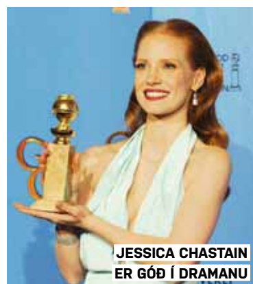
JESSICA CHASTAIN ER GÓÐ Í DRAMANU