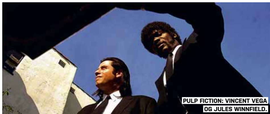
PULP FICTION: VINCENT VEGA OG JULES WINNFELD.