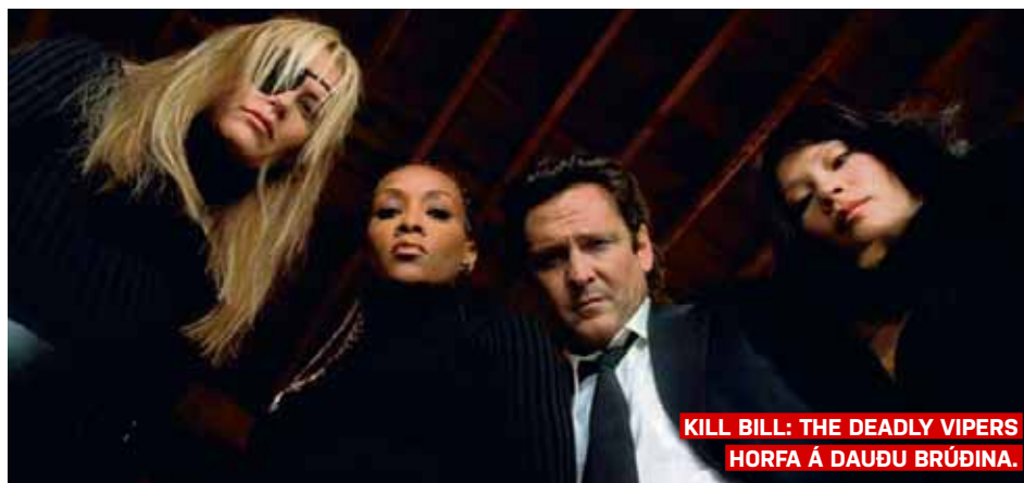
KILL BILL: THE DEADLY VIPERS HORFA Á DAUÐU BRÚÐINA.