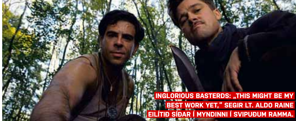
INGLORIOUS BASTERDS: „THIS MIGHT BE MY BEST WORK YET,“ SEGIR LT. ALDO RAINE EILÍTIÐ SÍÐAR Í MYNDINI Í SVIPUDUM RAMMA.