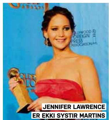
JENNIFER LAWRENCE ER EKKI SYSTIR MARTINS