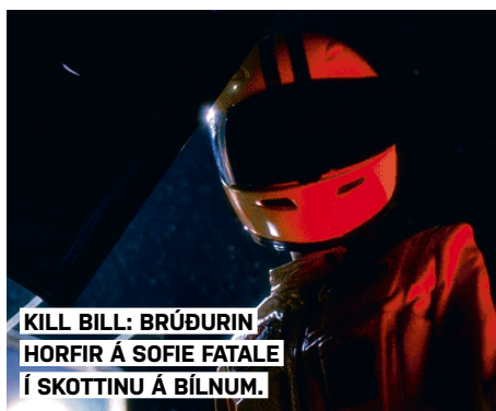
KILL BILL: BRÚÐURIN HORFIR Á SOFIE FATALE Í SKOTTINU Á BÍLNUM.

Skott-skotið er sjónarhorn í kvikmynd þar sem myndavélinni er beint þannig að áhorfandi fái það á tilfinninguna að hann sé að horfa á persónur myndarinnar úr skotti á bíl. Þó svo að skapa megi þetta sjónarhorn með því einfaldlega að setja myndavélina í skottið á bíl gæti það reynst erfitt þar sem umfang hefðbundinna myndavéla sem notaðar eru í stórmyndum er mikið og eins þarf myndatökumaðurinn pláss til að athafna sig. Því er oft brugðið á það ráð að „svindla“ með því að plata leikmundaðildina til að koma hurðinni og grindinni á skottinu svo nálægt myndavélinni að ramminn virðist vera tekinn úr skotti bíls.