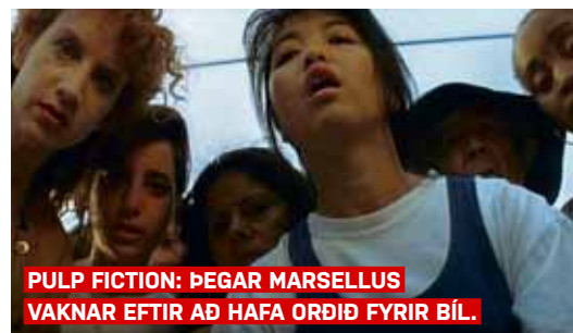
PULP FICTION: ÞEGAR MARSELLUS VAKNAR EFTIR AÐ HAFA ORÐIÐ FYRIR BÍL.

Þó svo að skott á bíl komi fyrir í ansi mörgum Tarantino-myndum þá notast hann samt sem áður oft við „skott-skotin“ án þess að skott komi endilega við sögu. Hér eru nokkrar myndir þar sem myndavélinni er beint upp; það verður til þess að áhorfandanum finnst hann liggja á jörðinni, horfa upp og sjá persónur myndarinnar yfir sér. Þá er áhorfandinn yfirleitt í hlutverki einhvers sem er dáinn eða er við dauðans dyr.