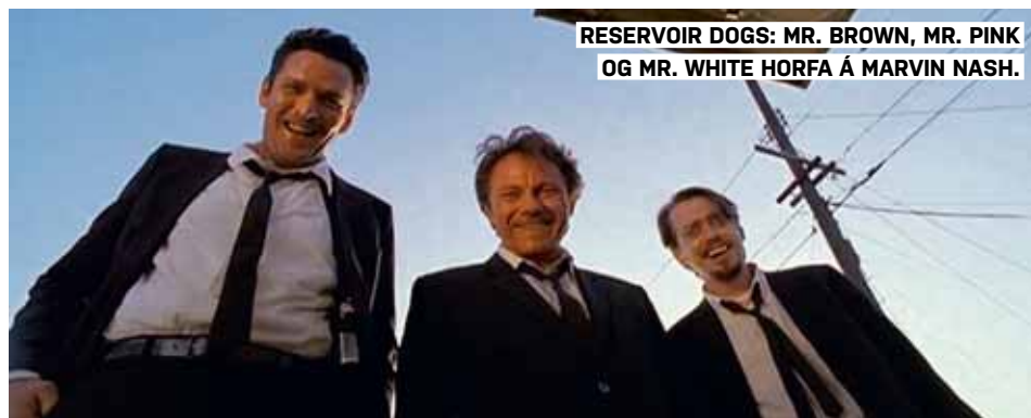
RESERVOIR DOGS: MR. BROWN, MR. PINK OG MR. WHITE HORFA Á MARVIN NASH.