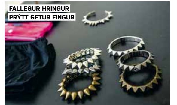
FALLEGUR HRINGUR PRÝTT GETUR FINGUR

Hvaða fylgihlutir verða áberandi í haust? Statement-hálsmen verða ennþá áberandi og armbönd eru að koma sterk inn. Grófleikinn í skarti er aðeins að minnka, skartið er að fara meira í fingerðari átt en hefur verið undanfarið.