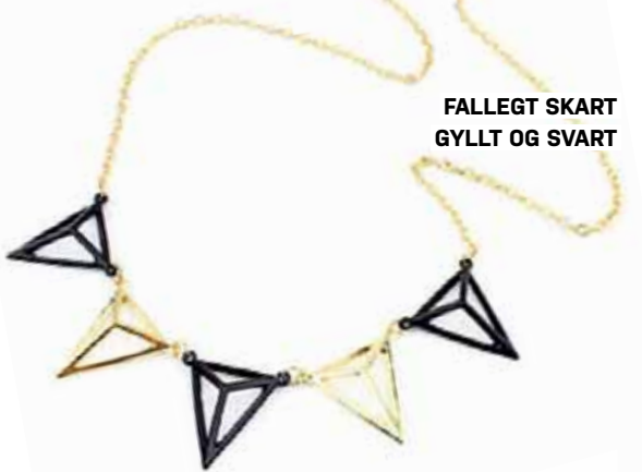
FALLEGT SKART GYLLT OG SVART