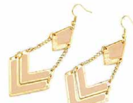
SJÁ EYRNALOKKA SEM ÝKJA ÞOKKA