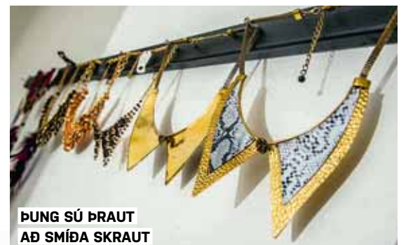
ÞUNG SÚ ÞRAUT AÐ SMÍÐA SKRAUT