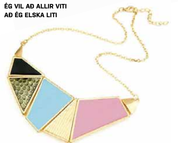
ÉG VIL AÐ ALLIR VITI AÐ ÉG ELSKA LITI