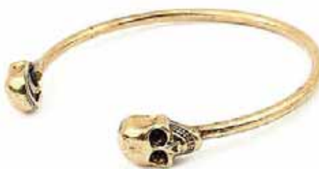
HAUSKÚPAN SYNGUR ÉG ER GLINGUR