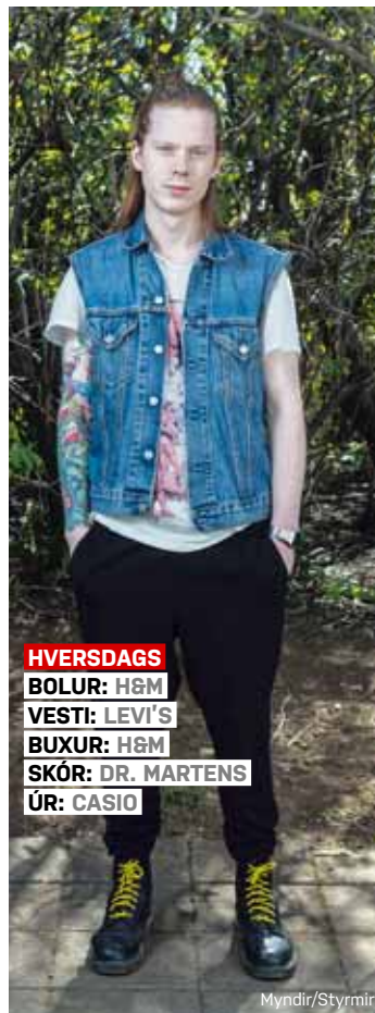
HVERSDAGS BOLUR: H&M VESTI: LEVI'S BUXUR: H&M SKÓR: DR. MARTENS ÚR: CASIO