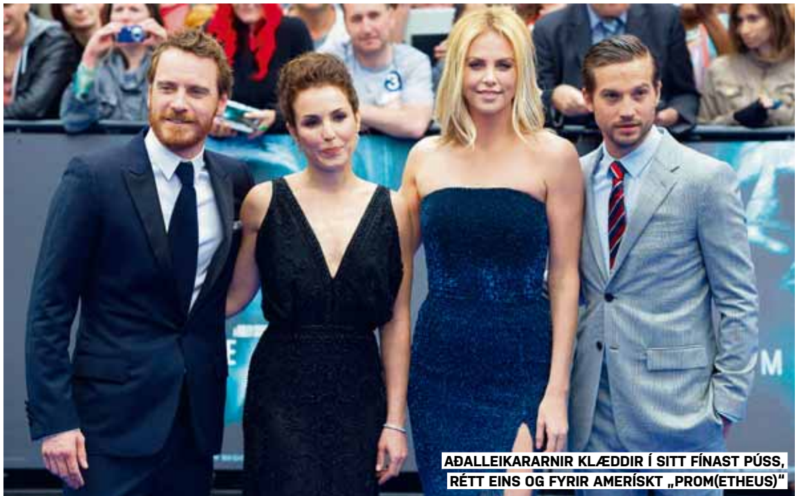
ADALLEIKARARNIR KLÆDDIR Í SITT FÍNAST PÚSS, RÉTT EINS OG FYRIR AMERISKT „PROM(ETHEUS)“