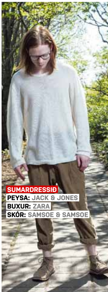
SUMARDRESSIÐ PEYSA: JACK & JONES BUXUR: ZARA SKÓR: SAMSOE & SAMSOE

Hvað ætlar þú að gera í sumar? Ég ætla að vinna mikið og ferðast innan lands með góðra vina hópi inn á milli.