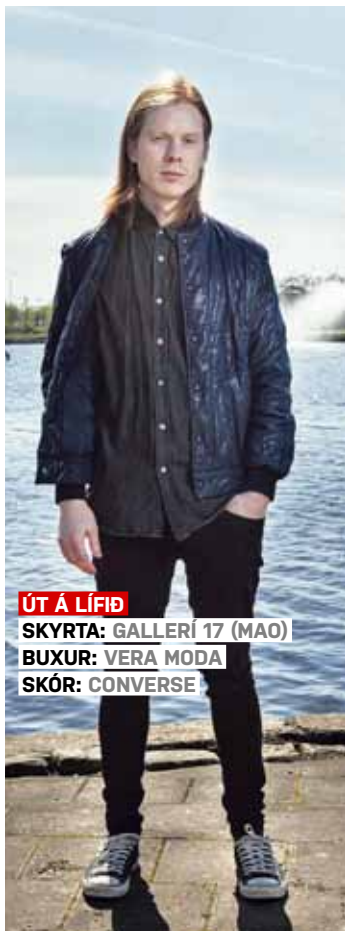
ÚT Á LÍFIÐ SKYRТА: GALLERÍ 17 (MAO) BUXUR: VERA MODA SKÓR: CONVERSE