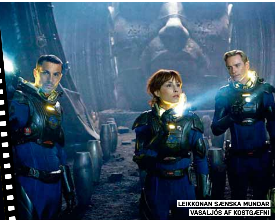
LEIKKONAN SÆNSKA MUNDAR VASALJÓÐ AF KOSTGÆFNI