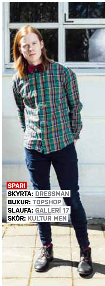
SPARI SKYRТА: DRESSMAN BUXUR: TOPSHOP SLAUFA: GALLERÍ 17 SKÓR: KULTUR MEN