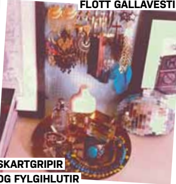
SKARTGRIPIR OG FYLGIHLUTIR