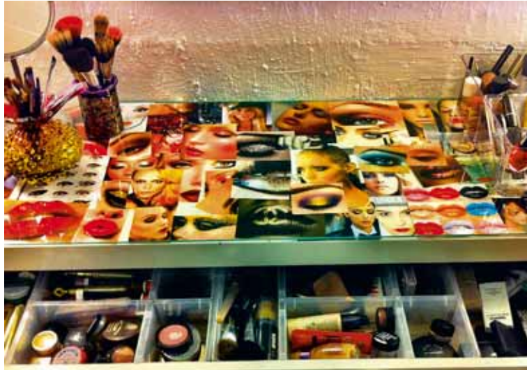
ALLAR HAFNA ÞÆR MIKINN ÁHUGA Á FÖRDUN OG SKRIFA ÞÆR TÍTT UM HANA Á SÍÐUNNI