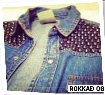
ROKKAD OG FLOTT GALLAVESTI

Fjölbreyttum, skemmtilegum og sumarlegum bloggum. Eitthvað nýtt á hverjum degi!