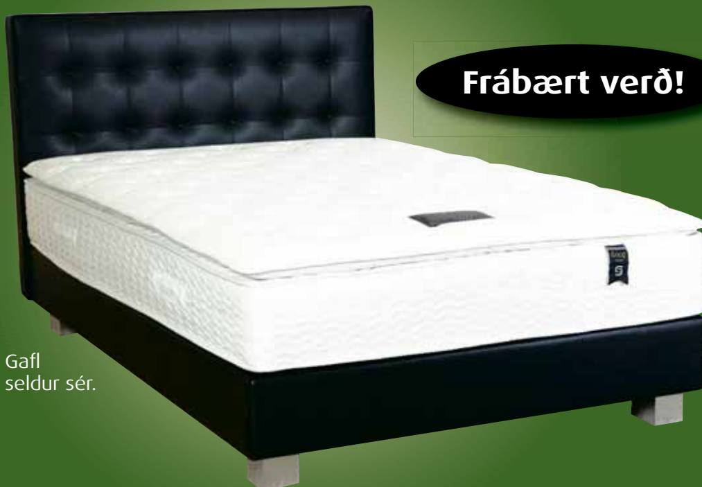
Gaff seldur sér.