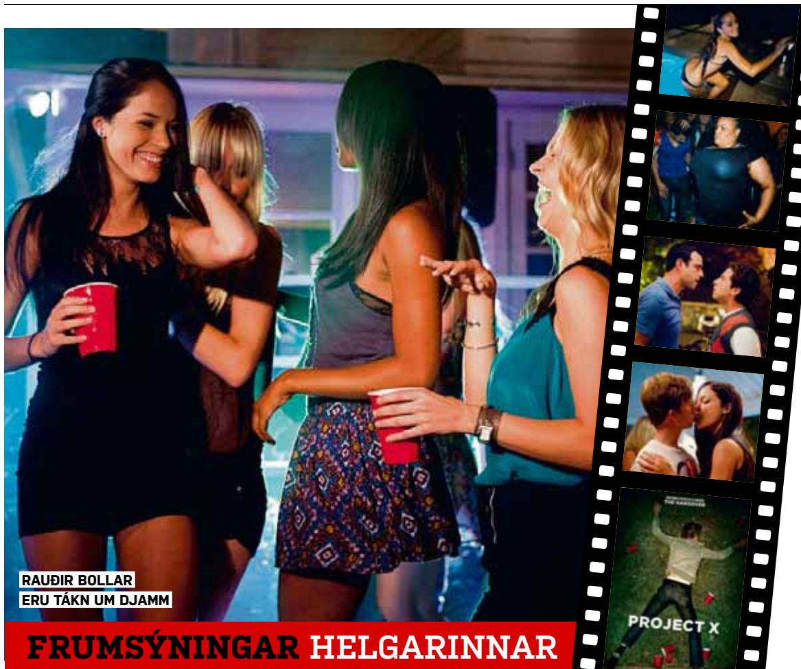
RAUÐIR BOLLAR ERU TÁKN UM DJAMM