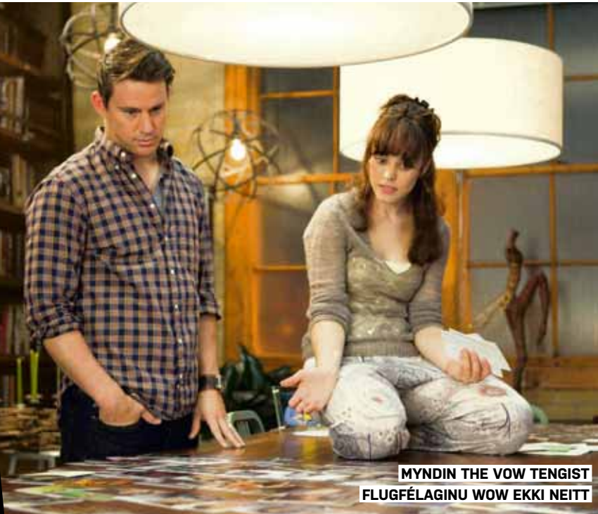
MYNDIN THE VOW TENGIST FLUGFÉLAGINU WOW EKKI NEITT