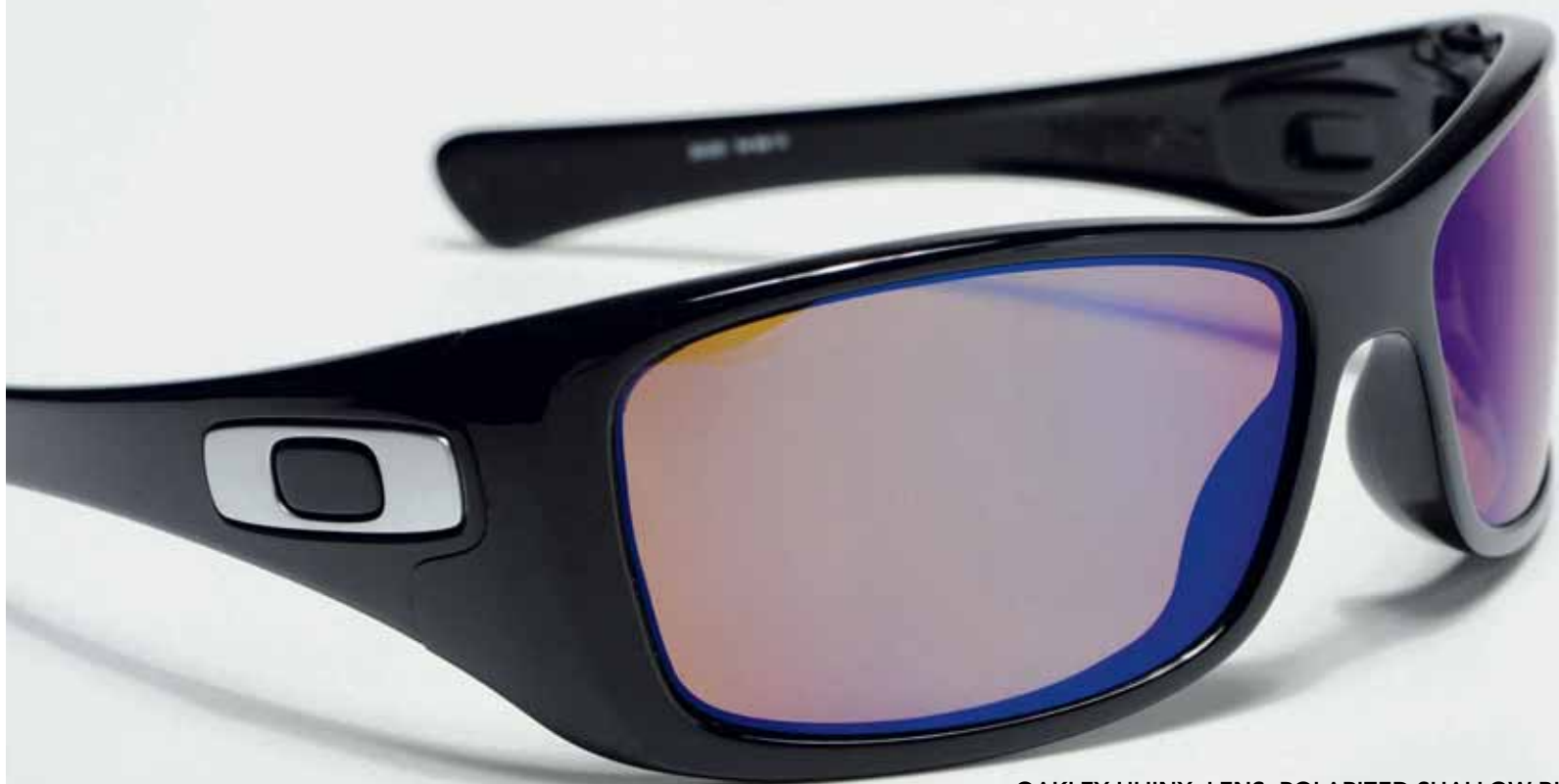
OAKLEY HIJINX, LENS: POLARIZED SHALLOW BLUE.