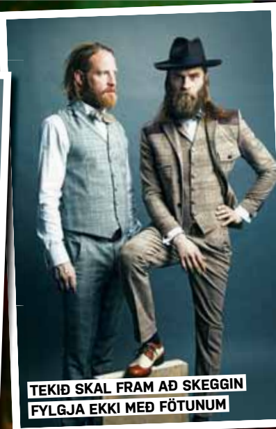
TEKIÐ SKÁL FRAM AÐ SKEGGIN FYLGJA EKKI MEÐ FÖTUNUM