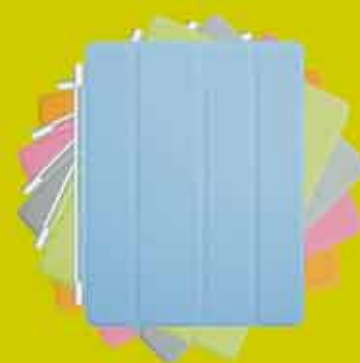
Smart Cover iPad 2 hlíf / margir litir Verð frá: 7.990.-