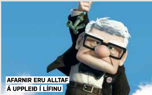
AFARNIR ERU ALLTAF Á UPPLIÐ Í LÍFINU

Þ ar yrðu kenndar allar kúnstirnar og öll þau fræði sem ég hef þegar nefnt auk afalegs orðaforða. Afar þurfa að geta notað formlegt málfar auk þess að nota einhver myndin orð yfir