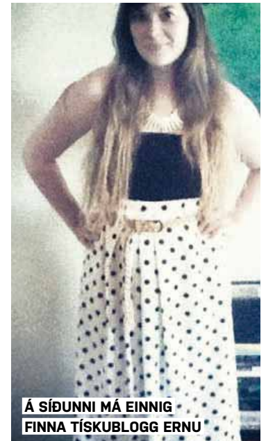
Á SÍÐUNNI MÁ EINNIG FINNA TÍSKUBLOGG ERNU