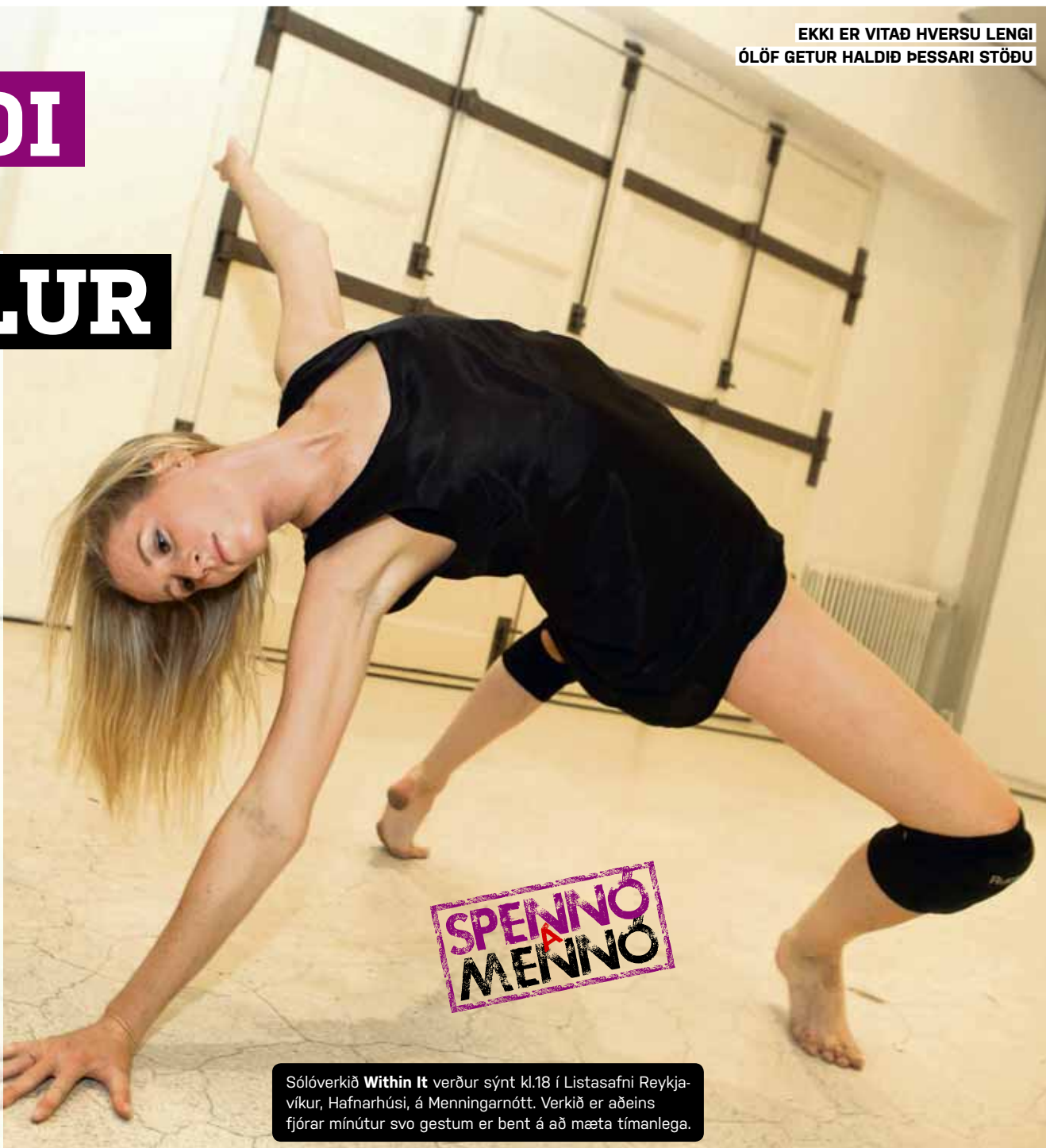
Sólóverkið Within It verður sýnt kl.18 í Listasafni Reykjavíkur, Hafnarhúsi, á Menningarnótt. Verkið er aðeins fjórar mínútur svo gestum er bent á að mæta tímanlega.

ARI VAR Á HETTUPEYSU-FUNDI ÞEGAR MYNDIN VAR TEKIN