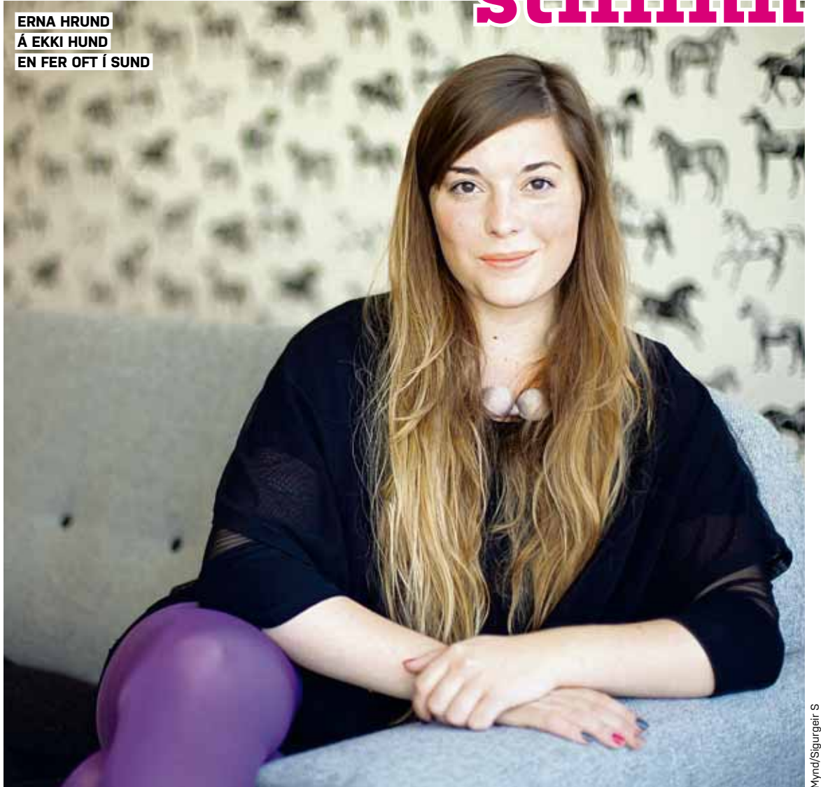
ERNA HRUND Á EKKI HUND EN FER OFT Í SUND