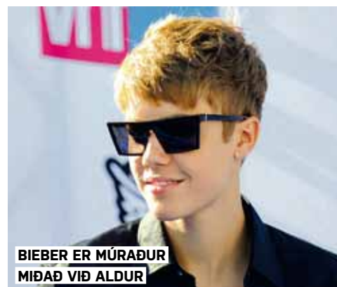
BIEBER ER MÚRAÐUR MIÐAÐ VIÐ ALDUR

Ragnar Axelsson (RAX) ljósmyndari hefur undanfarinn aldarfjórðung myndað menn og náttúru á norðurslóðum. Fyrir honum vakir að festa fólkið og lífshætti þess á filmu áður en það verður of seint. Til þess verður hann að ávinna sér traust þeirra, verða einn af þeim, læra að komast af í aðstæðum sem eiga fátt skylt með þægindum nútímans. Aðeins þannig ávinnur hann sér rétt til að komast að þessu fólki, heyrja sögur þess og fá að mynda það í umhverfi sínu.