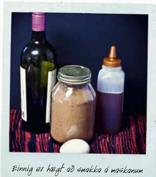
Einnig er hægt að smakka á maskanum