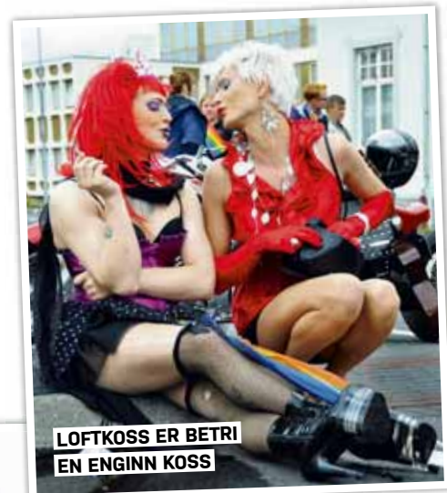
LOFTKOSS ER BETRI EN ENGINN KOSS

Já, algjörlega. Maður tekur sér bara frí þegar maður sest að á dvalarheimili aldraðra tónlistarmanna.