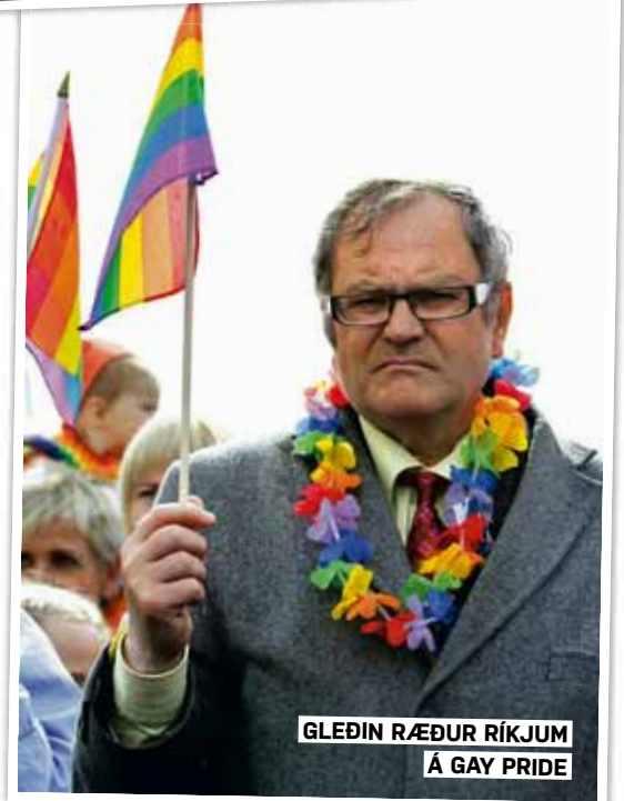
GLEÐIN RÆÐUR RÍKJUM Á GAY PRIDE