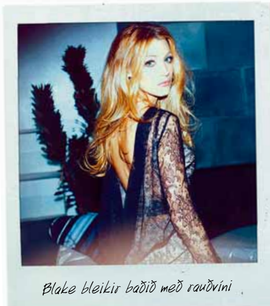
Blake bleikir baðið með rauðvíni