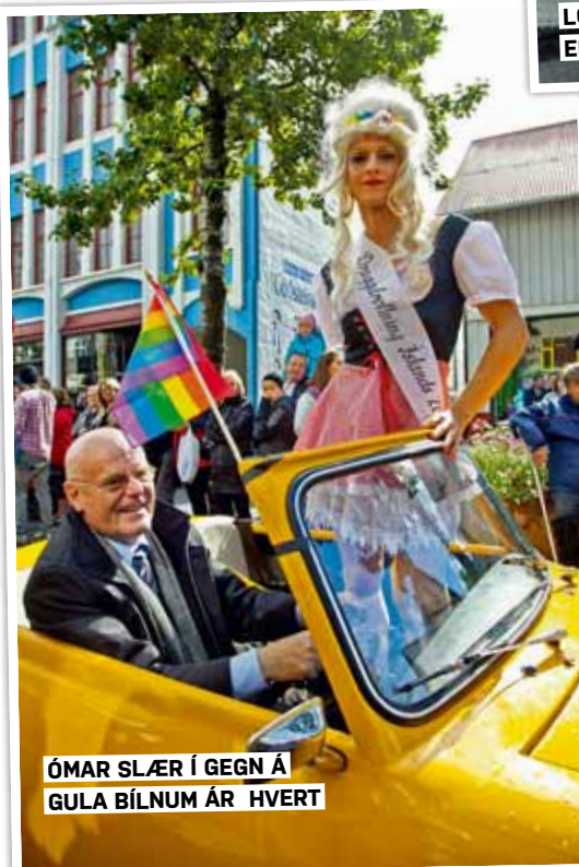
ÓMAR SLÆR Í GEGN Á GULA BÍLNUM ÁR HVERT