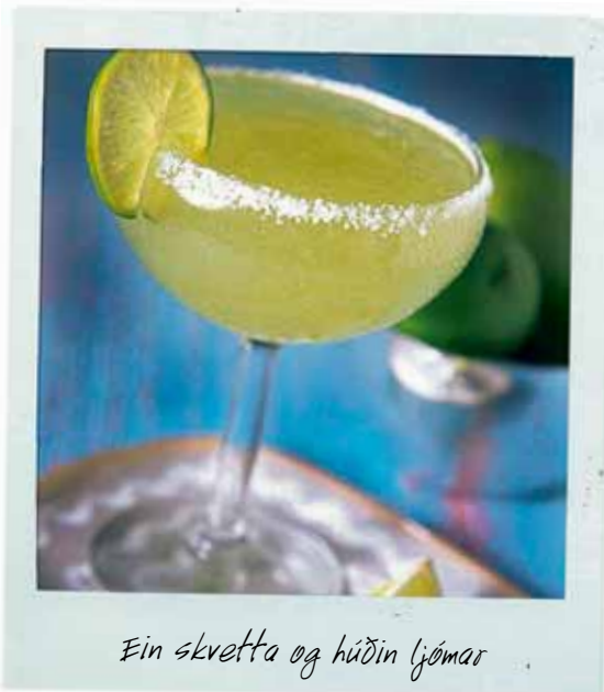
Ein skvetta og húðin ljómar

Blandið saman rauðvíni, hunangi og eggjahvítu. Bætið síðan út í kakói og blandið þar til blandan verður mjúk og hlaupkennd. Hreinlegast er að bera maskann á með bursta. Facial Brush #213 í Make Up Store er æðislegur bursti til að nota. Burstinn notast til að bera á krem, maska og farða. Maskinn tekur um 15-20 mínútur að þorna. Gott er að bleyta þvottapoka upp úr volgu vatni og strjúka af húðinni.