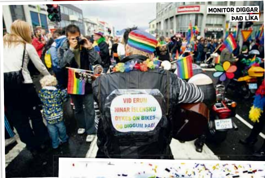
MONITOR DIGGAR ÞAÐ LÍKA