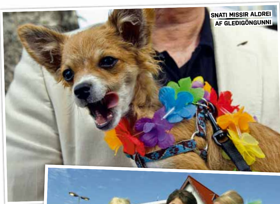
SNATI MISSIR ALDREI AF GLEÐIGÖNGUNNI