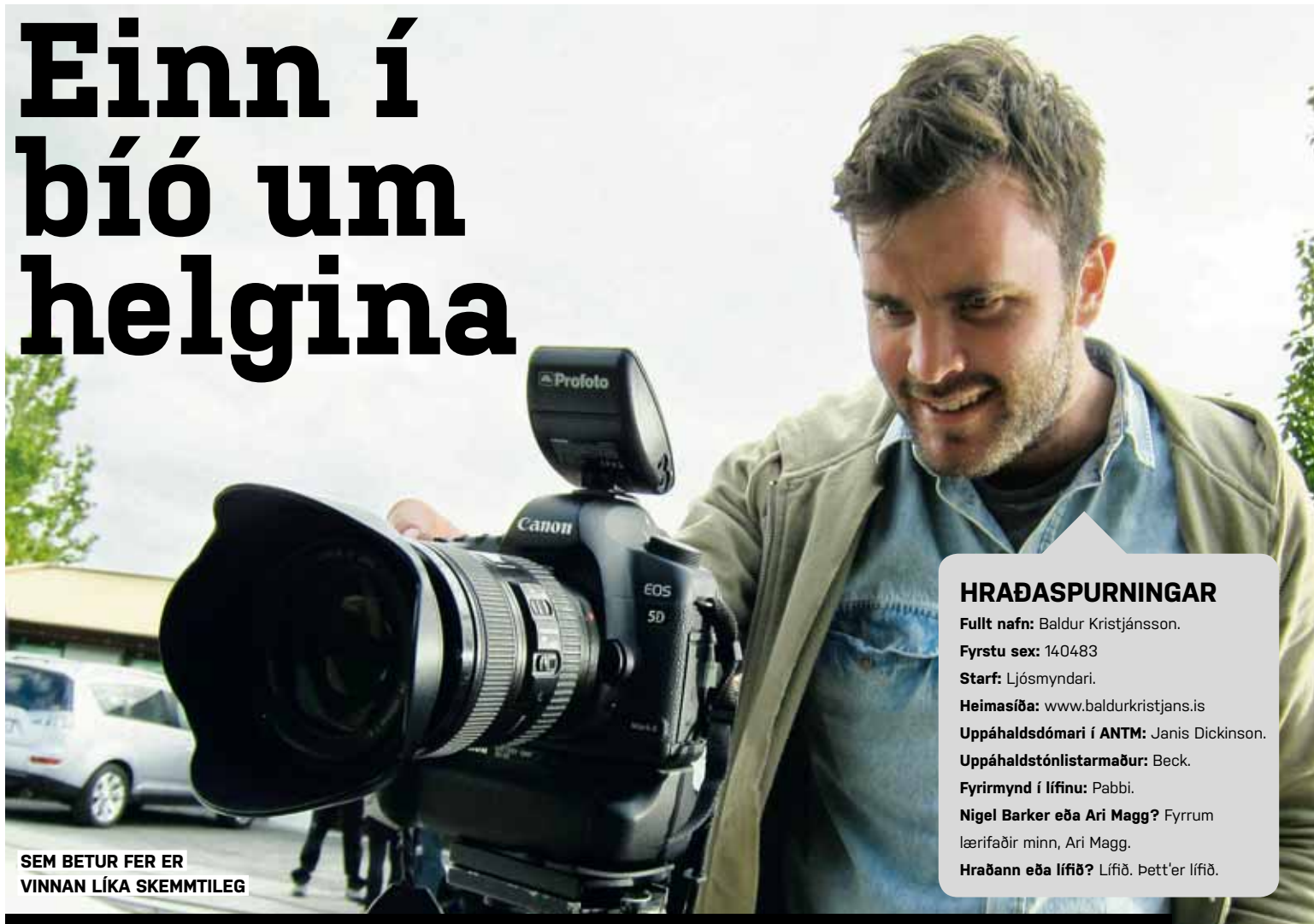
SEM BETUR FER ER VINNAN LÍKA SKEMMTILEG