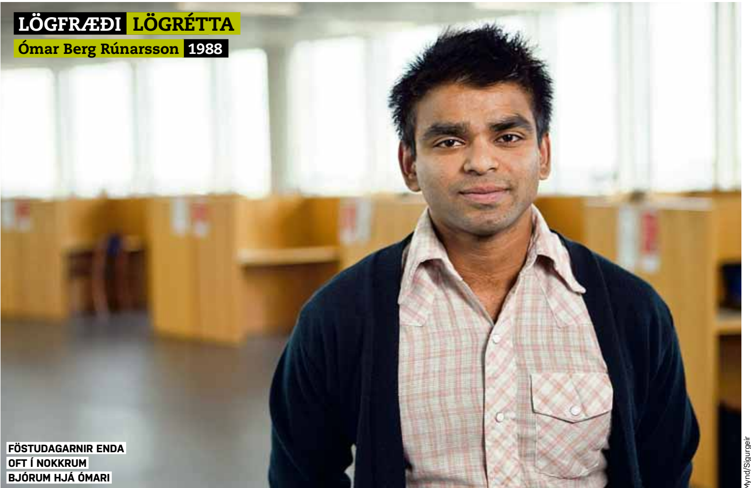
FÖSTUDAGARNIR ENDA OFT Í NOKKRUM BJÓRUM HJÁ ÓMARI