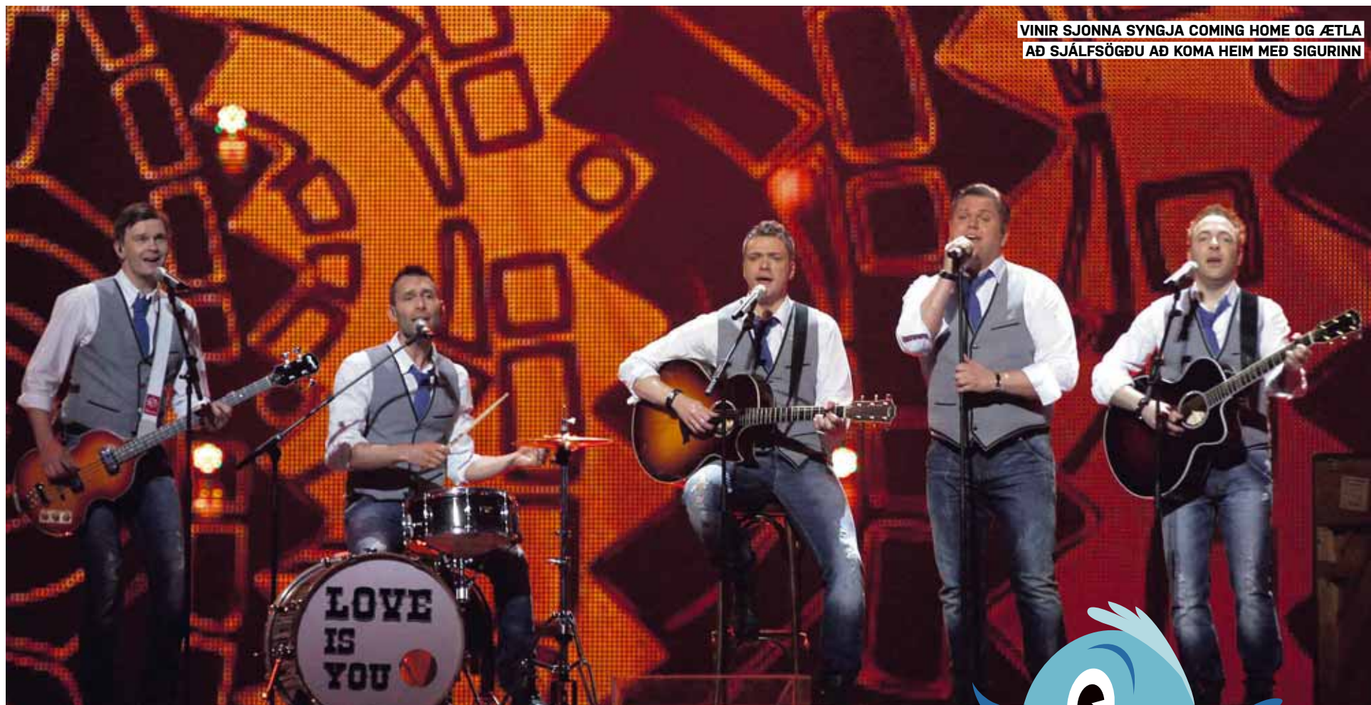
VINIR SJONNA SYNGJA COMING HOME OG ÆTLA AÐ SJÁLFSÖGÐU AÐ KOMA HEIM MED SIGURINN