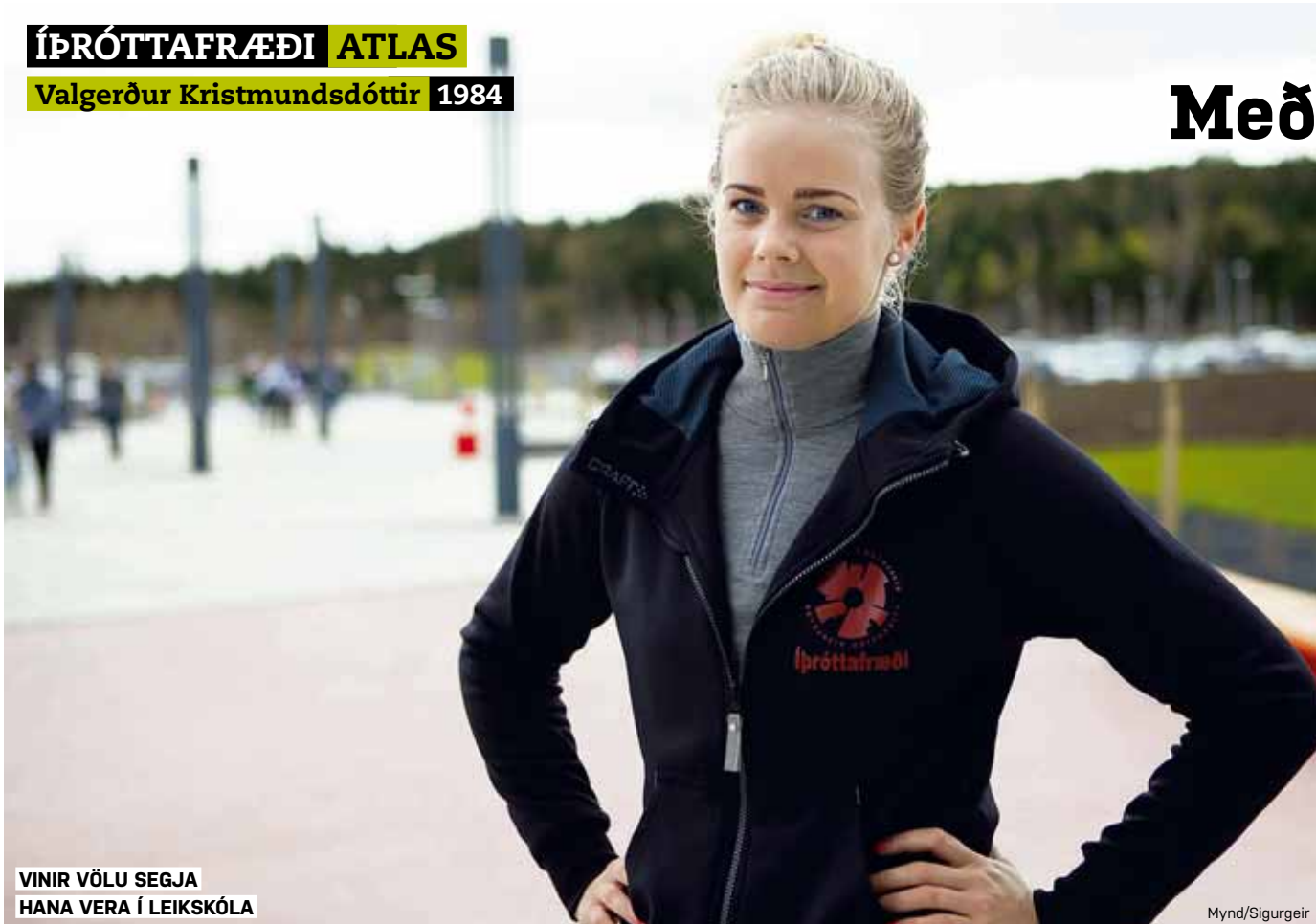
VINIR VÖLU SEGJA HANA VERA Í LEIKSKÓLA