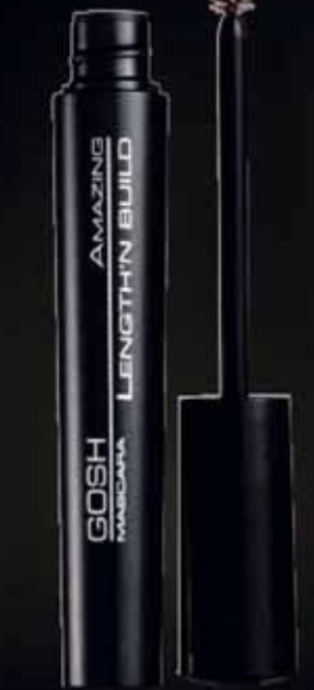
Maskari sem lengir og þykkir.