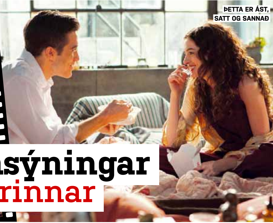
ÞETTA ER ÁST, SATT OG SANNAÐ