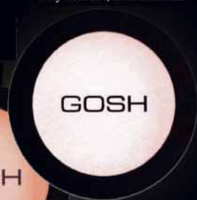
Silky Rose 004, krem kinnalitur.