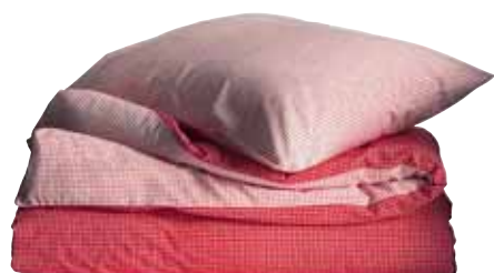
IKEA 365+ RISP sængurverasett 3.690,- B150xL200/B50xL60cm Ýmsir litir