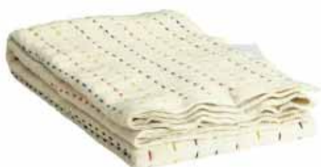
IKEA PS STICKA rúmteppi 6.990,- B150xL250cm. Ólitað/marglitað

MALM kömmóða m/3 skúffum B80xD48, H78cm. Hvítuð eik