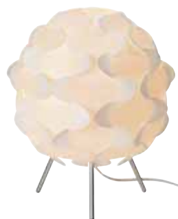
FILLSTA borðlampi 3.790,- H31cm. Hvítt