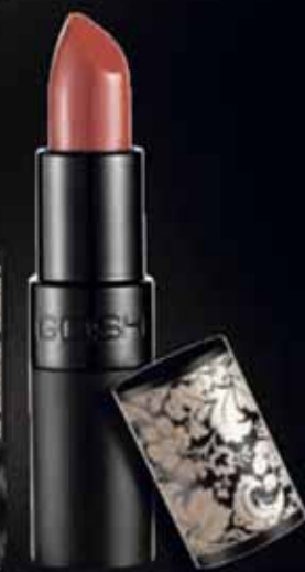
122 Nougat Velvet