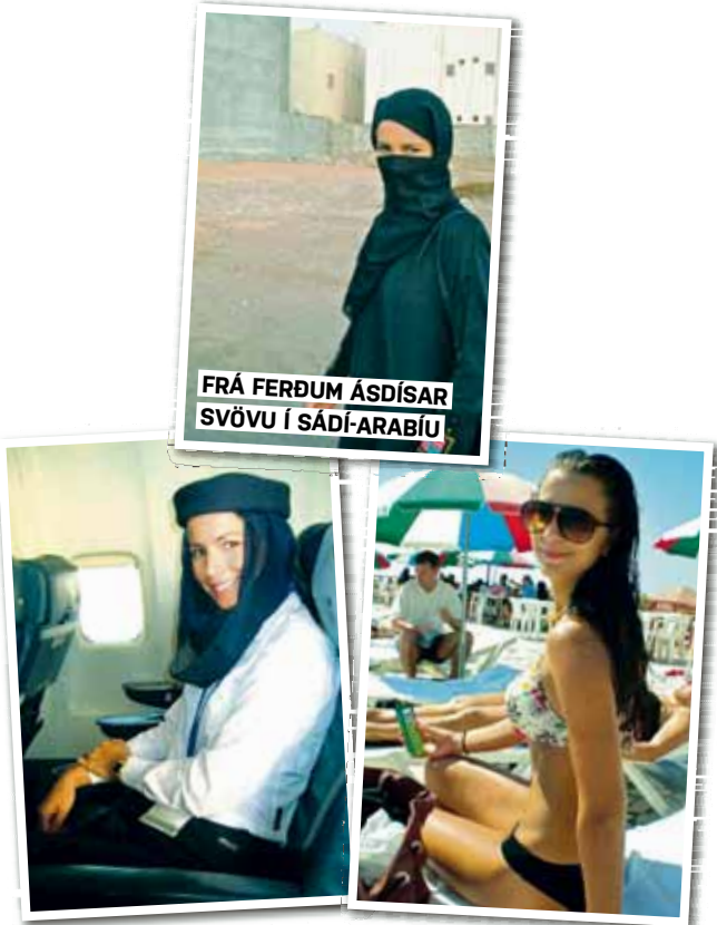
FRÁ FERÐUM ÁSDÍSAR SVÖVU Í SÁDÍ-ARABÍU

Monitor er komið með ógeð af snjónum og kuldanum og ætlar á ströndina.