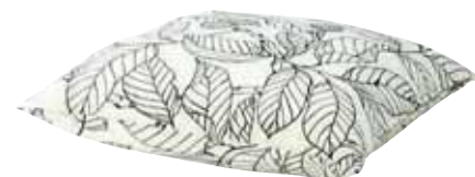
IKEA STOCKHOLM BLAD púði 2.390,- B55xL55cm. Hvítt/svart