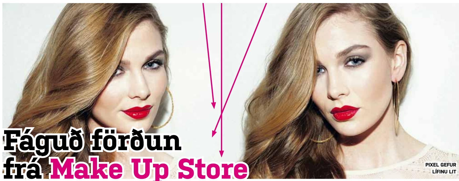
PIXEL GEFUR LÍFINU LIT