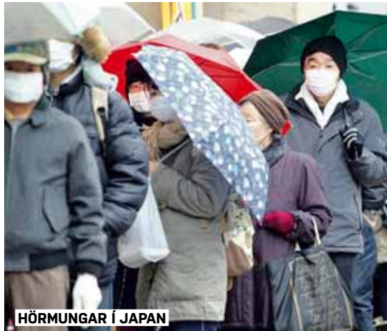
HÖRMUNGAR Í JAPAN

Japanir fylgja ekki eftir fordæmi fórnarlamba slíkra hamfara og nýta sér aðstæðurnar til ills. Enn hefur ekkert borið á stuldi úr matvöruhúðum eða ránum heldur stendur fólkíð saman samkvæmt upplýsingum sem hafa borist frá Japan. Fréttamaðurinn Ed West lýsti aðstæðum í Japan í The Telegraph í gær. Hann hrífst af samstöðunni sem ríkir á hamfarasvæðunum og dáist til dæmis að matvöruhúðum sem hafa lækkað verð sitt tímabundið.