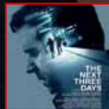
SJÁÐU HANA Í... The Next Three Days.