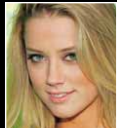
AMBER HEARD Fædd: 22. apríl 1986 Í ár munum við sjá hana í stórmýndunum Drive Angry og The Rum Diary.