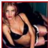
SJÁÐU HANA Í... undirfataauglýsingum Victoria's Secret.