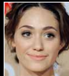
EMMY ROSSUM Fædd: 12. desember 1988 Söng- og leikkona sem allir virðast elska. Lékk til dæmis í Poseidon og Dragonball: Evolution.