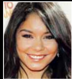
VANESSA HUDGENS Fædd: 14. desember 1988 High School Musical-stjarnan er í stórum hlutverkum í þremur myndum á árinu.