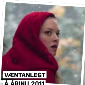
VÆNTANLEGT Á ÁRINU 2011

2011 Monitor kortleggur hvaða ungu leikkonur munu slá í gegn í Hollywood á árinu.