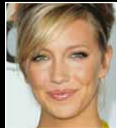
KATIE CASSIDY Fædd: 25. nóvember 1987 Hefur leikið í Gossip Girl og Melrose Place en í ár sjáum við hana í myndinni Monte Carlo.