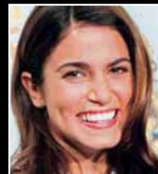
NIKKI REED Fædd: 17. maí 1988 Leikur í nýjustu Twilight, eins og þeim fyrri, og á móti Bruce Willis í Catch .44.