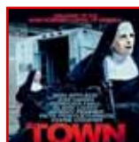
SJÁÐU HANA Í... The Town

Það hefur mikið vatn runnið til sjávar síðan Blake Lively lék í The Sisterhood of the Traveling Pants árið 2005. Blake er auðvitað löngu orðin fræg fyrir að leika Serenu í Gossip Girl en menn tala um að árið 2011 verði árið þar sem hún sannar sig fyrir alvöru á hvíta tjalðinu. Hún átti fína frammistöðu í myndinni The Town sem kom í fyrra og í ár munum við sjá hana í ofurhetjumyndinni Green Lantern, sem skartar Ryan Reynolds í aðalhlutverki.