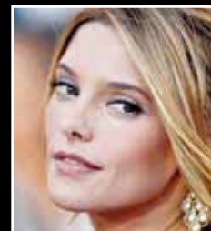
ASHLEY GREENE Fædd: 21. febrúar 1987 Alice Cullen úr Twilight leikur í nýju Twilight og tveimur öðrum myndum.