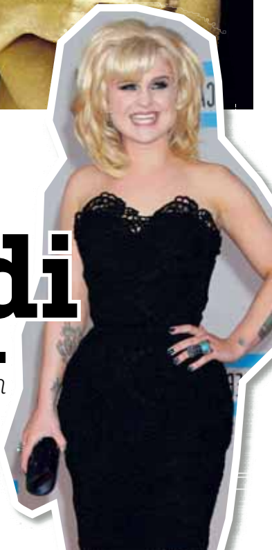
KELLY OSBOURNE GETUR SÉR GOTT ORÐ Í TÍSKUHEIMINUM

Leyniuppskriftin hennar að þessum mögnuðu framförum er að hún hætti alveg að borða snakk og drekka gos. Einnig breytti hún líka alveg um mataræði og borðar nú bara hollan og góðan mat. Til að mynda ræktar hún sitt eigið grænmeti í bakgarðinum heima hjá sér. Það er því augljóst að þetta er ekkert flókið, þú ert það sem þú étur!