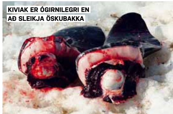
KIVIAK ER ÓGIRNILEGRI EN AÐ SLEIKJA ÖSKUBAKKA

Íslendingar eru kannski ekki í stöðu til að gera grín að öðrum þegar kemur að óvenjulegum matar- og jólah hefðum. Monitor gróf þó upp nokkrar erlendar sem gætu fengið þig til að gapa.