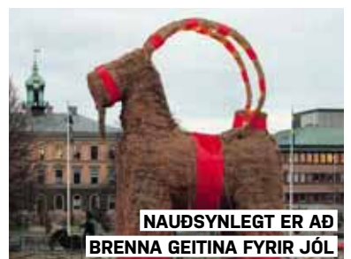
NAUÐSYNLEGT ER AÐ BRENNNA GETTINA FYRIR JÓL

Grikkir trú á því að illir andar, kallaðir Kallikantzaroi, búi neðanjarðar en kíki upp á yfirborðið á hátíð ljóss og friðar. Til að bægja þeim frá er kjálkabein úr víni hengt á arinhilluna og það svínvirkar!