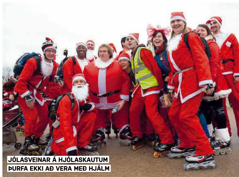
JÓLASVEINAR Á HJÓLASKAUTUM ÞURFA EKKI AÐ VERA MEÐ HJÁL