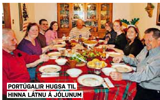
PORTÚGÁLIR HUGSA TIL HINNA LÁTNU Á JÓLUNUM

Kiviak er grænlandskt góðgæti sem framleitt er með vægast sagt vafasömum aðferðum. Svartfugl í heilu lagi er vafinn inn í selspik og feld og grafinn mánuðum saman. Svo er höfuðið skorið af og úldin innnyflin kreist út úr fuglinum, sem svo er étinn.