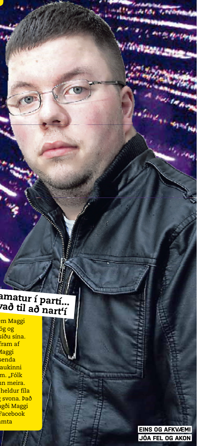
Pinnamatur í parti... eitthvað til að nartí