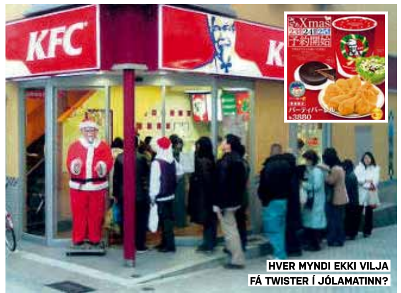
HVER MYNDI EKKI VILJA FÁ TWISTER Í JÓLAMATINN?

Markaðssetning KFC í Japan hefur skilað miklum árangri og nú er svo komið að afar vinsælt er að snæða KFC kjúkling á jólinum. Margir panta kjúklinginn sinn fyrirfram en margar fjölskyldur kjósa einnig að borða jólamáltíðina bara á staðnum.