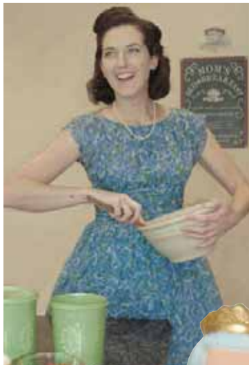
HÚSMÆDRUM ER HOLLAST AÐ HRÆRA RÉTT