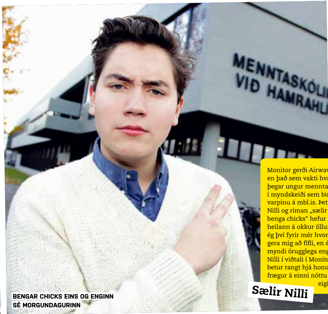
BENGAR CHICKS EINS OG ENGINN SÉ MORGUNDAGURINN