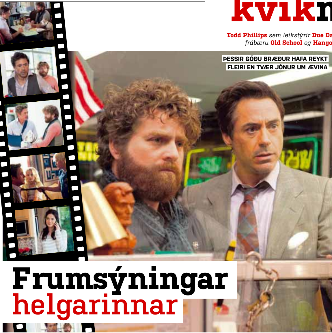
ÞESSIR GÓÐU BRÆÐUR HAFNA REYKT FLEIRI EN TVÆR JÓNUR UM ÆVINA

2010 Reykir maríjúana-sígarettu í sjónvarpsþættinum Real Time þar sem verið var að ræða um lögleiðingu kannabiseftna.