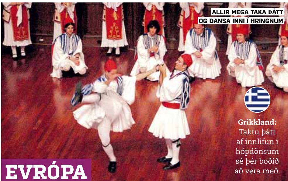
ALLIR MEGA TAKA ÞÁTT OG DANSÁ INNI Í HRINGNUM