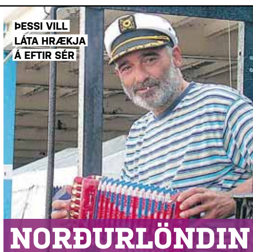
ÞESSI VILL LÁTA HRÆKJA Á EFTIR SÉR

Svíþjóð: Bíddu með að fara í yfirhöfnina þar til þú ert kominn út úr húsi gestgjafans.