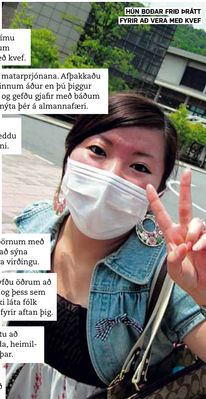
HÚN BOÐAR FRÍÐ ÞRÁTT FYRIR AÐ VERA MEÐ KVEF