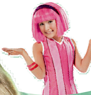
Latabær & © 2010 Latabær ehf. Öll réttindi raskilin.

Frítt fyrir alla krakka í Íþróttaskóla Latabæjar 7. nóv. kl. 13.00 í Vetrargarðinum.