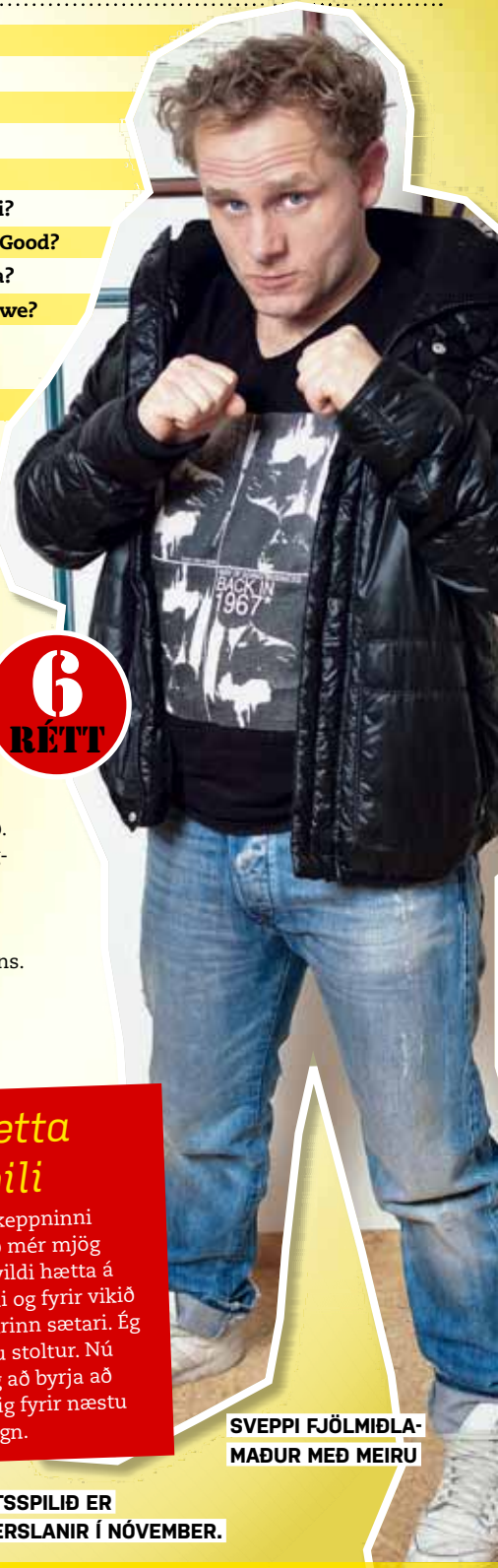
SVEPPI FJÖLMIÐLAMADUR MEÐ MEIRU