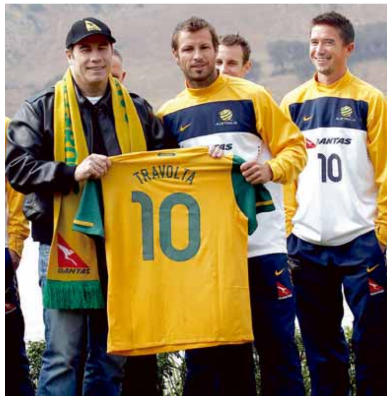
Andfætlingar með aðdáanda Ástralska liðið er greinilega ekki búið að sjá kvikmyndina Battlefield Earth. Annars hefði John Travolta ekki fengið treyju.