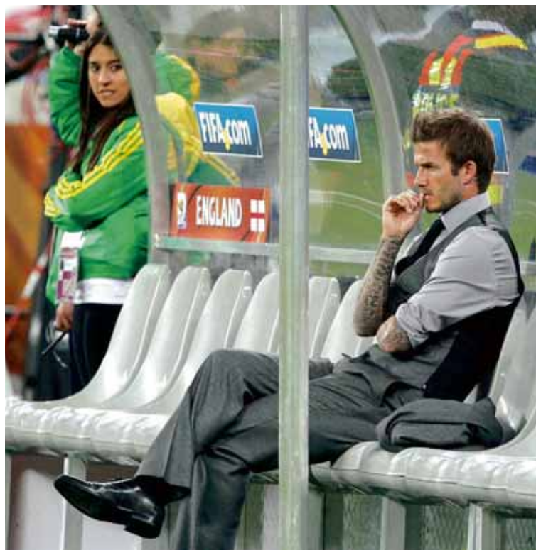
Ást við fyrstu sýn Það ætti að vera óhætt að leggja eigið líf undir á að skvísuna í græna jakkanum hafi dreymt blautan draum um David Beckham.