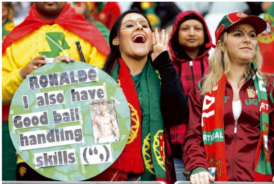
Portúgölsk dónastelpa Eins og flestir knattspyrnumenn á Heimsmeistaramótiinu í Afríku átti þessi stúlka í stökustu vandræðum með Jabulani-knöttinn. Boltaleikni hennar var hins vegar fólgin í öðrum og persónulegri boltum.