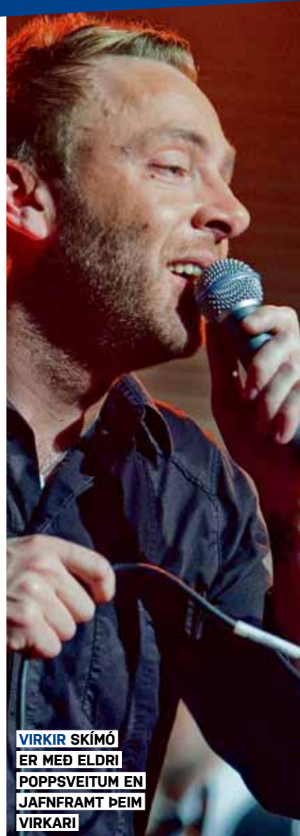
VIRKIR SKÍMÓ ER MEÐ ELDRÍ POPPSVEITUM EN JAFNFRAMT ÞEIM VIRKARI