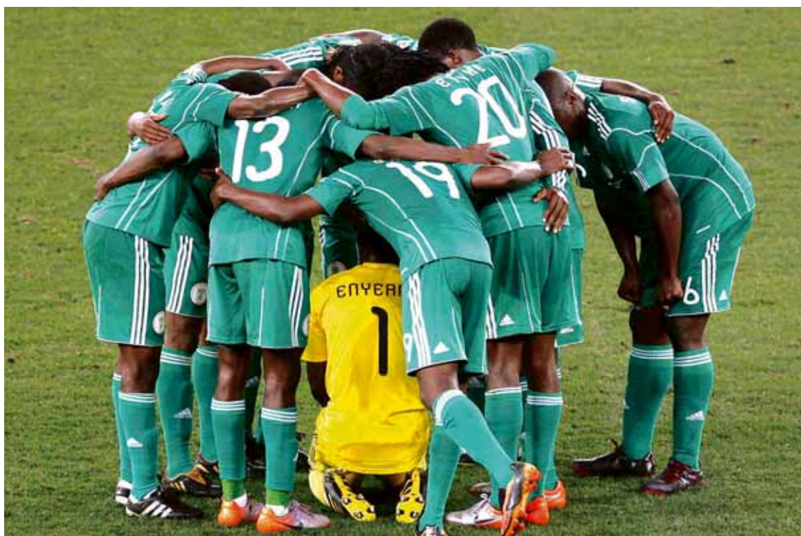
Röng forgangsröðun Nígeríumenn gera heidarlega tilraun til að fela markvörð sinn, Vincent Enyeama. Hann fannst þó fljótlega enda mikið af myndavélum á leikvanginum. Nígeríumenn voru í kjölfarið beðnir um að fela sig í eigin frítíma.