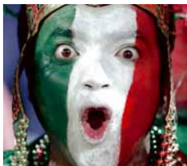
Mexíkóskur stuðningsmaður Þetta er náttúrulegur húðlitur hans.