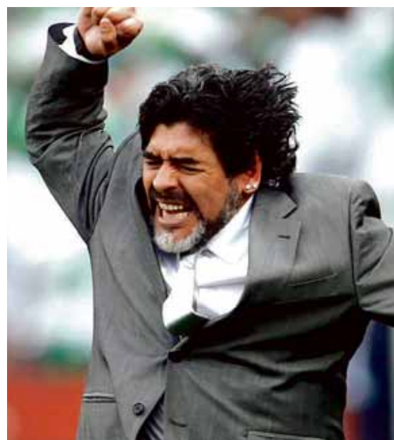
Maradona Ef Antonio Banderas væri lítill, feitur og sturlaður myndi hann líta einhvern veginn svona út.