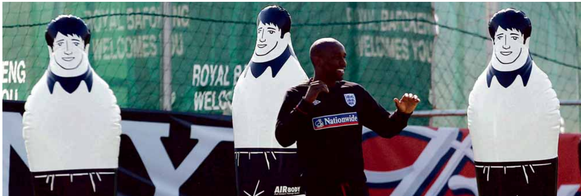
Glatt á hjalla Enski landsliðsmaðurinn Jermain Defoe grínast í félögum sínum. Þeir neituðu hins vegar að hlæja að bröndurum hans og sármaði Defoe mikið. Hann er hætturettur að tala við þá í dag.