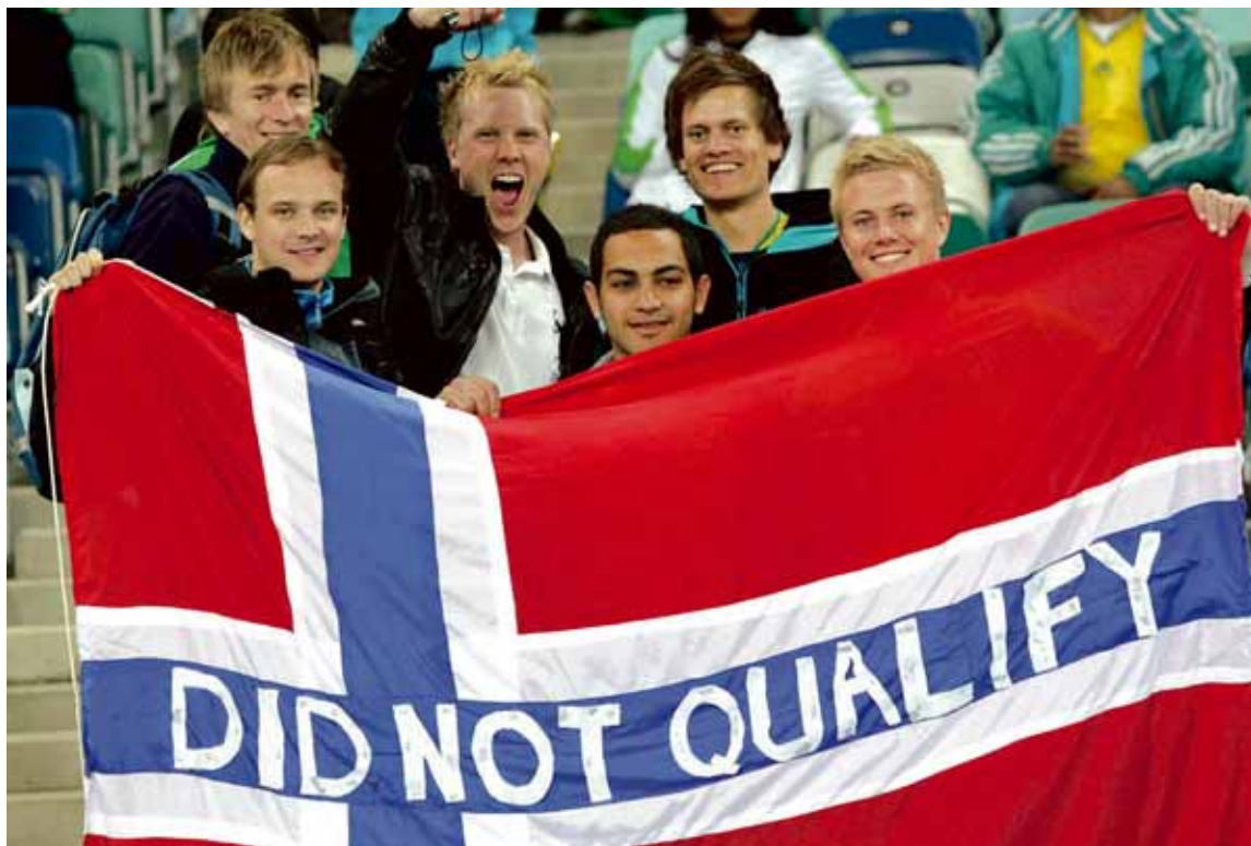
Frændur vorir Norðmenn hafa greinilega ágætis húmor fyrir sjálfum sér og láta það ekki stöðva sig í að mæta til Suður-Afríku þótt þeirra landslið sé ekki á meðal þáttökubjóða. Mættu engir Íslendingar með íslenska fánann?