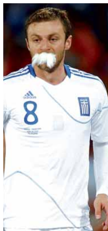
Allir elska KFC Grikkjum finnst þó best að borða kjúklinginn lifandi.