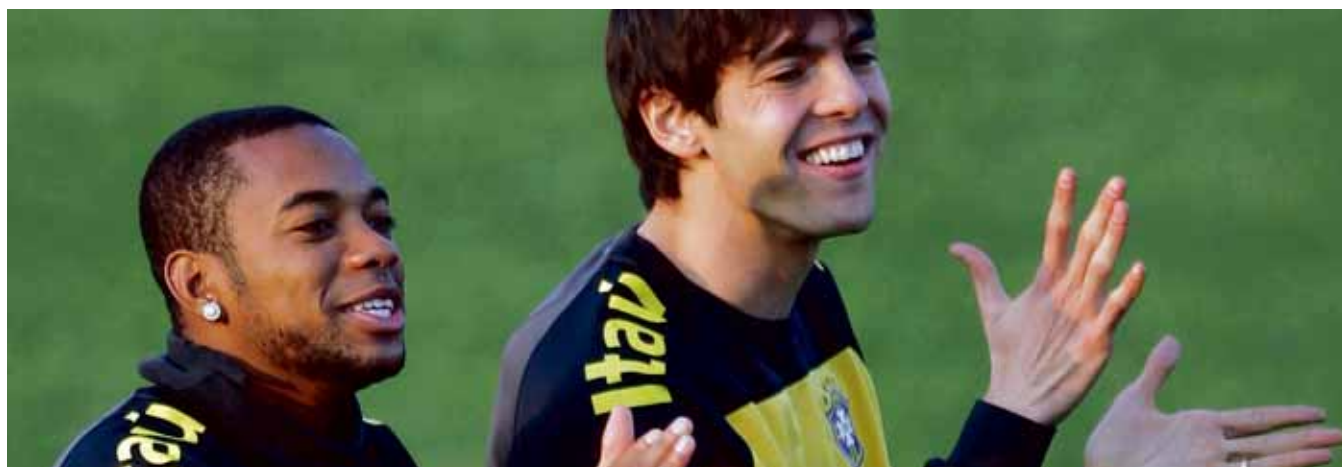
Lífið er eins og konfektikassi Brasilíumaðurinn Kaka þarf ekki að órvænta þegar fótboltaferill hans er á enda. Miðað við þessa tilburði er hann nær öruggur um að fá titilhlutverkið í kvikmyndinni Forrest Gump ef það verður einhvern tímann ráðist í að endurgera hana.