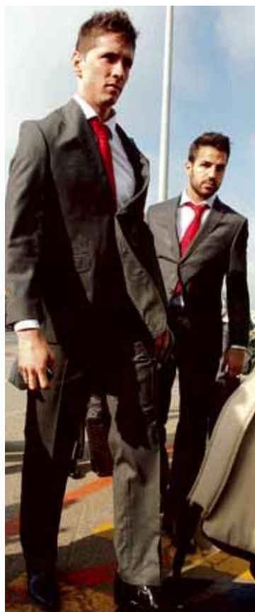
Sjóðheitir Torres og Fabregas fengu hlutverk í Dressman-auglýsingu.

Útsendari Monitor í Suður-Afríku veit ekki mikið um knattspyrnu og tók púlsinn á því besta utan vallarins