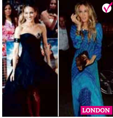
Sarah Jessica Parker í kjól úr sumarlínu 2008 frá Alexander McQueen og með Philip Treacy hatt. Algjört haute couture lúkk sem við erum ekki sérlega hrifnir af. Hinsvegar erum við ástfangin af.