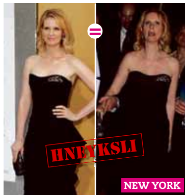
Cynthia Nixon fór öruggu leiðina, engin geimvísindi hér á ferð.