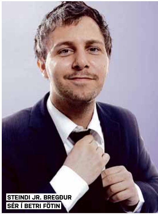
STEINDI JR. BREGÐUR SÉR Í BETRI FÖTIN