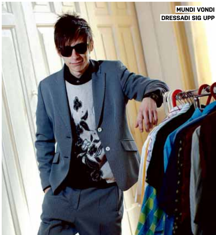
MUNDI VONDI DRESSADI SIG UPP