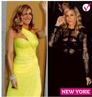
Sarah Jessica Parker var glæsileg í Valentino á frumsýningunni en við erum hrifnari af Elie Saab kjólnum og Nicholas Kirkwood hælnum í eftirpartíinu.