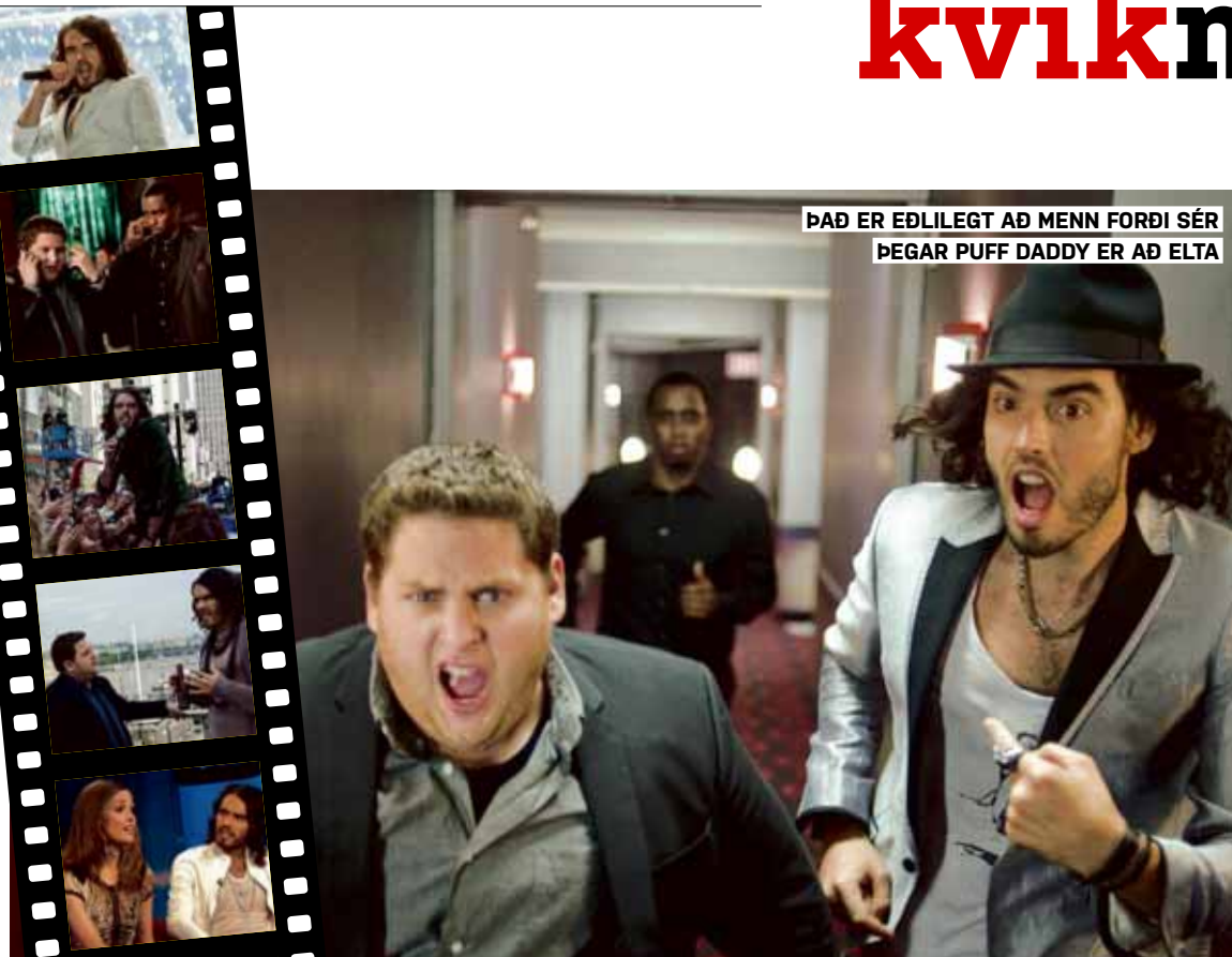
ÞAD ER EDLILEGT AÐ MENN FORÐI SÉR ÞEGAR PUFF DADDY ER AÐ ELTA