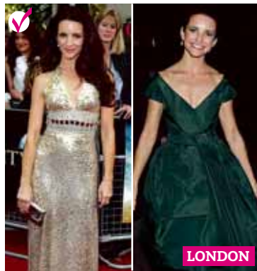
Kristin Davis klæddist vintage Norman Norell á frumsýningunni og hélt striki í óaðfínnanlegum klæðaburði. Christian Dior kjóllinn í eftirpartíinu olli þó heldur vonbrigðum.