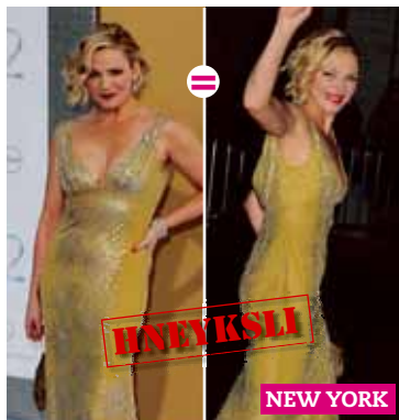
Kim Cattrall er kynþokkafull í Naeem Khan og ber aldurrinn vel.