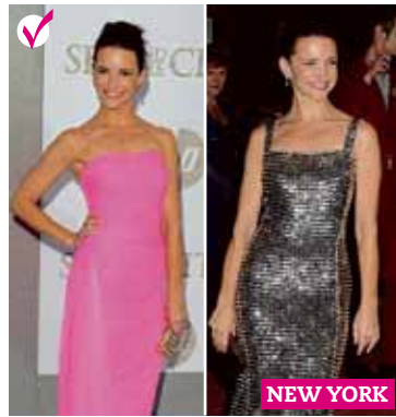
Kristin Davis er flott í vintage Jean síðkjól á frumsýningunni. Í eftirpartíinu klæddist hún glamúr kjól frá Pierre Balmain. Við elskum Kristin Davis.