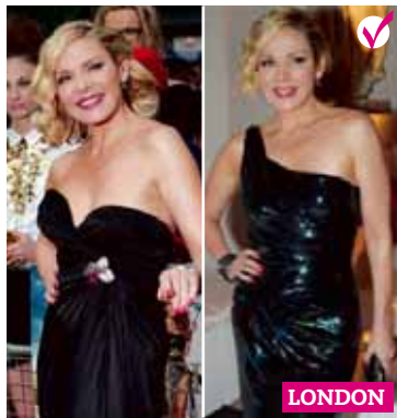
Kim Cattrall í klassískum Thierry Mugler silkisíðkjól á frumsýningunni. Í eftirpartíinu var hún í mun nútímalegri kjól.