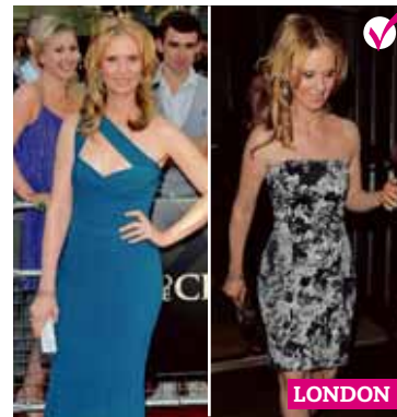
Cynthia Nixon í Narciso Rodriguez á frumsýningu. Það er eitthvað óspennandi við kjólinn en hárið á henni óvenju flott. Í eftirpartíinu var hún meiri skvísa í kjól frá Erdem.