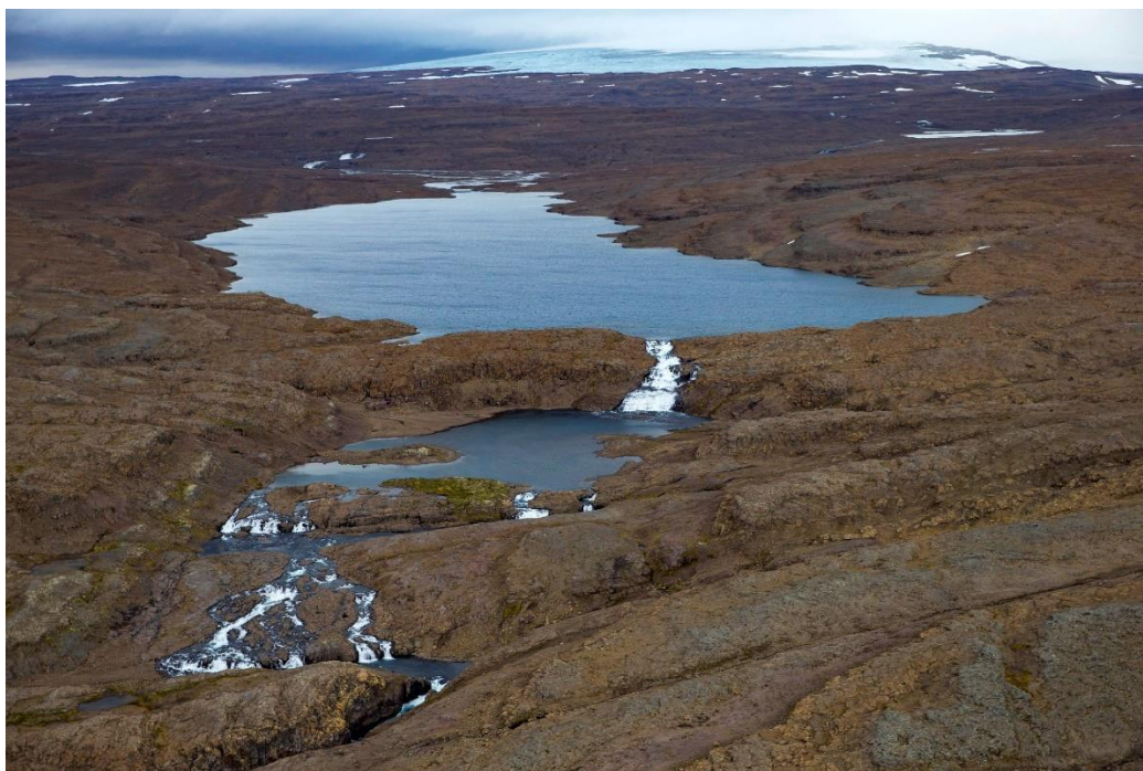
Eyvindarfjarðarvatn og Eyvindarfjarðará, Drangajökull í baksýn. Ljóm: Golli/Kjartan Þorbjörnsson. Birting heimil.

Jarðamörkin sem Sigurgeir Skúlason landfræðingur dró upp í samræmi við þinglýst landamerkjabréf frá 1890. Á kortið hefur jafnframt verið dregin lína sem sýnir varakröfu eigenda Drangavíkur í landamerkjamálinu.