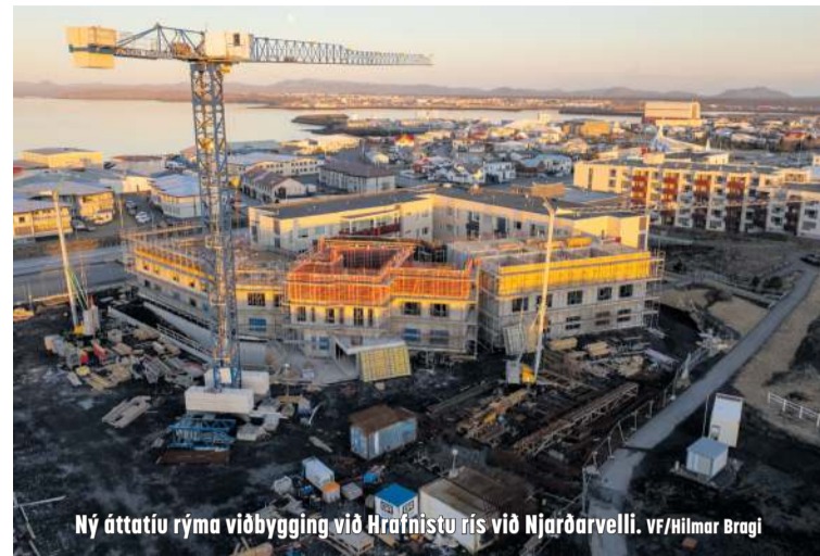
Ný áttafjú rýma viðbygging við Hafnistu rís við Njarðarvelli.

„Ég er sammála velferðarráði og tek undir með að brýn þörf er fyrir fjölnota þjónustuúrræði fyrir fötluð börn og ungmenni. Það er mjög mikilvægt að fötluð börn njóti sambærilegra lífsgæða og aðrir þjóðfélagsþegnar.