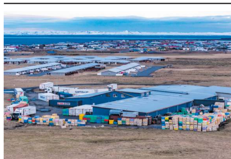
Skálareykjavegur 10 og 12 í Garði.

Pau sem telja sig eiga hagsmuna að gæta eru hvött til að kynna sér tillöguna og koma með sínar athugasemdir eigi síðar en 5. júní 2024 í gegnum Skipulagsgátt Skipulagsstofnunar.