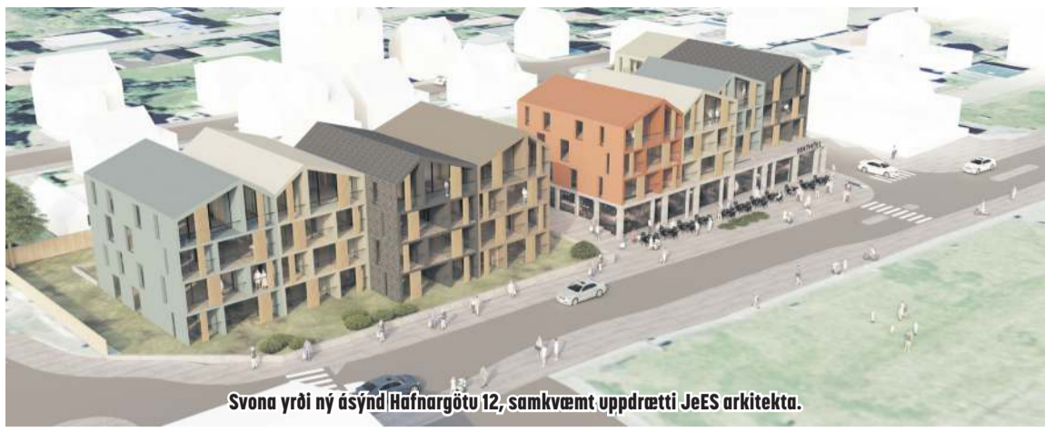
Svona yrði ný á mynd Hafnargötu 12, samkvæmt uppdrætti JeES arkitekta.