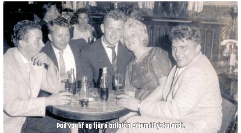
Það var líf og fjör á bítlatónleikum í Þýskalandi.

Blaðamaður er mikill aðdáiandi Bítlanna. Honum fannst sérstakt að hitta mann um daginn sem hafði þá sögu að segja að pabbi sinn hefði verið í siglingum. Eftir að hafa landað í Bremerhaven í Þýskalandi vildu hann og félagar hans frekar kíkja út á lífið í Hamborg. Þeir báðu leigubílsstjórnann