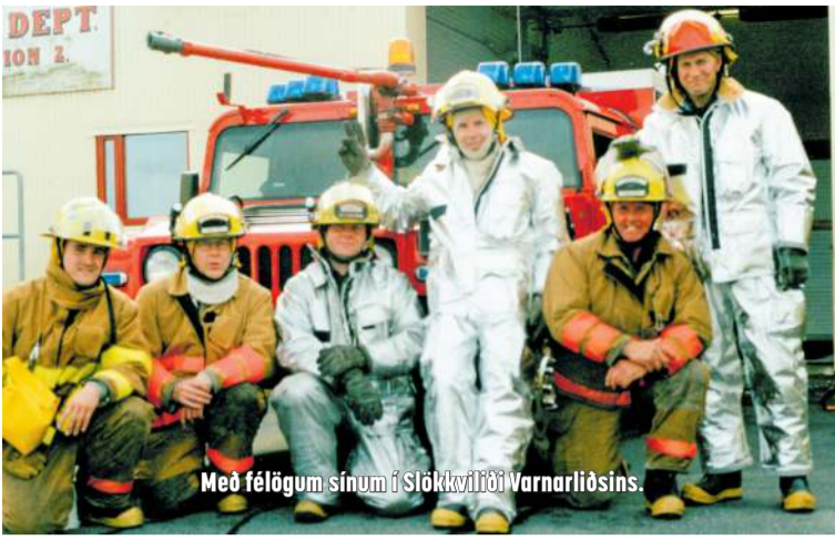
Með félögum sínum í Slökkviliði Varnarliðsins.