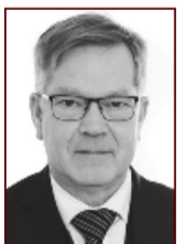
Hálfán 898 5765