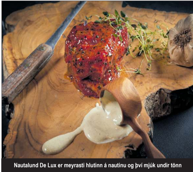
Nautalund De Lux er meyrasti hlutinn á nautinu og því mjúk undir tönn

Hitið grillið mjög vel, lokið lundinni á háum hita í ca. 1-2 mínútur á hvorri hlið. Lækkjið svo hitann á grillinu í ca. 100 gráður og klárið eldun í ca. 52 gráðum í kjarna. Látið steikina hvíla í 5 mínútur.