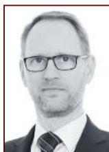
Frímann 897 2468