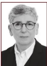
Ólöf 898 3075