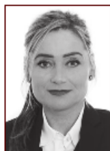
Kristín 699 0512

Stapahrauni 5, Hafnarfirði Sími: 565 9775 www.uth.is - uth@uth.is