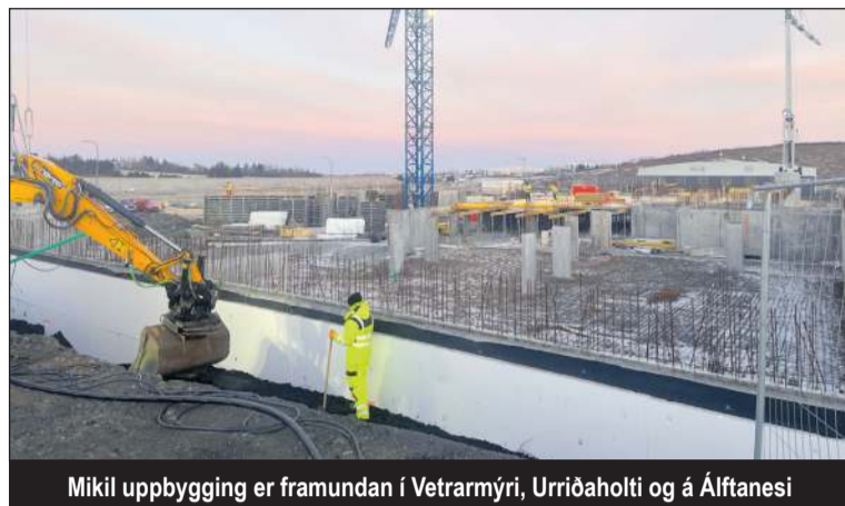
Mikil uppbygging er framundan í Vetrarmýri, Urriðaholti og á Álftanesi

Af því tilefni hefur ráðuneytið óskað eftir að sveitarfélagið taki saman og sendi